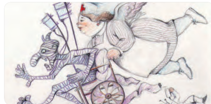
MINOT CENTRAL DE LA FALLA EXPOSICIÓN-MICER MASCÓ DE ESTE AÑO.

Pero por el traje de los sanitarios y la ambulancia que algunos conducen, la imagen parece sacada de épocas pasadas, aunque para conocer de primera mano la crítica de esta Falla a la sanidad habrá que visitar el monumento.