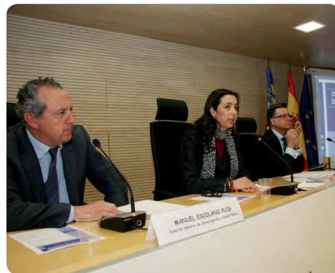
UN MOMENTO DE LA PRESENTACIÓN DEL PLAN ONCOLÓGICO 2011-2014 EN EL CSISP.

Los profesionales de Enfermería realizan un papel muy importante en la prevención ya que una buena educación para la salud es la base para que los ciudadanos adquieran cada vez más hábitos de vida saludables.