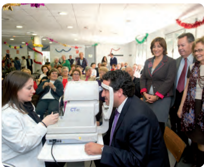
CAMPAÑA REALIZADA POR LA FUNDACIÓN DEL HOSPITAL PROVINCIAL DE CASTELLÓN.

EL 12 DE MARZO SE CONMEMORA EL DÍA MUNDIAL DE ESTA ENFERMEDAD. LOS EXPERTOS ADVIERTEN DE LA IMPORTANCIA DE LA DETECCIÓN PRECOZ