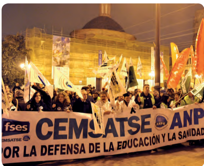
UN MOMENTO DE LA MANIFESTACIÓN DEL 25 DE FEBRERO

ENFERMERÍA LUCHA PORQUE SE MANTENGA LA CALIDAD ASISTENCIAL DE LA SANIDAD Y PLANTEA ALTERNATIVAS AL AJUSTE ECONÓMICO DEL CONSELL