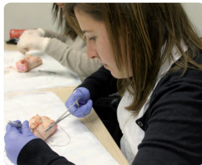
UNA DE LAS ALUMNAS DEL TALLER DE SUTURAS.

Una apuesta constante por las acciones de formación continuada que permiten el aumento de los conocimientos, mejorando las habilidades y fomentando las actitudes más acordes con las necesidades de los pacientes y usuarios.