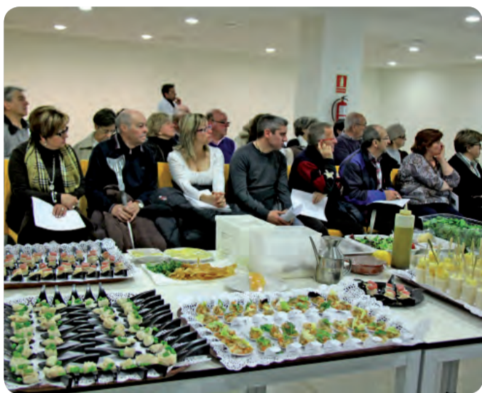
UN MOMENTO DEL TALLER PARA PACIENTES QUE PADECEN DIABETES TIPO 2..

LA FE DE VALENCIA HA ACOGIDO UN TALLER DE ALIMENTACIÓN IMPARTIDO POR UNA ENFERMERA ESPECIALISTA EN NUTRICIÓN Y DOS COCINEROS PROFESIONALES