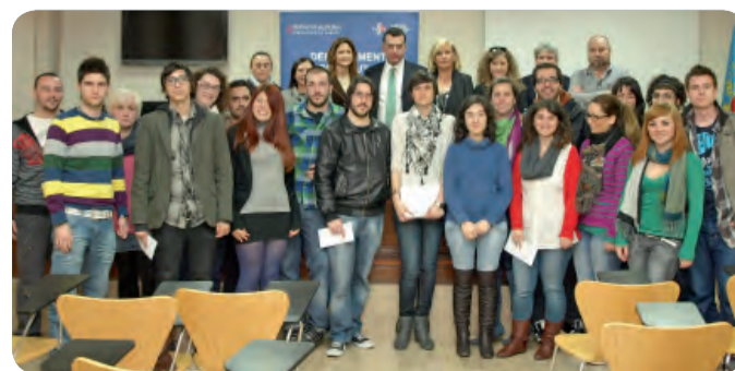
MIEMBROS DE L'ESCOLA D'ART JUNTO A ENFERMERAS Y RESPONSABLES DEL PROYECTO.

Para promocionar el acercamiento intergeneracional y mejorar la comunicación entre las personas mayores y los jóvenes, los responsables convocaron un concurso de imágenes al que han concurrido alumnos de l'Escola d'Art Superior de Disseny de Castelló.