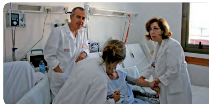
LA SUPERVISORA Y EL MÉDICO ADJUNTO DE LA UCE DEL HOSPITAL DOCTOR PESET.

En ella se han tratado aspectos tan importantes como la valoración nutricional de los pacientes, los cuidados de Enfermería, la fisioterapia respiratoria o el informe de cuidados de Enfermería al alta del paciente.