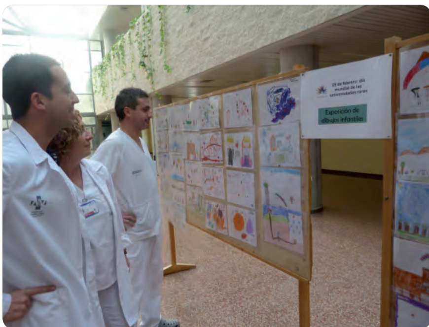
EXPOSICIÓN DE DIBUJOS Y MENSAJES REALIZADA POR NIÑOS AFECTADOS POR ESTAS PATOLOGÍAS.

El carácter crónico de estas patologías hace fundamental el apoyo a los pacientes que las sufren. En la Comunidad Valenciana se calcula que unas 300.000 personas las padecen