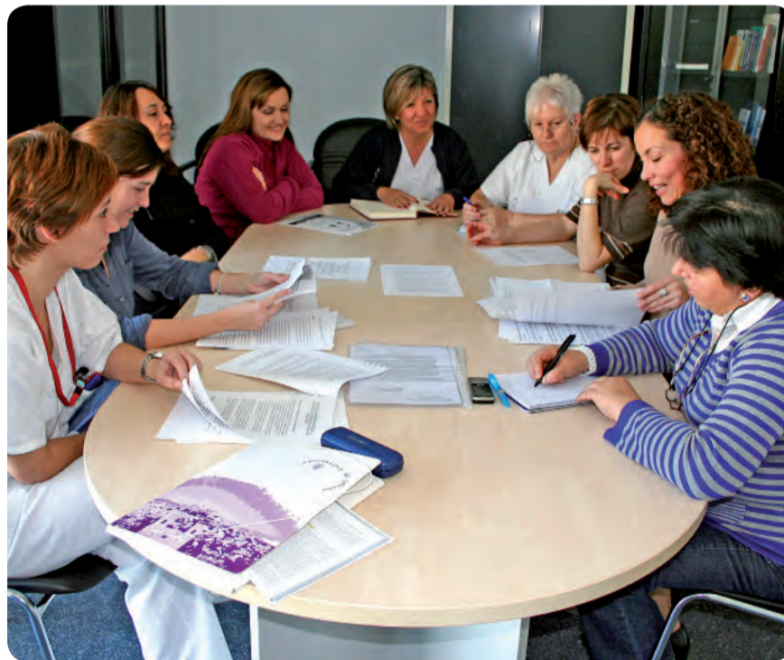
MIEMBROS DEL COMITÉ DE LACTANCIA DEL HOSPITAL GENERAL DE ELDA.

La leche materna proporciona la alimentación ideal al niño durante sus primeros meses de vida, contribuye a su desarrollo saludable y reduce la gravedad de las enfermedades infecciosas. Así lo recuerdan los profesionales sanitarios implicados en el nacimiento, puerperio y desarrollo del bebé.