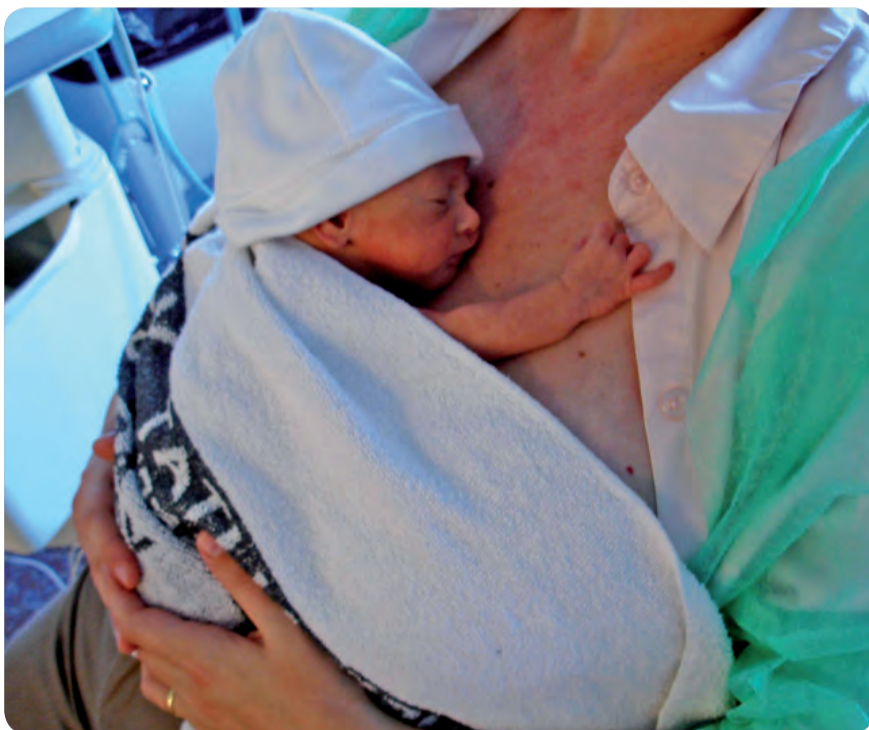
UNA MADRE EN EL CONTACTO PIEL CON PIEL CON SU HIJO RECIÉN NACIDO.

LOS COMITÉS DE LACTANCIA MATERNA UNIFICAN CRITERIOS Y PRÁCTICAS DE ACTUACIÓN ENTRE PROFESIONALES DE ATENCIÓN PRIMARIA Y ESPECIALIZADA