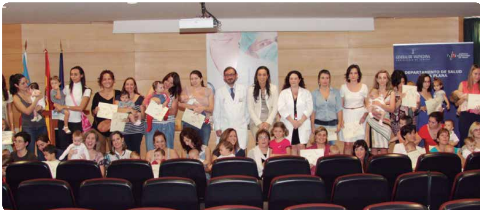
FOTO DE FAMILIA DE LA ENTREGA DE RECONOCIMIENTOS A LAS MADRES DE BEBÉS LACTANTES DE LA PLANA.

EN 14 DE LOS 20 DEPARTAMENTOS DE LA COMUNITAT EXISTEN GRUPOS PARA LA HUMANIZACIÓN DE LA ASISTENCIA AL NACIMIENTO Y LACTANCIA