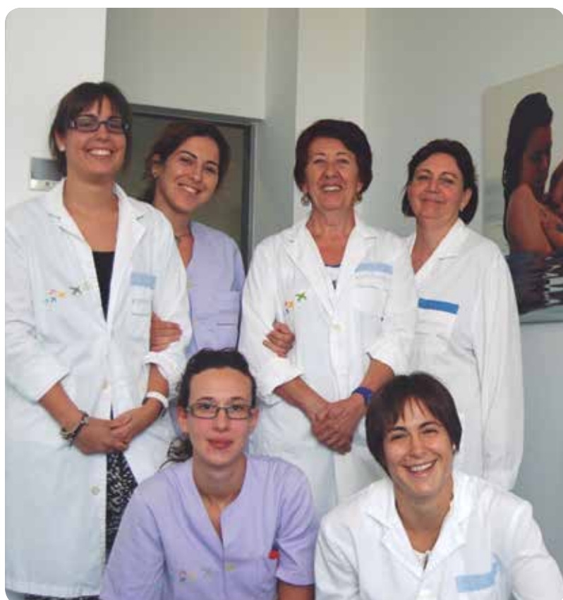
PARTE DEL EQUIPO DE MATRONAS DEL DEPARTAMENTO DE SALUD DE DÉNIA.

previas al Servicio de Ginecología y Obstetricia para conocer el entorno donde darán a luz al bebé y también se encargan de la formación básica de la persona elegida para estar con la madre en el alumbramiento. Las mujeres también pueden elegir la postura y cuentan con determinados elementos de ayuda en el parto natural, como una pelota para sentarse o la silla de partos. Además se les permite traer objetos personales, que van desde iluminación, música o almohadones con el objetivo de convertir el alumbramiento en algo natural y enfrentarse a él con mayor seguridad. Aunque el Departamento impulsor garantiza la anestesia epidural en el 100 por 100 de los casos, las mujeres también tienen a su disposición el Plan de Parto para que puedan elegir cómo quieren dar a luz a su bebé.