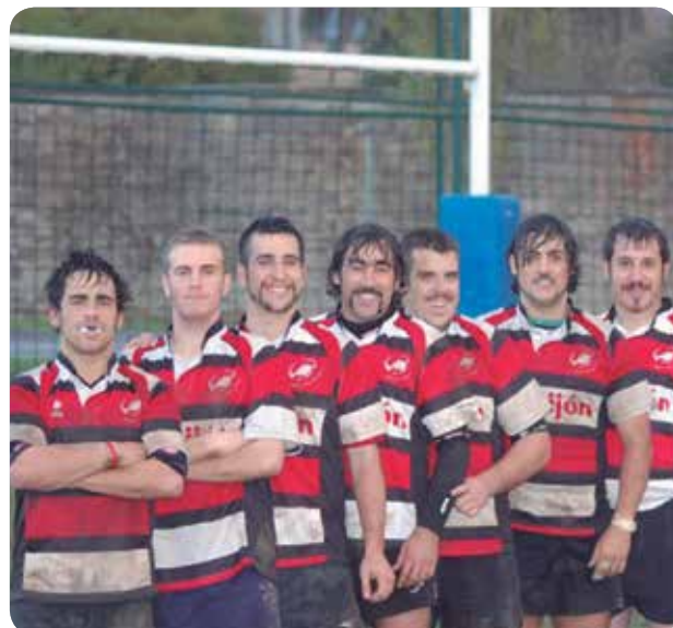
EL GIJÓN RUGBY CLUB PARTICIPÓ EN MOVEMBER 2011.

Los 'bigotes Movember' crecieron por primera vez en Australia en 2003 y, desde entonces, se han extendido por todo el mundo. Actualmente, se llevan a cabo campañas oficiales en España, Australia, Nueva Zelanda, EE.UU., Canadá, Sudáfrica y la mayoría de países de la Unión Europea. El objetivo de la Fundación Movember es "tener un impacto permanente en las condiciones de la salud del hombre". Con este fin, ha establecido el Movember Global Action Plan para "acelerar los resultados de investigación en cáncer de próstata a través de la colaboración en áreas científicas prioritarias".