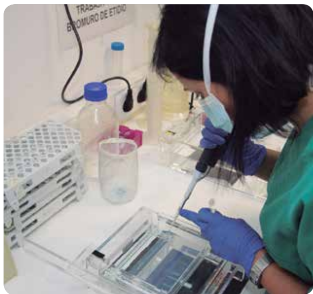
350 PACIENTES DE HEMOFILIA RESIDEN EN LA COMUNITAT VALENCIANA.

EL TRABAJO COORDINADO DE LA ATENCIÓN ESPECIALIZADA DE ENFERMERÍA Y DIFERENTES ÁREAS MÉDICAS POSIBILITAN ESTE PROGRESO