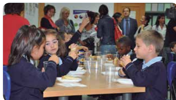
TRES DE CADA 10 MENORES PRESENTAN SOBREPESO U OBESIDAD.

Promover una alimentación saludable es un objetivo prioritario de la Conselleria de Sanitat para mejorar la salud de la población. Enfermedades frecuentes (obesidad, diabetes y enfermedades cardiovasculares) pueden ser prevenidas mediante una adecuada alimentación y estilo de vida. Enfermería recuerda que el ámbito educativo es el entorno perfecto para concienciar a niños y jóvenes sobre hábitos saludables con actividades de promoción de la salud e iniciativas innovadoras en la prevención de enfermedades. Por ello, la Enfermera Escolar es una buena herramienta para luchar contra el exceso de peso en la infancia y en la adolescencia, educando a la población escolar en hábitos saludables.