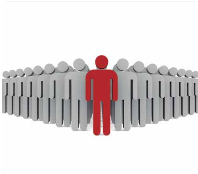
UNA DE CADA 10 PERSONAS POSEE UNA ENFERMEDAD MENTAL, SEGÚN DATOS DEL MINISTERIO.

EL DÍA MUNDIAL DE LA SALUD MENTAL RECUERDA LA IMPORTANCIA DE UNA ASISTENCIA INTEGRAL DE SANITARIOS, FAMILIARES Y ASOCIACIONES