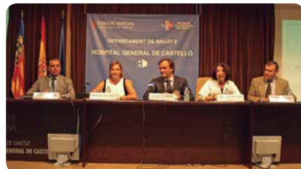
MOMENTO DE LA INAUGURACIÓN DE LAS II JORNADAS AUTONÓMICAS.

Cada día es más habitual oír hablar de la seguridad del paciente ya que es éste el centro de la atención de toda asistencia sanitaria y la misma ha de ser, no solo de calidad, sino también segura. El Hospital General de Castellón ha acogido las II Jornadas autonómicas organizadas por la Sociedad Valenciana de Calidad Asistencial. En ellas más de 100 profesionales sanitarios, entre enfermeros y médicos, han intercambiado conocimientos y experiencias que se están implementando en el sistema sanitario en materia de calidad. Un ejemplo es el programa INCATIV, sobre seguridad y calidad en la terapia intravenosa. Hablar de la seguridad y la calidad asistencial no es nuevo. En los primeros centros de cuidados hospitalarios impulsados por la considerada pionera de la Enfermería moderna, Florence Nightingale, "las medidas de calidad y seguridad hicieron que los pacientes mejoraran casi un 70% sobre su patología base", han recordado durante las Jornadas.