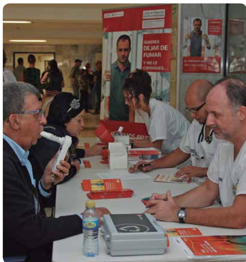
EL PRIMER PASO PARA DEJAR DE FUMAR ES RECONOCER QUE ES UNA ENFERMEDAD.

En estas unidades lo primero que se hace es someter al fumador a una cosimetría y cuando comprueba la realidad, se da cuenta de que sus pulmones están llenos de humo, empieza el camino para aprender a vivir sin tabaco.