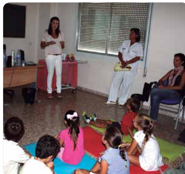
LA ENFERMERA Y LA DERMATÓLOGA DURANTE EL TALLER.

“Las causas de los picores suelen ser la inflamación de la piel en el momento del brote, la sequedad o el estrés”, recuerdan los profesionales. Una buena hidratación, el agua termal o el frío son algunas de las sugerencias expuestas durante el taller. En este sentido, destacan, es importante que el niño siempre tenga a su alcance la crema hidratante y aplicar un emoliente más veces por día en capa fina.