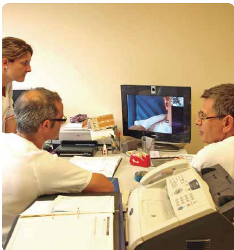
EL CONTROL DE LA HEMODIÁLISIS SE HACE A DISTANCIA.

La Conselleria de Sanitat continúa así el proceso de humanización de la sanidad pública valenciana, permitiendo que los pacientes puedan ser tratados en sus domicilios.