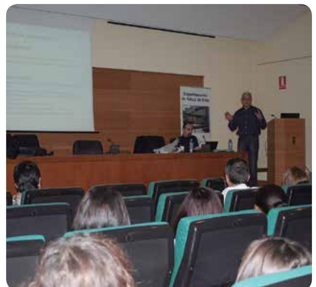
UN MOMENTO DE LA FORMACIÓN SOBRE ESTA MATERIA.

El Hospital de Elda creó el pasado mes de julio un área en Urgencias destinada al tratamiento y estabilización de la patología respiratoria y cardiaca aguda, lo que está permitiendo ofrecer esta asistencia de forma protocolizada y en una zona determinada. La puesta en marcha de esta unidad en Urgencias obliga a mantener actualizados a los profesionales, de ahí la importancia de que todos los médicos y enfermeros que trabajan en la Unidad logren mayor destreza en el uso de estas técnicas, para aplicarlas de la forma más eficiente, recuerdan desde el servicio.