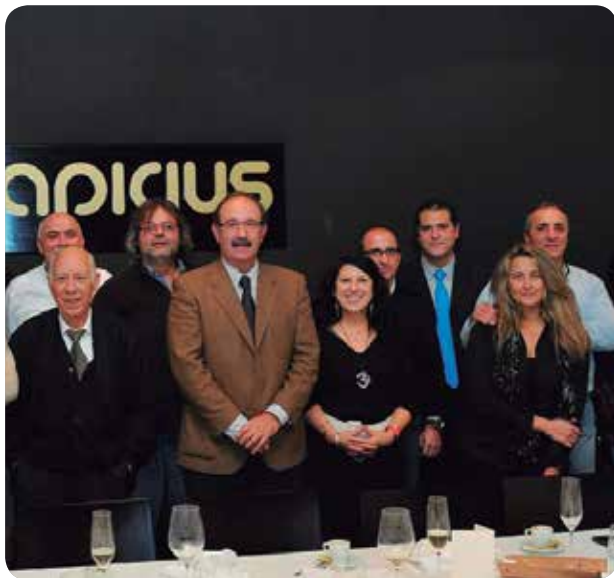
ENCUENTRO CON LOS MEDIOS DE COMUNICACIÓN.

LA ENFERMERA GESTORA DE CASOS REDUCE UN 70% LAS VISITAS DE PACIENTES A URGENCIAS Y UN 80% LOS REINGRESOS HOSPITALARIOS