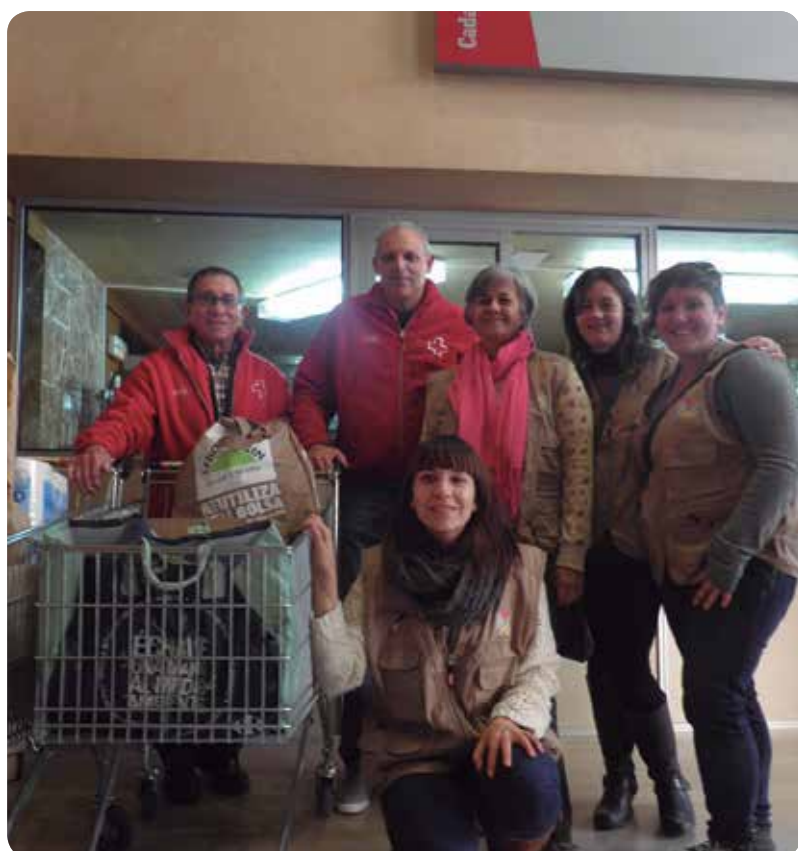
EL GRUPO DE COOPERACIÓN DE ENFERMERÍA DURANTE LA CAMPAÑA DE RECOGIDA DE ALIMENTOS

Una solidaridad que desde las entidades receptoras esperan que se extienda a lo largo de 2013 ya que son muchas las personas que acuden a ellas.