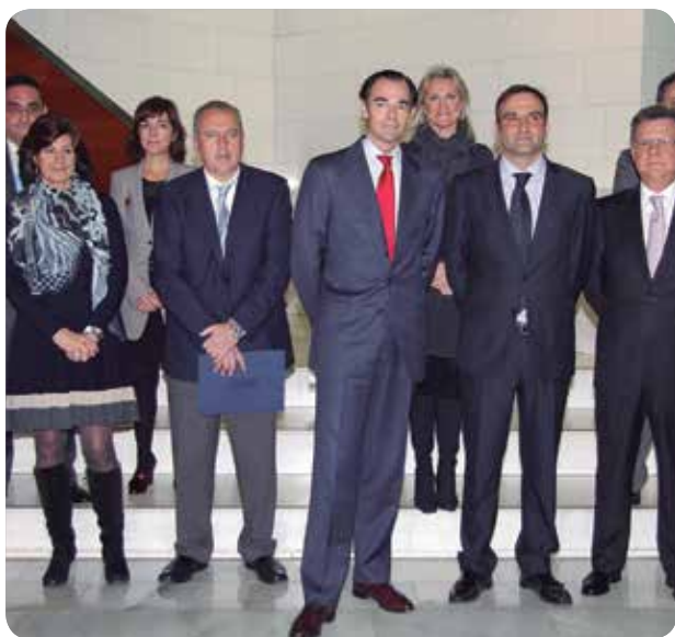
EL CONSELLER DE SANITAT, MANUEL LLOMBART (CENTRO), JUNTO A SU EQUIPO.

MANUEL LLOMBART ES EL NUEVO CONSELLER PARA QUIÉN "LA PRIORIDAD ES EL PACIENTE Y ENTORNO A ÉL DEBE CENTRARSE NUESTRO TRABAJO"