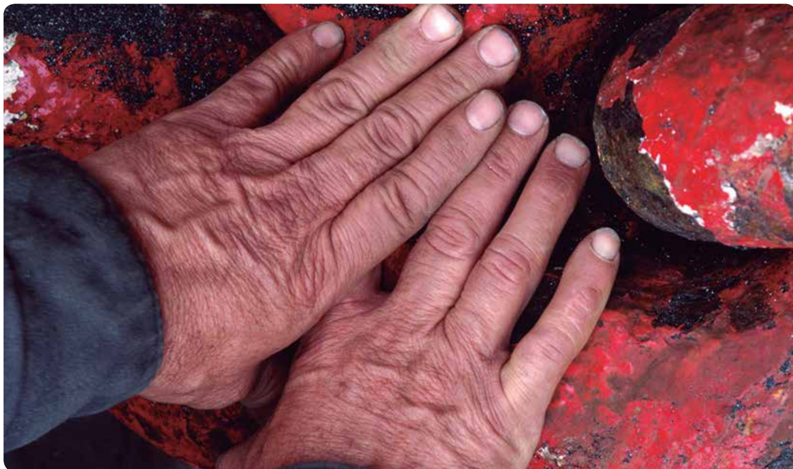
A PARTIR DE LOS 45 AÑOS EL PORCENTAJE DE PADECER ARTROSIS SE INCREMENTA UN 30%.

DIRIGIDO A USUARIOS DE LA SANIDAD DE LA COMUNIDAD VALENCIANA