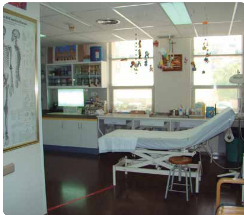
UNIDAD DE INMOVILIZACIÓN INFANTIL DEL HOSPITAL GENERAL UNIVERSITARIO DE ALICANTE.

La Unidad de Inmovilización Infantil, área exclusiva de Enfermería e integrada en la Sección de Traumatología y Ortopedia Infantil del Hospital General Universitario de Alicante, celebra sus 30 años de andadura, con más de 180.000 actuaciones.