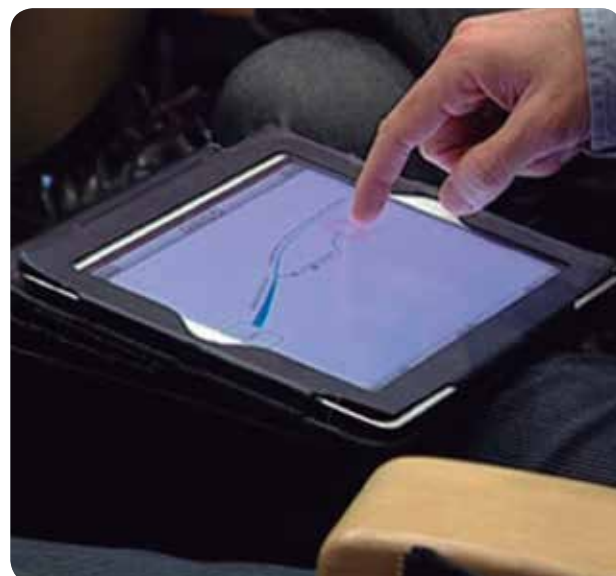
LAS NUEVAS TECNOLOGÍAS ABREN MÁS POSIBILIDADES SANITARIAS.

Una cita en la que se dieron las pautas necesarias para crear un blog o un portal divulgativo de salud con el objetivo de encauzar y apoyar proyectos de profesionales que quieren iniciarse en las nuevas tecnologías. Unas herramientas de trabajo que agilizan y facilitan el contacto entre profesionales y de estos con los pacientes. Buen ejemplo es la implantación, cada vez en más departamentos sanitarios, de la digitalización de documentos y la historia clínica electrónica.