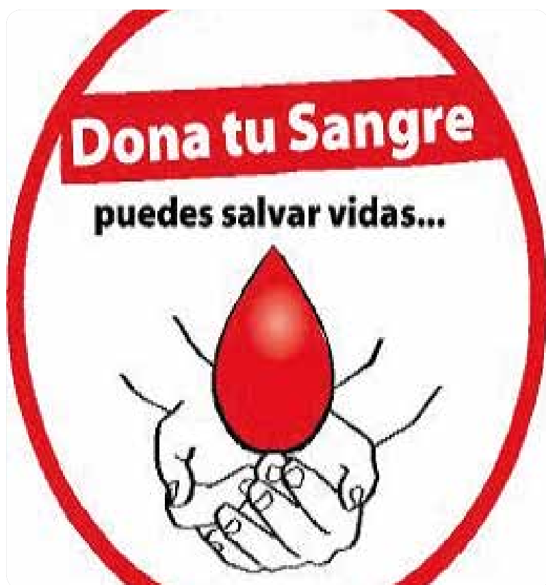
Cabe destacar que la transfusión de sangre y productos sanguíneos contribuye a salvar millones de vidas cada año.

Cabe destacar que la transfusión de sangre y productos sanguíneos contribuye a salvar millones de vidas cada año. Permite aumentar la esperanza y la calidad de vida de pacientes con trastornos potencialmente mortales, así como llevar a cabo complejos procedimientos médicos y quirúrgicos.