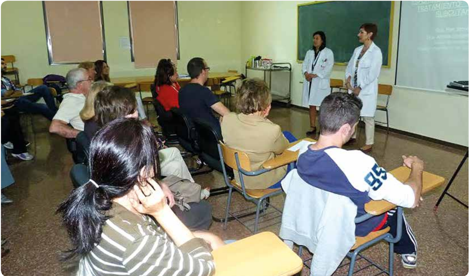
Un momento del taller grupal impulsado por la Unidad de Reumatología del Hospital de Sant Joan de Alicante.

DIRIGIDO A USUARIOS DE LA SANIDAD DE LA COMUNIDAD VALENCIANA