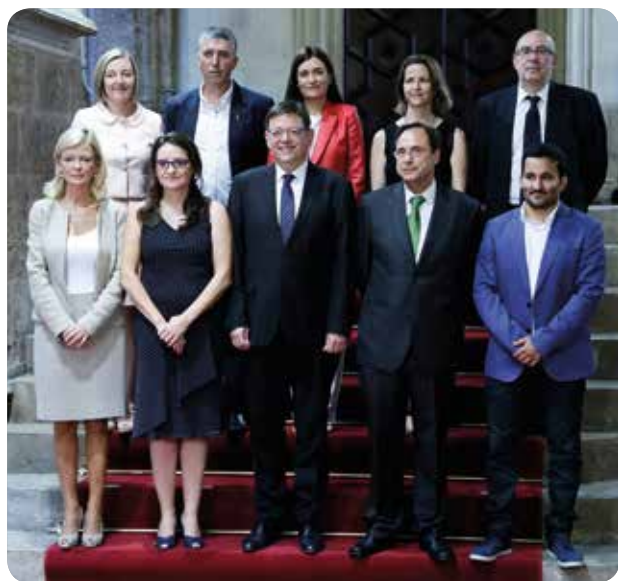
El nuevo Consell está formado por cinco hombres y cinco mujeres.

ENFERMERÍA TIENDE LA MANO A LA NUEVA TITULAR PARA TRABAJAR EN AQUELLO QUE SUPONGA UNA MEJORA PARA PROFESIONALES Y PACIENTES