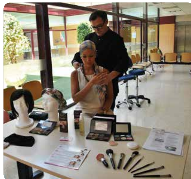
En estos talleres se intercambian experiencias personales.

Las sesiones se basan en diferentes charlas dirigidas por personal de Enfermería y médico del centro en la que se habla sobre autoestima, transformación de la imagen, comunicación con los familiares e hijos, exteriorización de los sentimientos, entre otros aspectos.