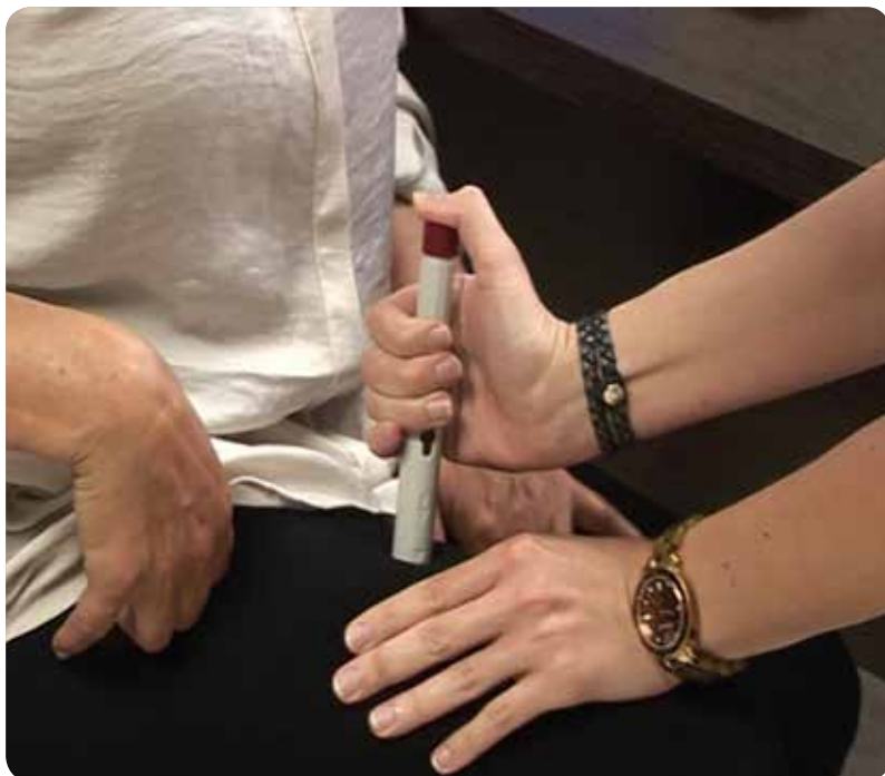
Los talleres se han centrado en tres patologías que requieren tratamiento biológico subcutáneo.

RESOLVER DUDAS PERMITIRÁ REDUCIR LA FRECUENCIA DE LAS VISITAS A LA UNIDAD DE REUMATOLOGÍA Y AGILIZAR LA ATENCIÓN QUE OFRECE