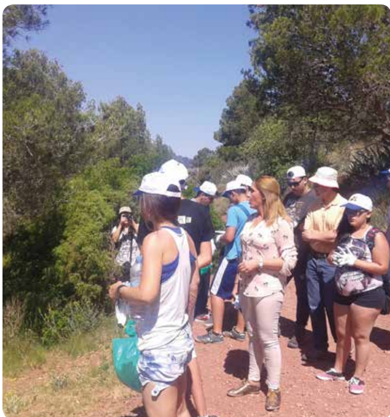
Cubrirse del sol e hidratarse son dos de las precauciones que hay que tomar frente a las altas temperaturas.

El programa se extenderá hasta el próximo 30 de septiembre, con las condiciones necesarias en cada departamento de salud.