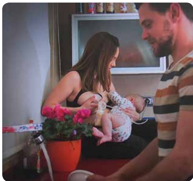
Fotografía ganadora, obra de Clara Gómez.

EL OBJETIVO DE ESTE CERTAMEN ORGANIZADO POR EL GRUP NODRISSA ES NORMALIZAR LA IMAGEN DE LA MUJER EN ACTITUD DE AMAMANTAR