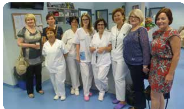
Las tres enfermeras de Finlandia junto a profesionales del Hospital de Sant Joan.

Alas tres profesoras les llamó la atención el elevado grado de comunicación que existe entre los estamentos médico y de Enfermería y se interesaron especialmente por el manejo de los pacientes con Alzheimer y con fractura de cadera.