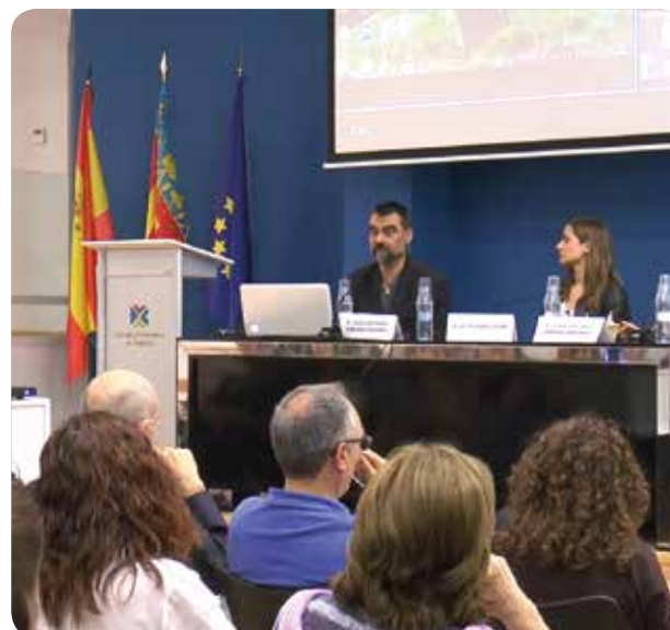
Una de las jornadas de formación que realiza el Grupo de Trabajo en Vacunaciones de CECOVA.

El Grupo de Trabajo en Vacunaciones del CECOVA recordó también "la importancia de llevar a cabo una explicación detallada a los padres sobre los beneficios y riesgos de cada vacuna antes de realizar cada acto vacunal, y recoger el consentimiento informado, que en este caso debe ser verbal, en el registro vacunal o la historia clínica de cada niño, para que queda documentada la aceptación de los padres a la vacunación tras haber recibido toda la información necesaria". Igualmente, incidió "en la necesidad de documentar y notificar cualquier reacción adversa que se puedan detectar en los menores vacunados".