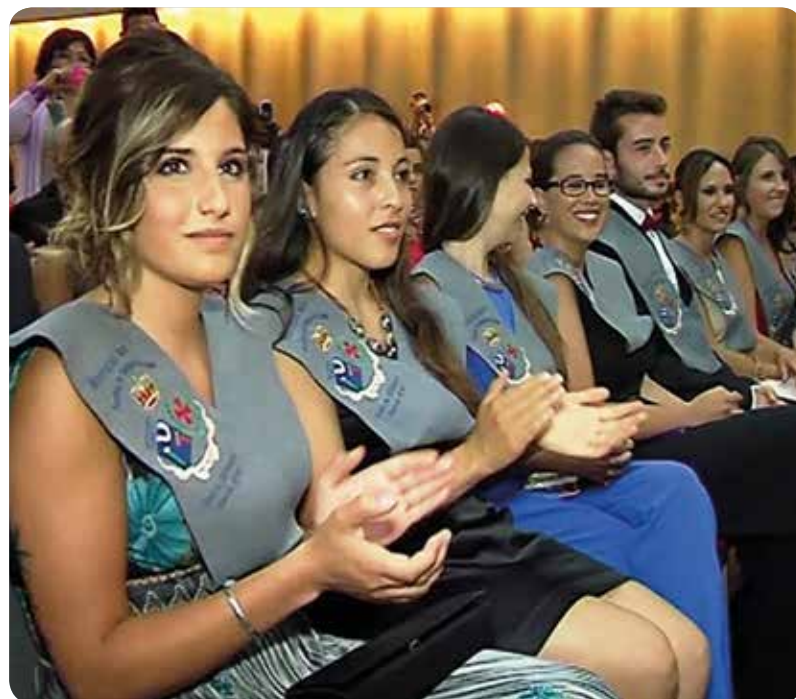
Acto de graduación de la primera promoción del Grado en Enfermería de la Universitat Jaume I de Castellón.

Las Facultades de Ciencias de la Salud y Escuelas de Enfermería de la Comunitat Valenciana graduaron este curso 2014/2015 a cerca de 1.300 nuevos profesionales de Enfermería. Como novedad, la Facultad de Ciencias de la Salud de la Universitat Jaume I (UJI) graduó este curso su primera promoción tras implantar la titulación hace cuatro años.