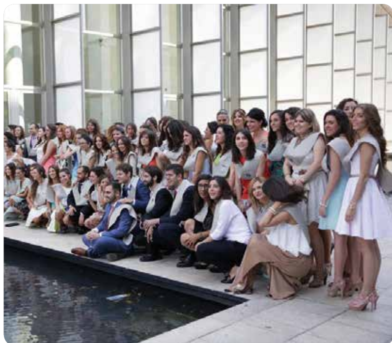
Foto de familia del alumnado egresado de Facultad de Ciencias de la Salud de la CEU-UCH de Valencia.

LA UJI GRADUÓ A SU PRIMERA PROMOCIÓN. EN LA UA Y EN LA UV FINALIZARON LOS ESTUDIOS MÁS DE 200 TITULADOS, RESPECTIVAMENTE