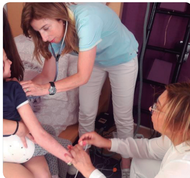
Dos profesionales de la UHD pediátrica atienden a una paciente en su domicilio.

El equipo actual al frente de la UHD pediátrica está compuesto por Enfermería, pediatría, trabajadora social, y cuenta con la colaboración de la Unidad de Salud Mental del departamento.