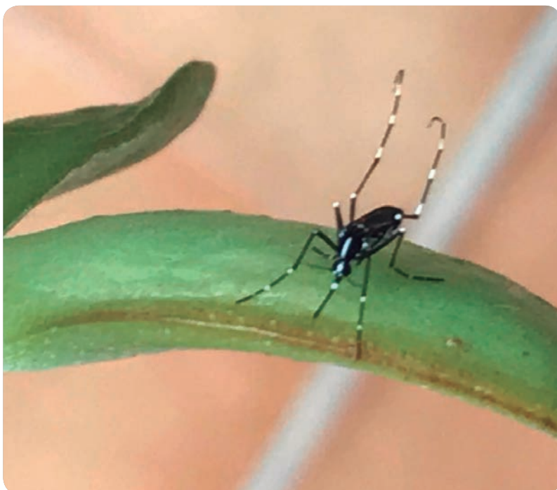
Aedes albopictus.

ES IMPORTANTE QUE LAS ENFERMERAS CONOZCAN CÓMO IDENTIFICAR AL VECTOR, LOS SÍNTOMAS DE LAS ENFERMEDADES Y CÓMO ACTUAR FRENTE A LA PICADURA