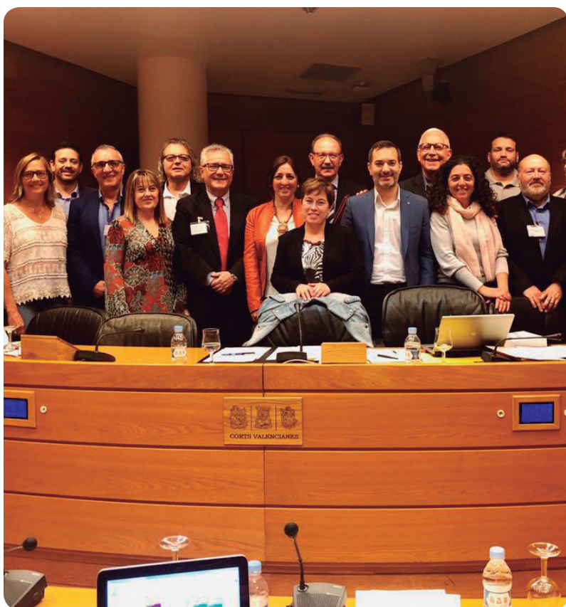
La Comisión de Educación de Les Corts ya apoyó la creación de la Academia.

Un proyecto de gran importancia cuyo principal impulsor ha sido el CECOVA, que junto a los colegios de Enfermería de Alicante, Castellón y Valencia, ha aportado el respaldo jurídico, económico y logístico para la materialización de este proyecto. Un proyecto para el cual también se buscó el respaldo profesional de asociaciones y sociedades científicas de Enfermería, escuelas y facultades de Ciencias de la Salud.