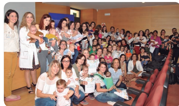
Profesionales del Departamento junto a madres y lactantes.

Se concreta en un decálogo que establece la obligación de tener una normativa escrita sobre lactancia, capacitar a todo el personal para poner en práctica dicha normativa e informar a las embarazadas sobre los beneficios de la lactancia.