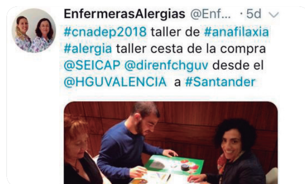
@EnfermerAlergia es el twitter que ha obtenido el primer premio.

Esta profesional destaca que dentro de la Enfermería ha crecido una corriente de uso de las redes sociales basada en compartir, donde los profesionales promueven la humanización de la sanidad, como el programa HURGE (humanización en las urgencias y emergencias), entre otros.