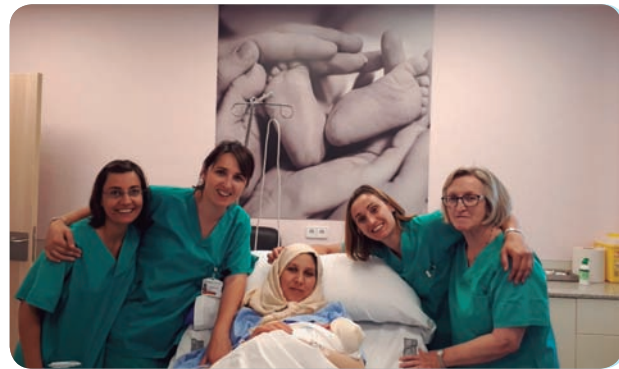
Las profesionales de Sagunto junto a la madre y la bebé.

Así, tras la reforma la Sala de Maternidad queda ubicada junto a Pediatría, con lo que se logra una racionalización de los espacios, aseguran desde el centro.