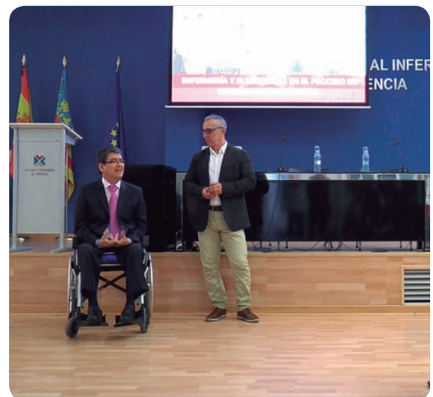
Jornada celebrada en el Colegio de Enfermería de Valencia.

Un ejemplo de la aplicación de la tecnología en esta materia es el sistema Toto Touch de lateralización de pacientes sin utilizar la manos.