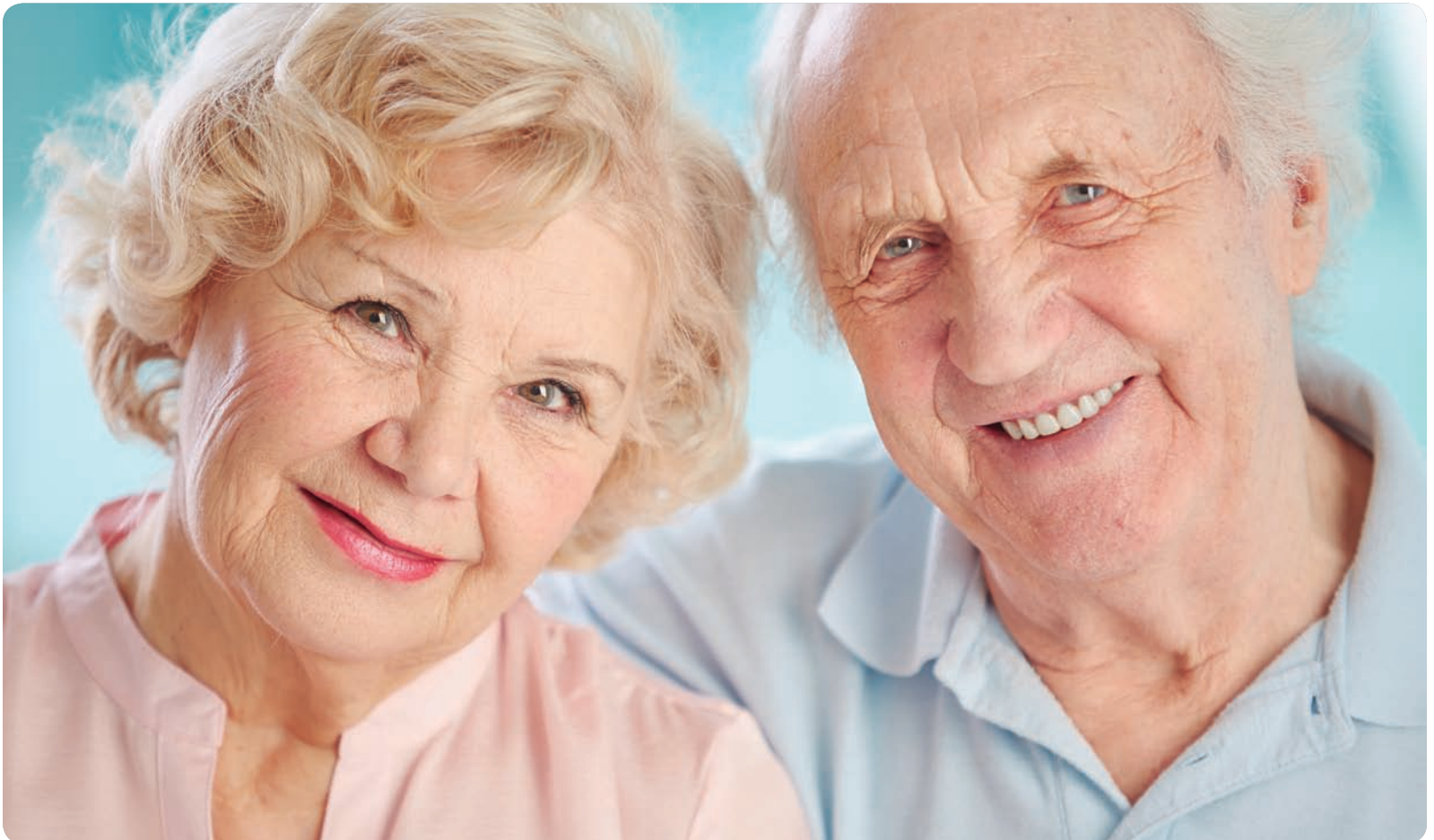
Las enfermeras son una pieza clave en el engranaje de una óptima aplicación y desarrollo del autocuidado del paciente.

DIRIGIDO A USUARIOS DE LA SANIDAD DE LA COMUNIDAD VALENCIANA