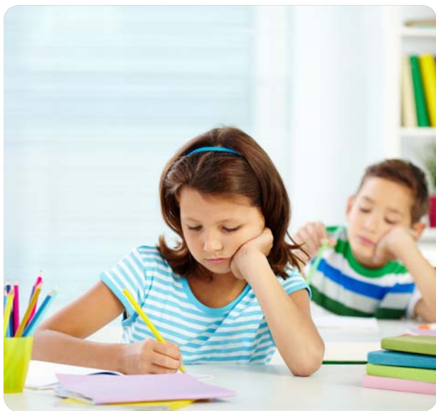
Una resolución regula la atención de los niños con problemas crónicos de salud.

EL CONSEJO DE ENFERMERÍA ESTUDIA PEDIR SUSPENDER UNA NORMA POR LA QUE LA ASISTENCIA DEL ALUMNADO RECAE EN LOS DOCENTES