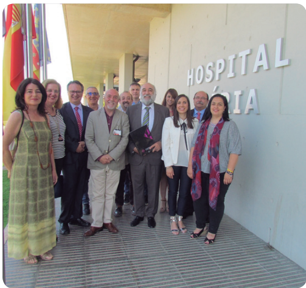
Diez colegios profesionales han debatido sobre colaboración asistencial.

DIEZ COLEGIOS PROFESIONALES HAN DEBATIDO SOBRE COLABORACIÓN Y COOPERACIÓN INTERDISCIPLINARIA Y LOS BENEFICIOS PARA EL PACIENTE