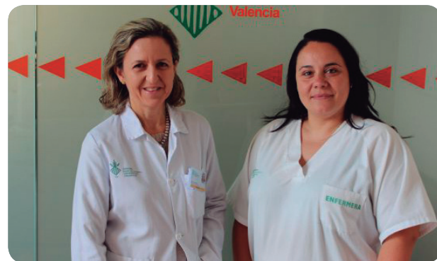
Enfermeras de la consulta de ERCA.

El papel de Enfermería en las unidades de ERCA contribuye al adecuado tratamiento del paciente renal, y su personal está en continua actualización.