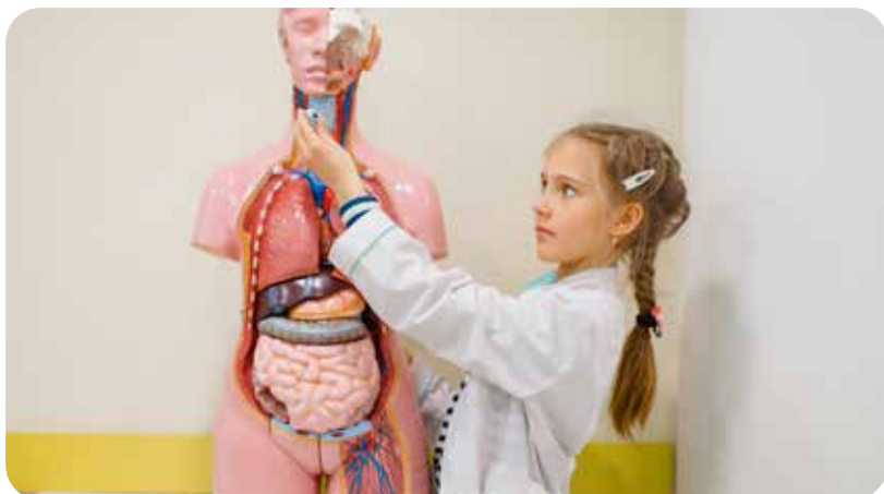
Educación de la Salud

Por estas razones la existencia de la enfermera escolar en los colegios es una tranquilidad para los padres y también para los profesores, sobre los que pesa una enorme responsabilidad ya que su formación está alejada de aspectos más complejos de Sanidad.