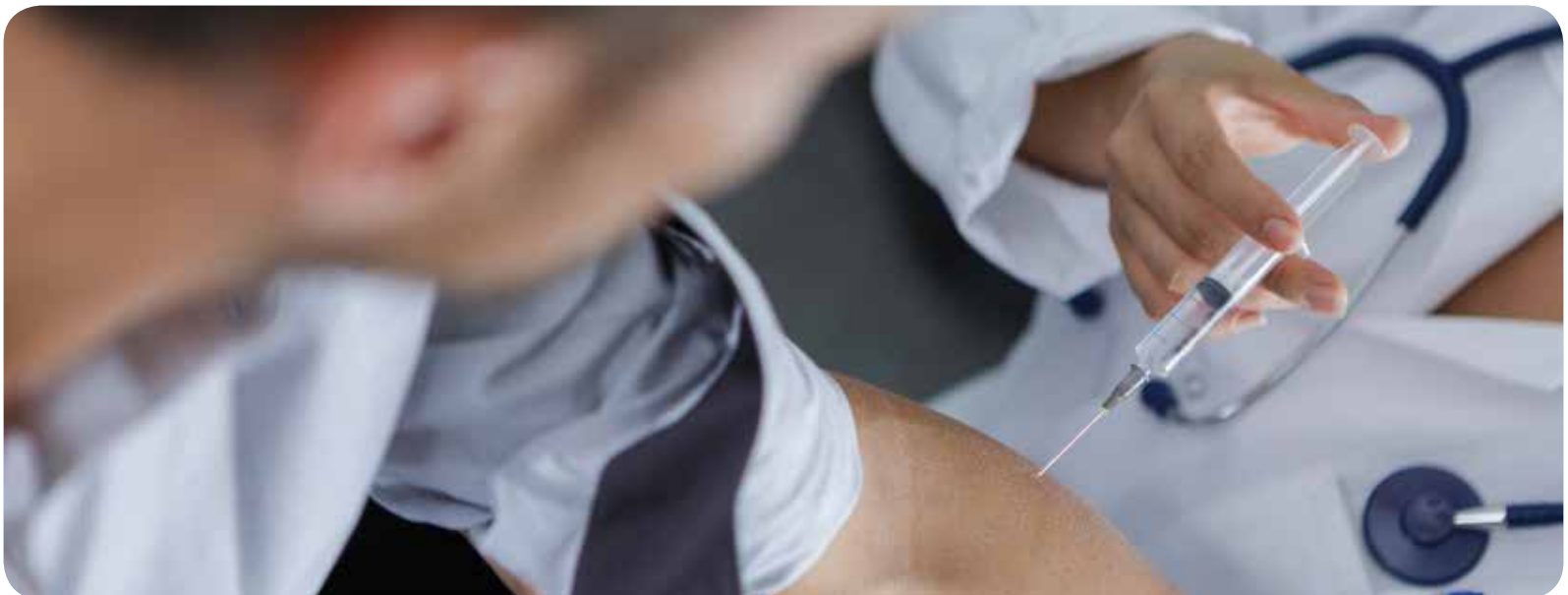
Vacuna contra la gripe

LA CAMPAÑA DE VACUNACIÓN CONTRA LA GRIPE COMENZÓ EL PASADO 4 DE NOVIEMBRE EN LA COMUNIDAD VALENCIANA CON LA ADQUISICIÓN DE 800 000 DOSIS Y SE ESTÁ CENTRANDO EN LOS PRINCIPALES GRUPOS DE RIESGO