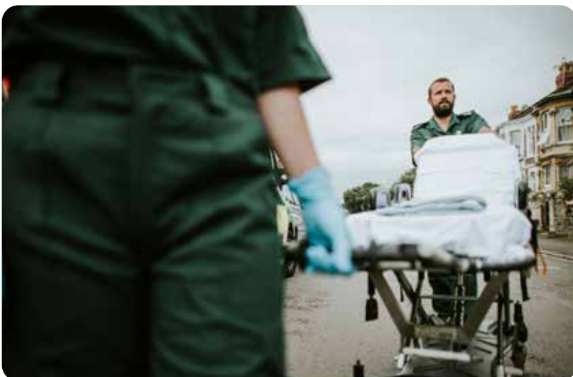
Enfermería en distintos ámbitos

Ante la llegada de la Navidad, las famosas y copiosas cenas y comidas familiares y de trabajo y los extras que se destinan exclusivamente a las fiestas navideñas, como el turrón, roscón, etc. muchas personas deciden escatimar en el aporte calórico los días previos (sin consultar al profesional) o incurrir en dietas milagro y pastillas mágicas después de estos días. El resultado más inmediato puede ser el de la pérdida de peso en el segundo supuesto pero el balance total es negativo ya que en ambos casos se pierde un hábito de alimentación equilibrada que puede provocar fluctuaciones graves en el peso. Reducir el aporte calórico los días previos o incluso después de una comilona es positivo cuando la pauta alimentaria está supervisada por un profesional que ha partido el aporte nutricional de manera equilibrada y personalizada. En el caso contrario, la disminución de calorías sin criterio puede llevar al efecto contrario, una alteración en el metabolismo que provoque un aumento de peso. El mismo resultado se obtiene al depositar toda la fe en las dietas milagro que prometen perder kilos en tiempos récord sin sufrir y las pastillas quemagrasas con las que no se pasa hambre. La Enfermería pone el acento estos días en el mantenimiento de una alimentación sana y aboga por la ingesta de vegetales y el consumo de agua para contrarrestar los excesos. El mejor consejo se lo puede dar su enfermera.