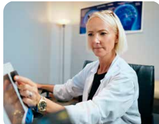
Consulta de Salud Mental

Ante la preocupación del colectivo de enfermeras especialistas en Salud Mental, el CECOVA y la AEESME solicitaron una reunión con los responsables de la Dirección General de Asistencia Sanitaria hace más de un mes la cual no ha tenido respuesta. Una complicada coyuntura que se une a la ausencia de actividades en la Oficina de Salud Mental y que también han denunciado ambos organismos por considerarlo un desmantelamiento práctico.