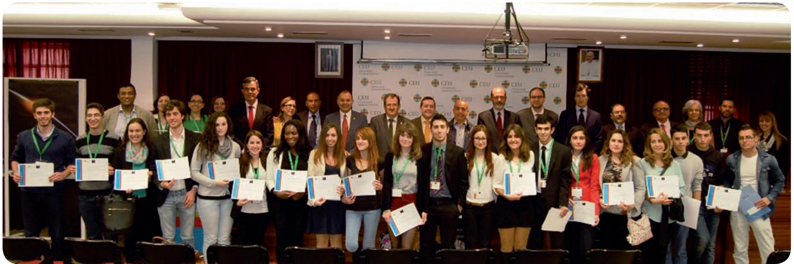
Foto de familia de los organizadores y el alumnado galardonado

La Universidad CEU Cardenal Herrera (CEU-UCH) ha clausurado el XI Congreso Internacional de Estudiantes de Ciencias Experimentales y de la Salud, que ha reunido en el campus de Alfara del Patriarca (Valencia) a más de 150 estudiantes, de grado y posgrado, de las titulaciones de Enfermería, Farmacia, Fisioterapia, Odontología, Medicina, Veterinaria y también de Magisterio