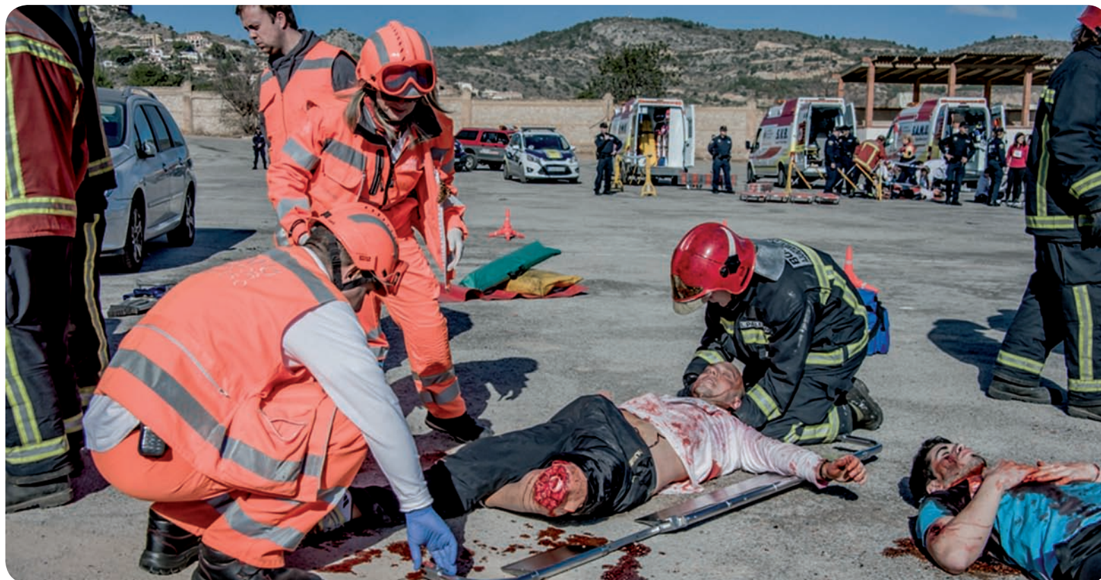
Profesionales sanitarios atienden a un herido durante el simulacro

Los eventos deportivos o cualquier otro con gran concentración de personas son un reto para cualquier profesional de emergencias en el caso de accidente con múltiples heridos. El caos es enorme y saber mantener la calma y atender a las víctimas requiere experiencia y, sobre todo, mucha práctica previa. Ese fue el objetivo del simulacro organizado por la Escuela Universitaria de Enfermería Sagrado Corazón de Castellón, adscrita a la Universitat de València, en el que se plantearon las actuaciones en un caso de explosión dentro de una prueba deportiva.