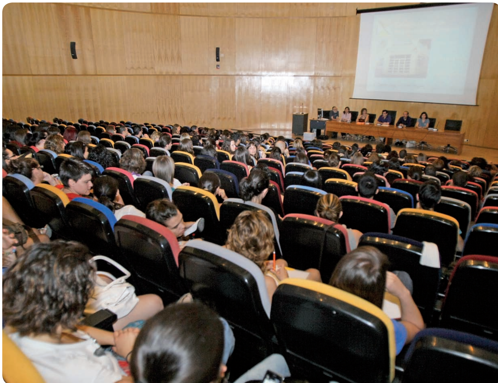
Imagen de una presentación del Colegio de Alicante a estudiantes universitarios

Acercar el Colegio a los estudiantes de Enfermería. Que los futuros profesionales enfermeros conozcan la institución a la que tendrán que pertenecer a la hora de ejercer y que supiesen de primera mano cuál es la amplia cartera de servicios de la que podrán beneficiarse una vez que pertenezcan a su colegio profesional.