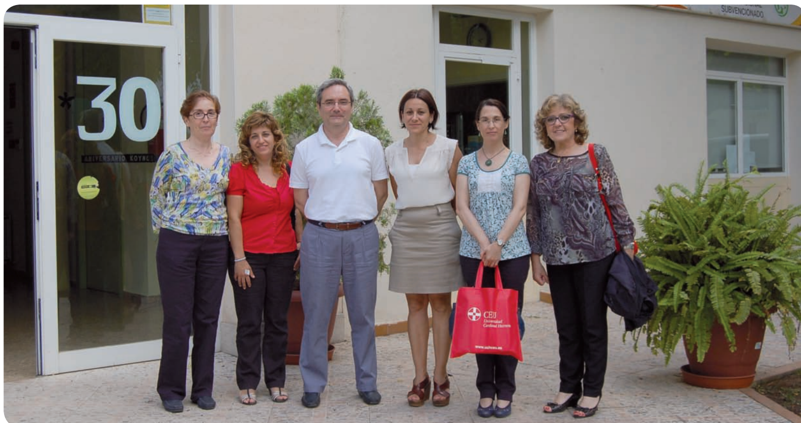
Responsables de la CEU-UCH y Koynos a la puerta del centro de Educación Especial, en Godella