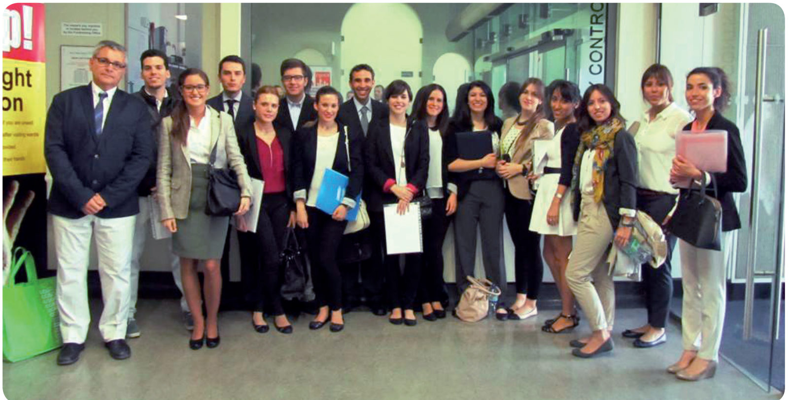
Enfermeros de la CEU-UCH en su visita al King's Hospital para la entrevista de selección

El King's College Hospital, uno de los mayores complejos hospitalarios del Reino Unido con un total de cinco centros en la ciudad de Londres, ha incorporado durante los últimos meses a una treintena de alumnos y antiguos alumnos del Grado en Enfermería de la Universidad CEU Cardenal Herrera (CEU-UCH), que han obtenido un contrato de trabajo en los hospitales situados en la capital británica.