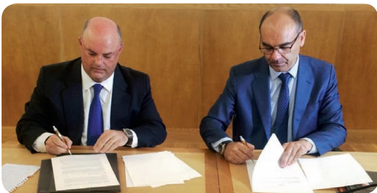
Firma del convenio de colaboración