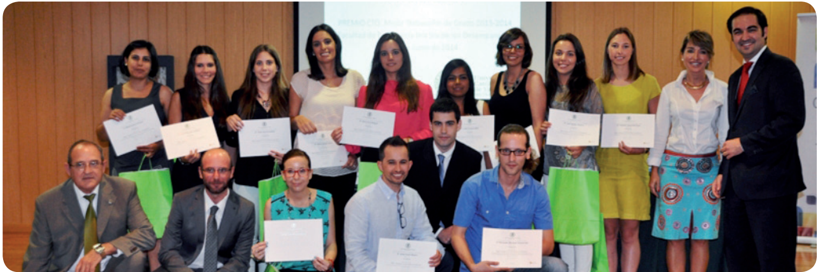
Foto de familia del alumnado finalista junto con los componentes del jurado

El Aula Maïor Agustín García Gascó de la Universidad Católica de Valencia (UCV) ha acogido la I Jornada de Innovación y Transferencia en Enfermería, organizada por la Facultad de Enfermería de la UCV, en la que se expusieron los mejores trabajos de investigación final de grado del alumnado de Enfermería.