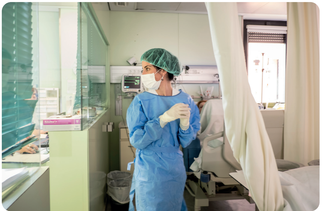
Fotos Banc Imatges Infermeres Autoría: Ariadna Creus y Ángel García

entre el 32 y el 38% del total de los créditos del título, muy por encima del 25% máximo que fija el Real Decreto. De hecho, las prácticas en Enfermería no son prácticas externas, en empresas, son prácticas clínicas dentro del sistema sanitario, y deben ser formadas por aquellos que ya tienen las competencias profesionales en cuidados.