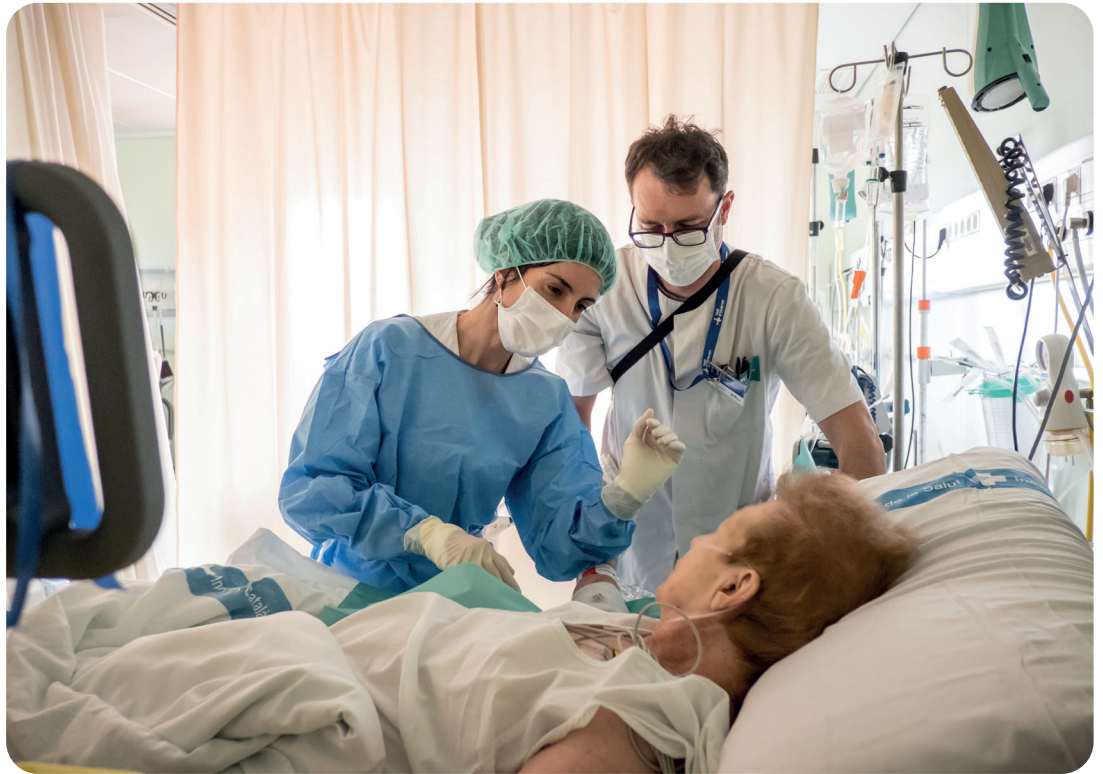
Fotos Banc Imatges Infermeres Autoría: Ariadna Creus y Ángel García

La Directiva Europea que regula la profesión establece un número mínimo de prácticas que se deben cumplir fijado en 2.300 horas. Según los datos del Consejo General de Enfermería estas prácticas deben suponer