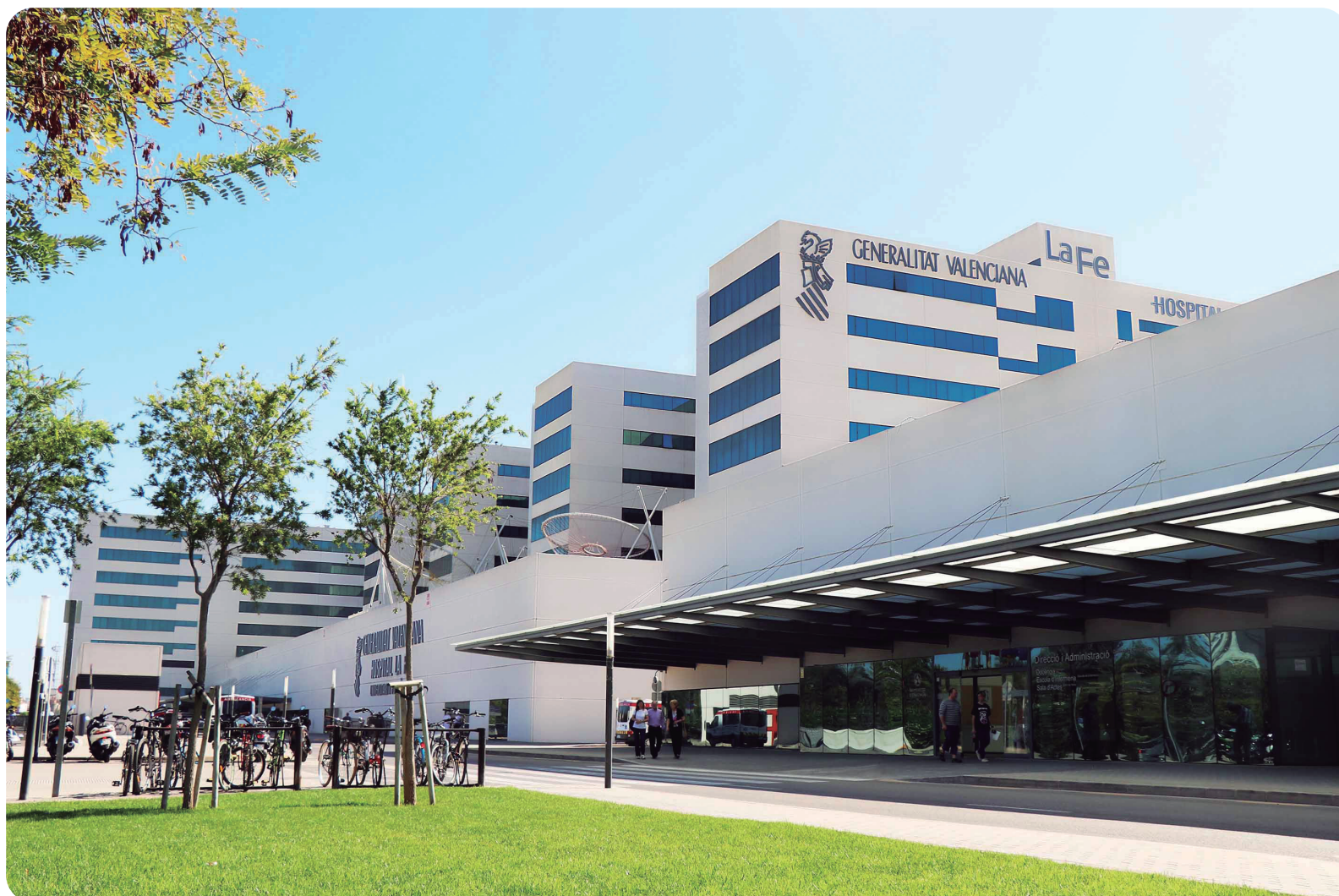
Fachada del Hospital La Fe de Valencia donde se halla ubicada su Escuela de Enfermería.

Agravará aún más la actual falta de enfermeras en la Comunidad Valenciana