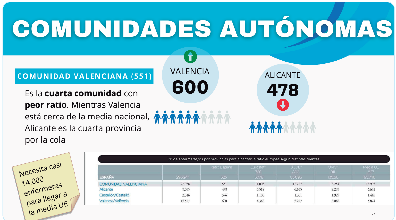
Imagen del informe del Consejo General de Enfermería sobre la ratio en la Comunidad Valenciana

La provincia de Alicante es la quinta de España y la última de la comunidad autónoma