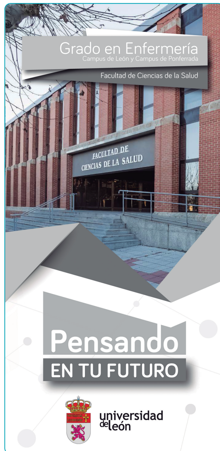
Portada del tríptico del Grado de Enfermería de la Universidad de León

Por lo tanto, se puede deducir que la prevalencia de los actos de intimidación y acoso que sufren los estudiantes está siendo infravalorada por las instituciones, pudiendo ser los datos obtenidos en nuestra investigación la punta del iceberg.