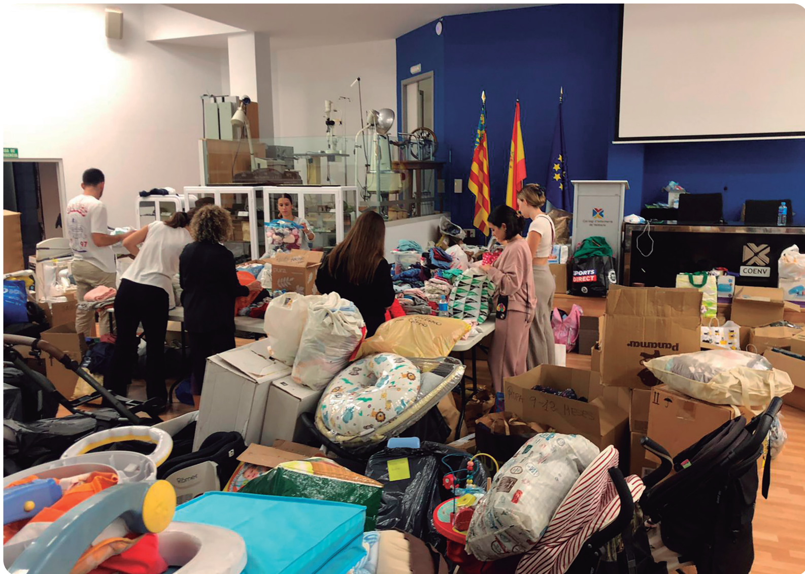
La solidaridad desbordó las instalaciones del Colegio de Enfermería de Valencia

Se unieron al dolor de quienes han perdido a sus seres queridos