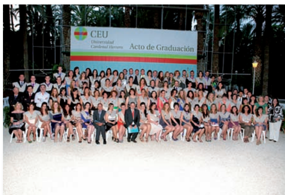
Graduación VI promoción CEU-UCH Elche