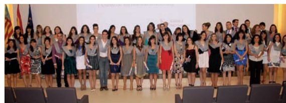
Graduación XXXII promoción EU La Fe (UV)