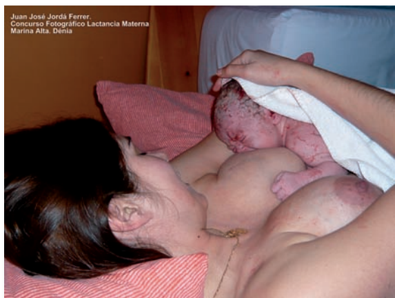
Fotografía premiada por el CECOVA

El XV Concurso Fotográfico de Lactancia Materna de la Marina Alta organizado por el Grup Nodrissa