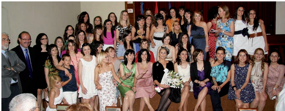
Foto de familia de la XII promoción

La Unidad Docente de Matronas de la Comunidad Valenciana ha celebrado los actos de clausura de la XII promoción de Enfermería Obstétrico-Ginecológica y de bienvenida al alumnado de la XIV. La clausura de la XII promoción, compuesta por 48 matronas, se desarrolló a lo largo de dos días con la presentación de los 16 trabajos de investigación de las Enfermeras Internas Residentes (EIR) que durante los dos últimos cursos se han formado como matronas en la Comunidad Valenciana.