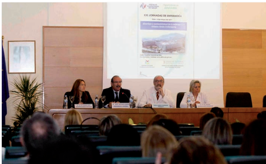
El CECOVA no faltó tampoco este año a la cita con estas jornadas