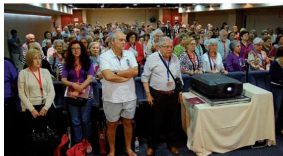
Imagen general de los asistentes

También desde un punto de vista práctico el inspector jefe jubilado del Cuerpo Nacional de Policía Julio Rodríguez añadió su granito de arena con un taller dedicado íntegramente a la autoprotección como medida de seguridad en el que explicó las claves para que una persona de cierta edad pueda prevenir crímenes como el robo, las estafas y similares.