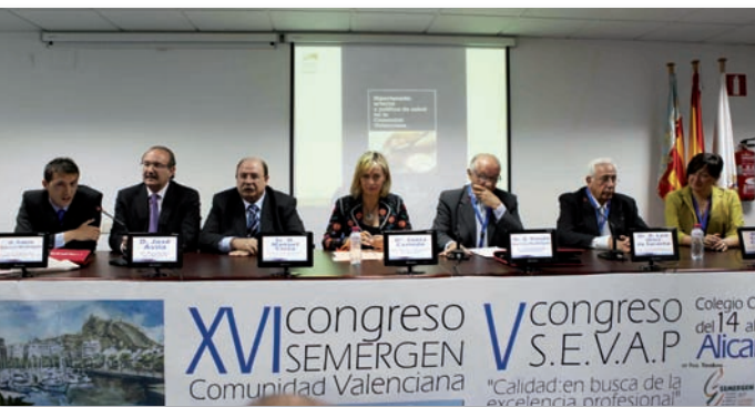
Imagen de la mesa inaugural de las jornadas

Alicante ha acogido el V Congreso de la Sociedad de Enfermería Valenciana de Atención Primaria-SEVAP y XVI Congreso SEMERGEN Comunidad Valenciana, que se realizaron conjuntamente demostrando la necesidad de la unión del equipo para lograr objetivos comunes en la atención a la comunidad. Las jornadas, que reunieron a médicos y enfermeras de Atención Primaria de toda la