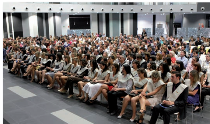
Graduación II promoción CEU-UCH Castellón