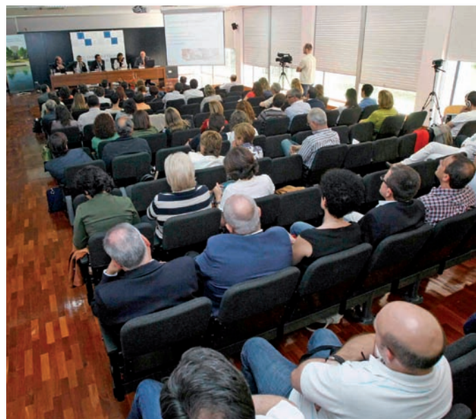
La jornada despertó un gran interés entre el colectivo enfermero

Durante las diferentes intervenciones que incluyó esta actividad quedó de manifiesto que en la actualidad ya existen situaciones en España en las que las enfermeras están asumiendo actividades que podrían enmarcarse en el desarrollo de esta práctica avanzada. Y si bien es cierto que éstas no son en sí mismas "práctica avanzada", sí son un ejemplo de que el sistema y la realidad asistencial ya empiezan a caminar en este sentido.