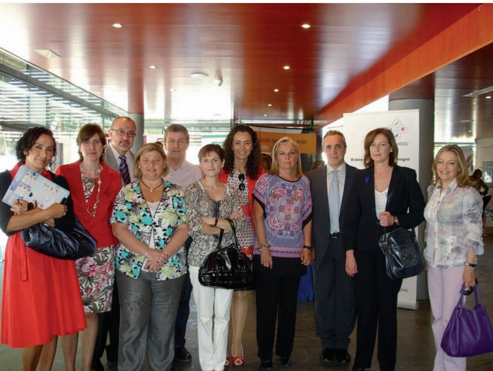
Foto del equipo directivo del Departamento con los organizadores

La Comisión para el cuidado integral de las úlceras y heridas crónicas del Departamento de Salud Xàtiva-Ontinyent organizó la VI Jornada sobre el cuidado y tratamiento de las úlceras por presión y heridas crónicas de este departamento bajo el lema Aprendamos a valorar . En esta sexta edición, donde participaron 400 profesionales de toda la Comunidad, el objetivo fue transmitir la importancia de los registros en general y, en el caso de las úlceras por presión (UPP), demostrar que registrar la valoración del riesgo de los pacientes a sufrir este efecto adverso es muy útil para administrar cuidados preventivos seguros y de calidad.