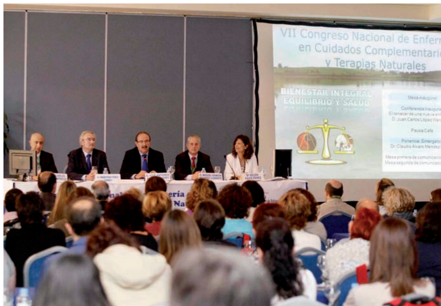
El Congreso coincidió con el XX aniversario de ADEATA

Desde la organización se ha destacado con satisfacción tras su celebración el haber constatado la existencia de un gran interés entre la profesión enfermera por estas materias, por lo que se hace necesario "seguir en esta andadura actualizándonos en técnicas y conocimientos sin olvidarnos de los deberes morales y actuaciones deontológicas acordes a las realidades sociales del momento. Cada vez más la demanda de la sociedad por los cuidados o terapias naturales es mayor y debemos prestarlos con un máximo de calidad, no olvidando que