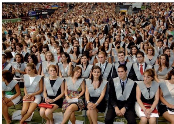
Graduación de Enfermería de la UCV