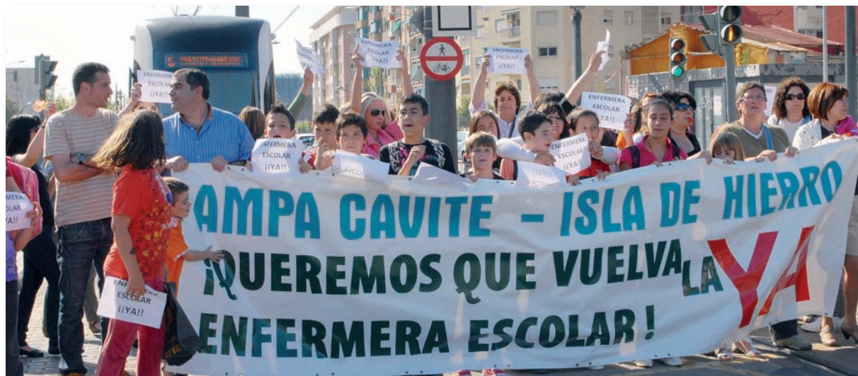
Imagen del primer corte de las vías del tranvía

El Colegio Cavite-Isla de Hierro de Valencia organizó una serie de movilizaciones, sin éxito alguno, para exigir a la Conselleria de Educación el retorno de la Enfermera Escolar expulsada del centro escolar el pasado día 15 de febrero. El CECOVA y la Sociedad Científica Española de Enfermería Escolar (SCE3) mostraron su apoyo a las reivindicaciones de la Asociación de Madres y Padres de Alumnos (AMPA) y reclamaron a la administración educativa que “permita que existan servicios de Enfermería Escolar en centros ordinarios públicos donde los padres quieran costearlos al igual que pasa en centros privados-concertados”.