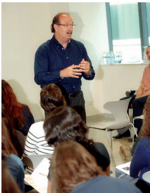
El presidente del CECOVA, en La Fe de Valencia

En el caso de la UCH-CEU, los estudiantes de tercer curso de Enfermería participaron en las Jornadas de Salidas Profesionales organizadas en el campus de Montca-