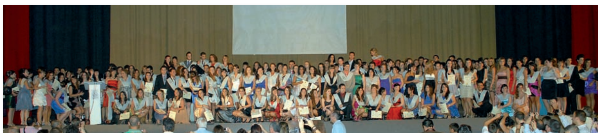
Graduación XXXII promoción EUIP de la UV