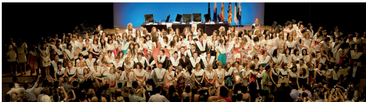
Graduación XXXI promoción de la UA