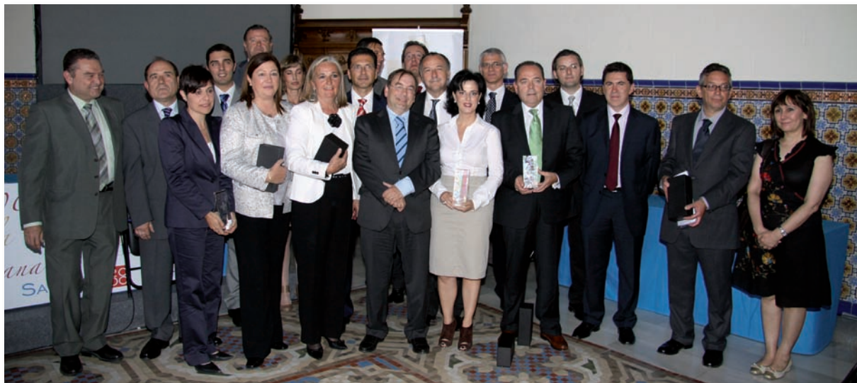
Foto de grupo de los premiados