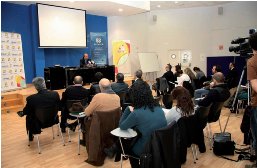
Acto de celebración del primer aniversario

CECOVA Televisión ha cumplido el primer aniversario de su puesta en funcionamiento como una iniciativa comunicativa, de carácter pionero en toda España, concebida para ofrecer información profesional al colectivo de Enfermería y para mejorar la imagen social de la profesión enfermera.