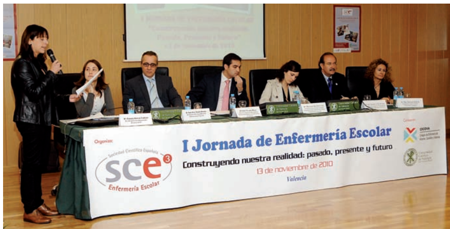
Imagen de la apertura de la Jornada de Enfermería Escolar

La Universidad Católica de Valencia San Vicente Mártir (UCV) acogió la primera Jornada de Enfermería Escolar organizada por la Sociedad Científica Española de Enfermería Escolar (SCE3) "con el fin de fomentar la actividad investigadora y el progreso científico en esta especialidad como condicionante de su mayor desarrollo e implantación".