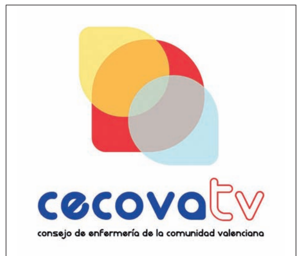
Nueva imagen de CECOVA Televisión

modo, CECOVA.TV y sus contenidos informativos de alta calidad se consolidan como todo un referente para la profesión enfermera, tanto en la Comunidad Valenciana como en el resto de España y otros países de habla hispana.