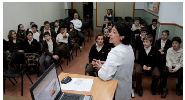
Una Enfermera Escolar en una intervención en un colegio

centenar de inscritos procedentes de las tres provincias de la Comunidad Valenciana.