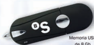
Memoria USB de 8 Gb

Ahora, además, solo por hacerse cliente, conseguirá un práctico regalo .