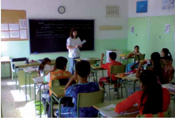
Una Enfermera Escolar imparte una clase de promoción de la salud

El CECOVA y los colegios de Enfermería de Valencia, Castellón y Alicante apoyaron la petición de la Federación Provincial de Padres de Alumnos (FAPA) Gabriel Miró de Alicante de contar con personal de apoyo en los colegios de Infantil para facilitar atención higiénica para los niños de tres años y aseguraron que “la dotación de enfermeras