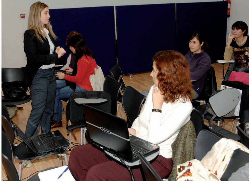
Imagen del taller impartido en Valencia

El curso preparado por Aula Salud, la empresa que gestiona el campus virtual del CECOVA www.formacion-cecova.es , constaba de una parte introductoria sobre el panorama actual de la web 2.0, una primera parte dedicada a los avances en la realización de presentaciones y una tercera parte dedicada íntegramente al trabajo colaborativo. Los participantes acudieron con sus propios ordenadores portátiles para trabajar conjuntamente en grupos de 2 ó 3 personas.