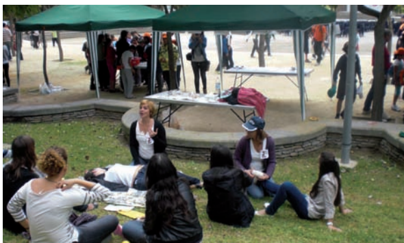
Dos de las enfermeras durante el taller

La Concejalía de Educación de Alicante y el Centro de Recursos Educativos han celebrado el XXV aniversario de la Guía de Actividades para Centros Educativos de Primaria y Secundaria Obligatoria en el Parque Lo Morant de esta ciudad. Diferentes agentes sociales ofrecieron talleres dinámicos dirigidos a alumnos de que acudieron de los centros educativos de Alicante.