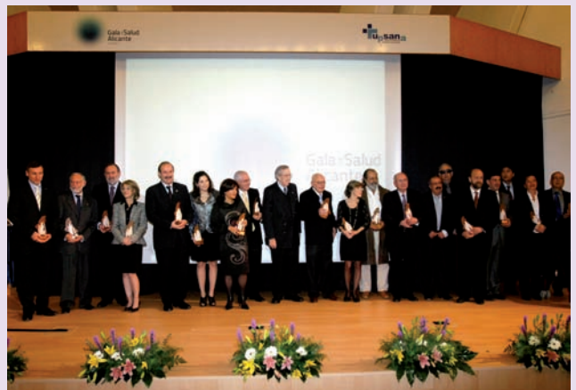
Foto de familia de los premiados