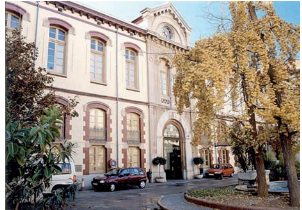
Fachada del Consorcio Hospitalario Provincial de Castellón

El presidente del CECOVA recordó la situación "anómala" de las diferentes promociones de especialistas en Enfermería de Salud Mental que "no pueden acceder a puestos de trabajo especializadas en la administración