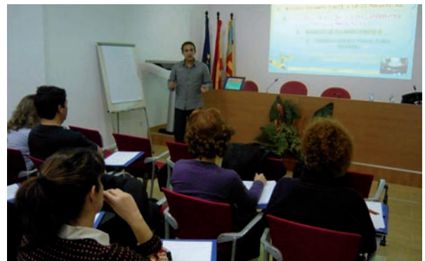
Los alumnos en una de las clases presenciales

Esta actividad formativa, que empezó en el mes de diciembre y se desarrollará hasta el mes de marzo de 2011, contempla la posibilidad de ampliar su duración dependiendo de las fechas que finalmente se fijen para la realización de los exámenes. La misma consta de 6 horas presenciales, siguiéndose el resto de manera individual a través de una plataforma online. En la plataforma online los alumnos disponen de un espacio virtual individual en