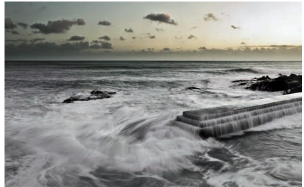
Inauguración de la exposición de Alicante (arriba) y Fotografía de Alex Asensi (abajo)