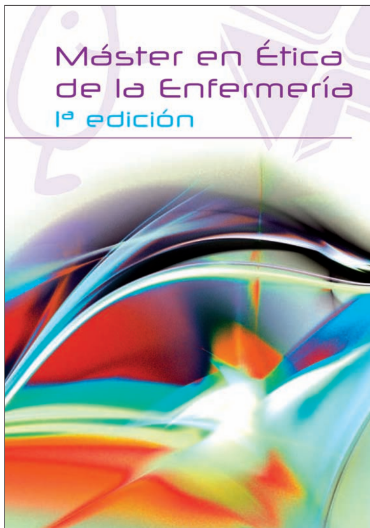
Portada del folleto informativo del Máster

La Universitat de València (UV), la Fundació Universidad-Empresa de Valencia y el CECOVA han suscrito un convenio de colaboración para el desarrollo de la primera edición del Máster de Ética de la Enfermería, que organizan conjuntamente las tres instituciones con el objetivo de formar a las enfermeras de la Comunidad Valenciana en los aspectos éticos de la profesión enfermera.