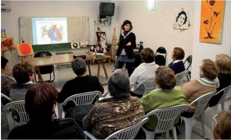
Charla sobre prevención de enfermedades cardiovasculares en Turís

La Dirección General de Salud Pública de la Conselleria de Sanidad y el CECOVA, en colaboración con la Asociación de Amas de Casa Tyrius, el Consejo Valenciano de Personas Mayores y la Unión Democrática de Pensionistas de España, han iniciado una campaña de promoción de la salud dirigida especialmente al colectivo de la tercera edad con el objetivo de mejorar la prevención de enfermedades cardiovasculares o de la osteoporosis, incentivar la alimentación saludable, prevenir el tabaquismo y fomentar el ejercicio físico, entre otros.