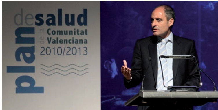
El presidente Camps, durante la presentación del III Plan de Salud

El presidente de la Generalitat, Francisco Camps, realizó una llamada a la ciudadanía para que “todos seamos conscientes de que debemos ser eficaces, eficientes y responsables” en el uso del sistema sanitario con el objetivo de asegurar que “tenga sostenibilidad financiera en el futuro”. Para ello, reclamó “ser eficientes en el uso racional del medicamento y en el uso de la oferta de salud”.