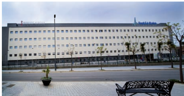
Fachada del Hospital de Manises