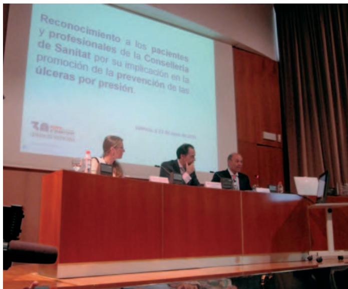
Acto de reconocimiento presidido por el conseller de Sanidad

EL ACTO DE ENTREGA sirvió de reconocimiento a profesionales sanitarios y pacientes por su implicación en la labor de prevención de las UPP