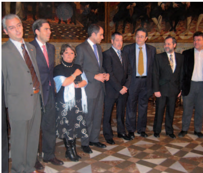
Firmantes en 2006 del documento que regula la Carrera Profesional