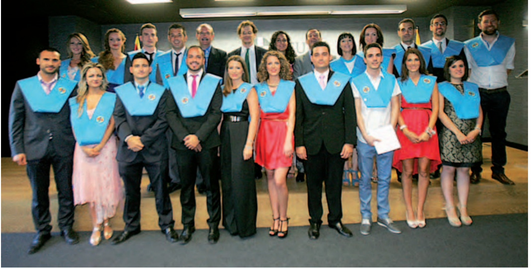
Acto de graduación de la V promoción del Máster en Cuidados de Enfermería