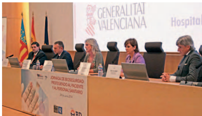
Mesa inaugural de la Jornada de Bioseguridad celebrada en La Fe de Valencia