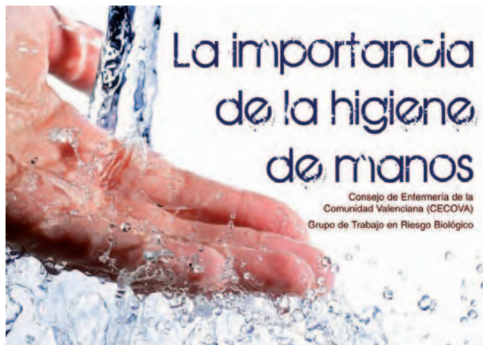
Cartel del CECOVA con motivo del Día Mundial de la Higiene de Manos

MEDIANTE CAMPAÑAS DE DIFUSIÓN del trabajo de las enfermeras aprovechando los Días Mundiales sanitarios