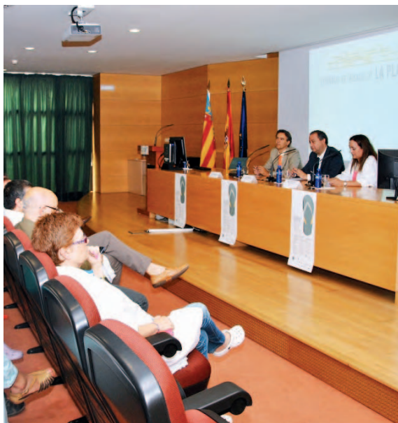
Mesa presidencial durante el acto de inauguración del curso