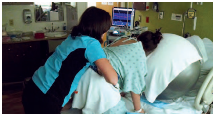
Las doulas realizan una labor de acompañamiento en el parto

LA ORGANIZACIÓN COLEGIAL DE ENFERMERÍA remite una carta al Ministerio de Sanidad, Servicios Sociales e Igualdad para que adopte medidas