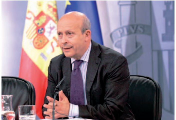
El ministro de Educación, Cultura y Deporte, José Ignacio Wert

Para el ministro de Educación, la propuesta es "optativa, selectiva,