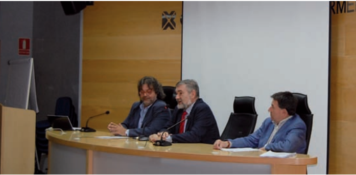
Imagen del acto inaugural del curso