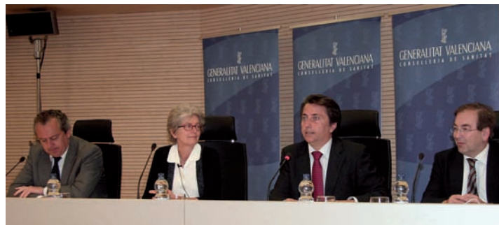
Imagen de la presentación del protocolo

Una vez se ha realizado esta detección, se trata de elaborar unas pautas que permitan guiar las actividades de intervención sanitaria a seguir. Otro de los objetivos fundamentales es facilitar una serie de instrumentos que permitan registrar los casos de violencia y las intervencio-