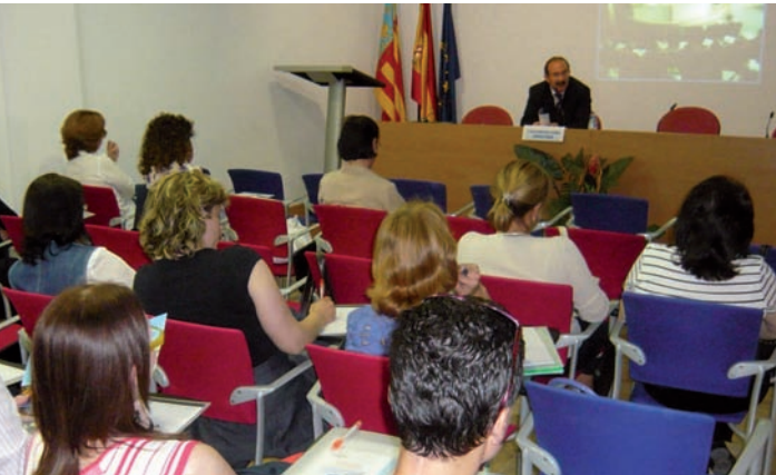
El presidente del CECOVA interviene por videoconferencia desde Alicante en el acto inaugural

La vacunación contra el virus del papiloma humano (VPH), los eventos adversos postvacunales y la actualidad de la situación gripal en el mundo fueron algunos de los aspectos abordados en la octava edición de la Reunión Enfermería y Vacunas/Curso de Actualización y Formación Continuada en Vacunaciones organizada por el Grupo de Trabajo en Vacunaciones del CECOVA con la colaboración de la Dirección General de Salud Pública de la Conselleria de Sanidad y los colegios de Enfermería de Valencia, Castellón y Alicante.