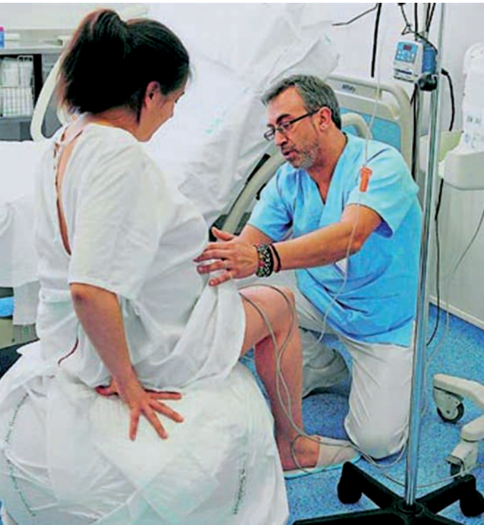
Un enfermero especialista en Obstetricia-Ginecología (Matrona) atiende a una parturienta

El Ministerio de Sanidad y Política Social ha publicado en el Boletín Oficial del Estado (BOE) las órdenes ministeriales de aprobación de los programas formativos de Enfermería del Trabajo y Enfermería Obstétrica Ginecológica (Matrona), dos de las siete especialidades de Enfermería aprobadas por Real Decreto en 2005. Para poder acceder a ellas será necesario estar en posesión del título de Diplomado o Graduado en Enfermería y la duración del periodo formativo de ambas serán de dos años en los que los futuros especialistas adquirirán, en su respectiva unidad docente acreditada, las competencias establecidas en dicho programa.