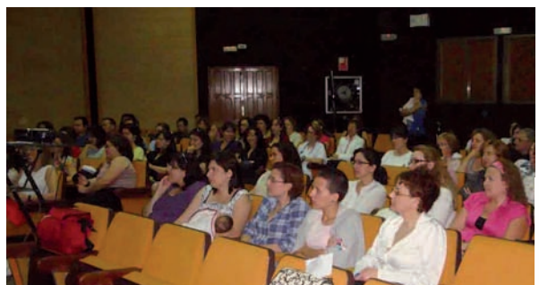
La conferencia congregó a un importante número de asistentes

indicó que el mejor sitio para un bebé durante el primer año de vida es el regazo de su madre, como se hace en muchas culturas como las bosquimanas, esquimales, hindúes, etc.