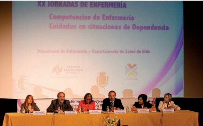
Los integrantes de la mesa inaugural de las Jornadas, en la imagen

El Teatro Castelar de Elda ha acogido las XX Jornadas de Enfermería del Departamento de Salud de Elda, celebradas bajo el lema de Competencias de Enfermería. Cuidados en situaciones de dependencia , en las que participaron alrededor de 100 profesionales y en las que se abordaron las competencias y los cuidados de Enfermería en situaciones de dependencia. Debido al incremento de personas dependientes en los últimos años y al tipo de cuidados que requiere este colectivo, la vigésima edición de las Jornadas de Enfermería del Departamento de Elda se