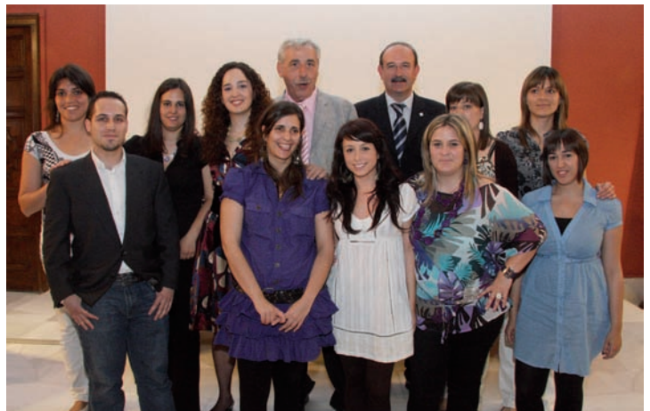
Imagen de los integrantes de la nueva promoción