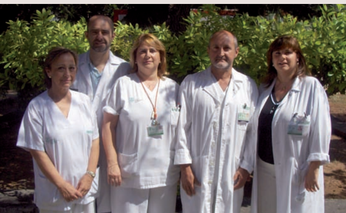
Foto de familia de los galardonados con el premio CECOVA

La Asociación Española de Enfermería Especialistas en Análisis Clínicos celebró el XXVIII Congreso Nacional en Peñíscola (Castellón) bajo el lema Preanalítica, función de Enfermería con una importante presencia de enfermeras de la Comunidad Valenciana. El evento, reconocido de Interés Profesional por el Consejo de Enfermería de la Comunidad Valenciana (CECOVA), reunió a una amplia representación del medio millar de miembros de la entidad.