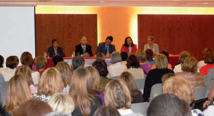
Inauguración del congreso