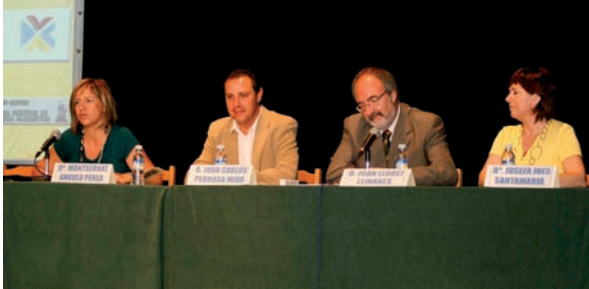
Imagen de los integrantes de la mesa de inauguración de las jornadas en Villena (arriba) y Valencia (abajo)