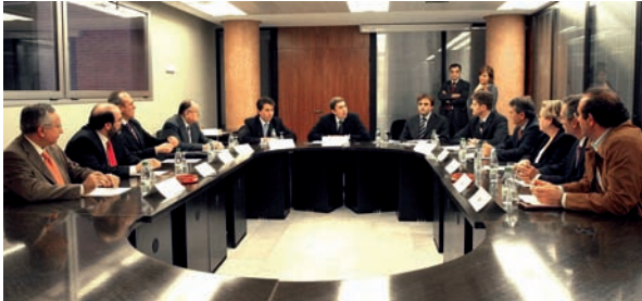
Sesión constitutiva del CABCV con el presidente del CECOVA entre los vocales

El Consejo Asesor de Bioética de la Comunidad Valenciana (CABCV) acaba de abrir su portal en Internet ( http://www.san.gva.es/cas/prof/bioetica/homebioetica.html ) a través del portal de la Conselleria de Sanidad. Esta página web pretende ser otro instrumento más para el mejor conocimiento de la bioética asistencial en la Comunidad Valenciana. Promovida por el CABCV e impulsada y sostenida por la Conselleria de Sanidad, el espacio en Internet estará al servicio de los pacientes y como herramienta de conocimiento y de trabajo de los profesionales de la salud que desarrollan su actividad en el sistema sanitario público valenciano, irá incorporando cuantas cuestiones puedan ser de interés en este campo.