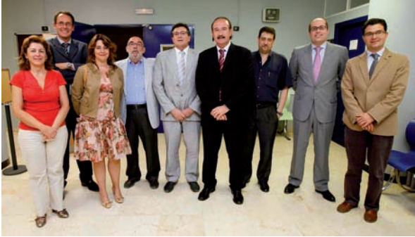
Imagen de organizadores y ponentes de la Jornada

La localidad alicantina de Elda ha acogido la celebración de una Jornada de Responsabilidad Jurídica para Enfermería , actividad organizada por el CECOVA, el Colegio de Enfermería de esta provincia y la Dirección de Enfermería del Departamento de Elda, que colaboró de forma activa para que esta actividad se llevase a cabo.