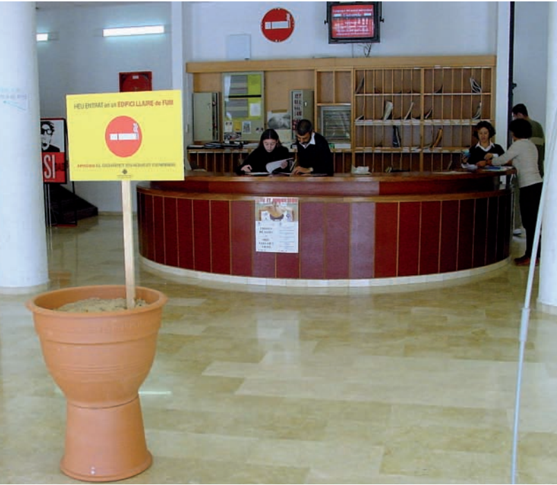
Cartel contra el consumo de tabaco a la entrada de un edificio público

El Consejo de Enfermería de la Comunidad Valenciana, aprovechando la celebración de los días mundiales Sin Tabaco, Nacional del Celíaco y de la Seguridad y la Salud Laboral realizó una serie de reivindicaciones con respecto a Enfermería.