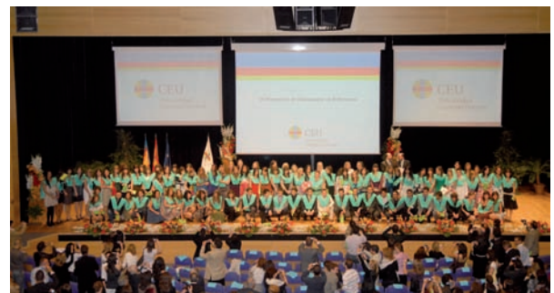
Las nuevas enfermeras de la sexta promoción de Enfermería de la Universidad Cardenal Herrera-CEU