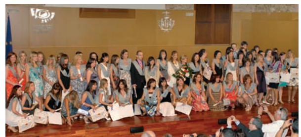
Foto de familia de la trigésima promoción de Enfermería de La Fe

Con los actos de graduación, un total de 371 estudiantes de cuatro escuelas de Enfermería de Alicante, Elche y Valencia se incorporan al mercado laboral