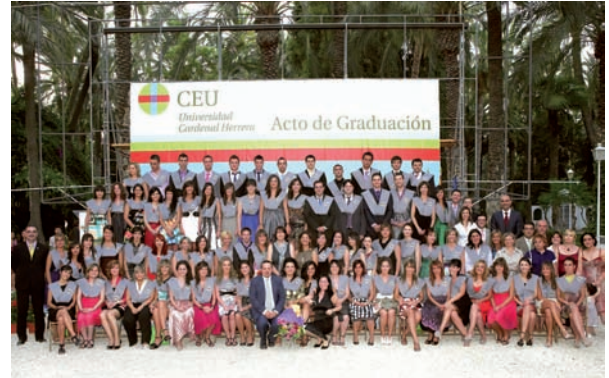
Imagen de la cuarta promoción de la UCH-CEU en Elche

Por su parte, en la provincia de Alicante, en el acto de clausura de la XXIX promoción de diplomados en Enfermería por la Universidad de Alicante (UA), un total de 161 estudiantes de tercero de Enfermería participaron en el acto de imposición de las tradicionales becas, además de recibir sus correspondientes diplomas de graduación.