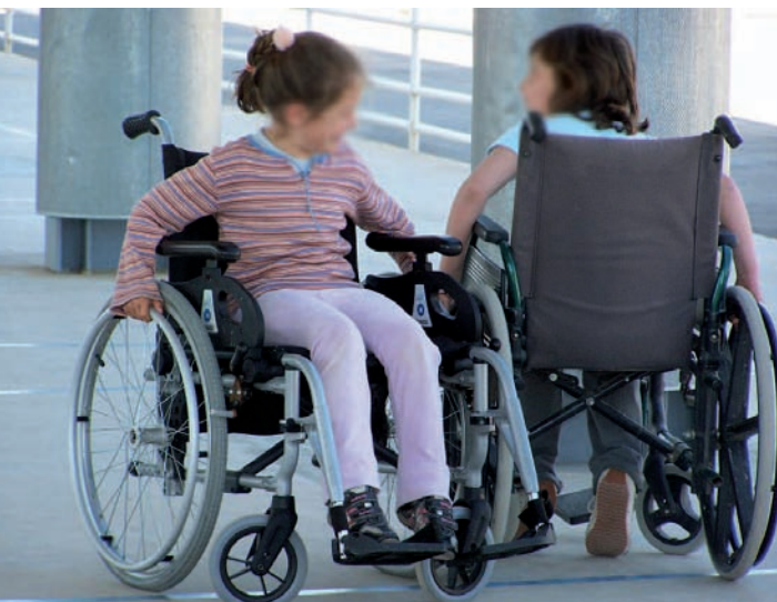
Imagen del circuito realizado en silla de ruedas

El Colegio de Educación Infantil y Primaria "María Francisca Ruiz Miquel" de Villajoyosa en Alicante, cono-