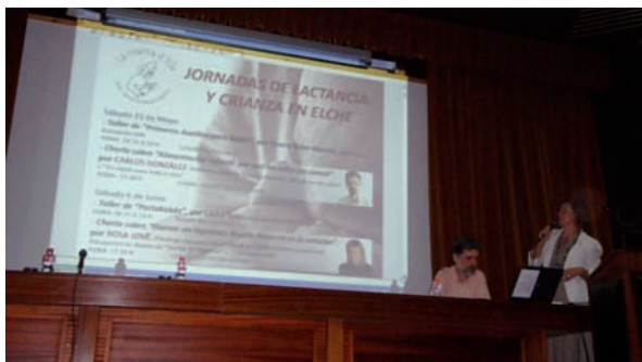
Imagen de una de las intervenciones de la jornada

El salón de actos del Hospital General Universitario de Elche ha acogido la celebración de una conferencia para profesionales sanitarios sobre lactancia materna organi-