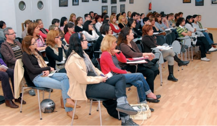
Asistentes al acto inaugural de la última edición del Máster de Enfermería Escolar en Valencia

Para inaugurar el próximo año académico 2009/2010, el aula virtual del CECOVA ofertará una nueva edición del Máster en Enfermería Escolar y la segunda edición del Máster en Educación en Diabetes, organizados en colaboración con el Instituto de Formación Continuada (IL3) de la Universitat de Barcelona (UB). El periodo de preinscripciones previo a la matrícula se mantendrá abierto durante todo el mes de septiembre con la finalidad de que el alumno pueda solicitar si le interesa la financiación del importe total del curso a 12 meses sin intereses a través del Banco Sabadell Atlántico. Uno de los nuevos másteres llevará como título Formación y Comunicación en Ciencias de la Salud. El planteamiento en este máster es contribuir al entrenamiento de los profesionales de la salud en aquellas habilidades que demanda el mercado de trabajo y que habitualmente no están contempladas de forma sistemática en los planes de estudio.