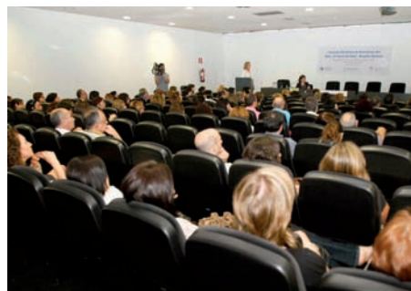
Imagen de los asistentes a esta I Jornada Científica de Enfermería del Departamento de Salud de Elche

Elche ha acogido la I Jornada Científica de Enfermería del Departamento de Salud de Elche-Hospital General, actividad desarrollada bajo el lema La calidad en los cuidados, nuestro reto . El CECOVA colaboró con la organización de esta jornada, que contó con 150 participantes tanto profesionales como estudiantes de Enfermería, y cuyo objetivo fue divulgar la producción científica del personal del Enfermería del departamento con el objetivo de mejorar los cuidados que se prestan a los enfermos.