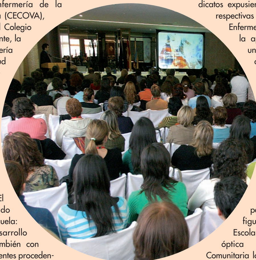
Medio millar de participantes asistieron a este evento

Tras la celebración de una actividad precongreso en la que representantes de diferentes partidos políticos y sin-