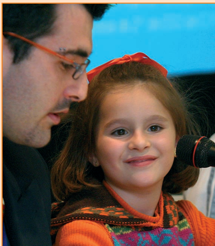
Los niños contaron su experiencia como parte de los programas de EpS

Aparte de para debatir y aportar experiencias y conocimientos en el ámbito de la Enfermería en Salud Escolar, este primer congreso nacional ha servido para reivindicar la figura de estos profesionales en los centros de enseñanza