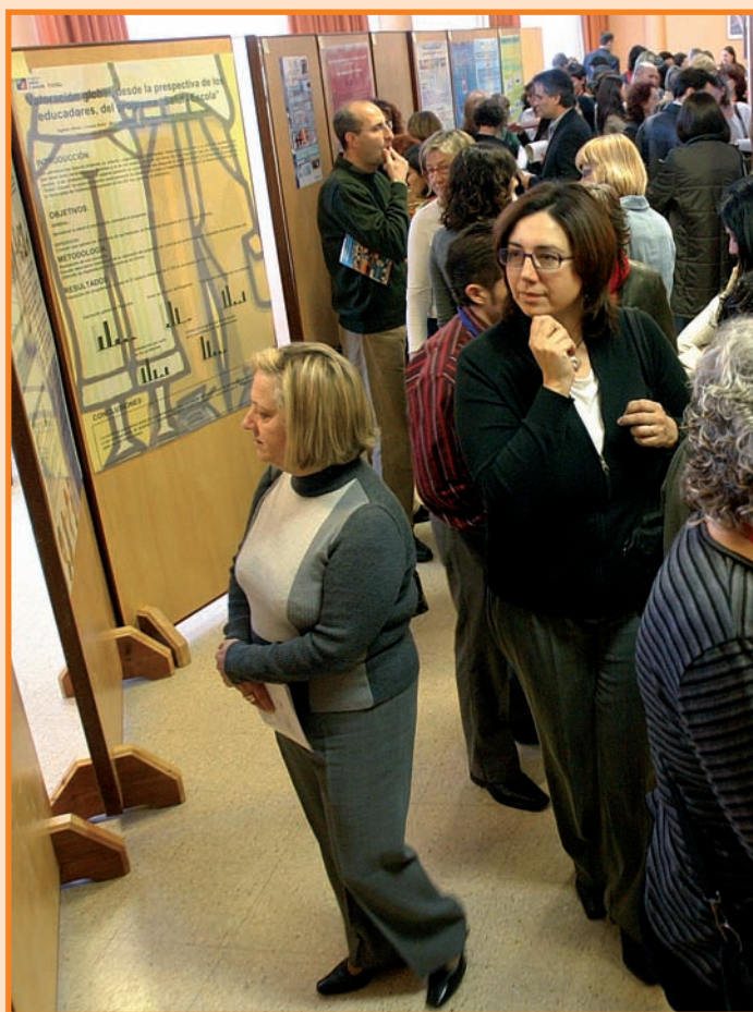
60 Posters fueron presentados al Congreso