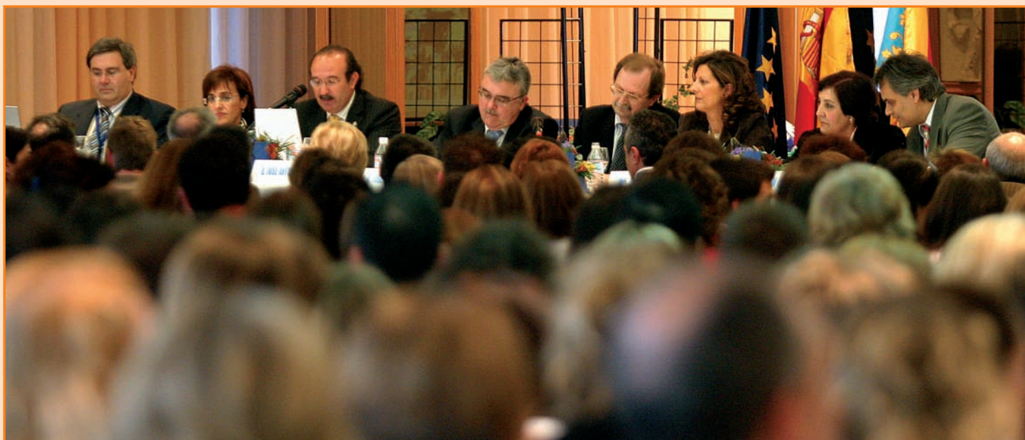
Imagen de la mesa presidencial en la inauguración del Congreso