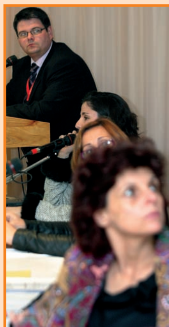
Los participantes en la primera de las mesas siguen una exposición a través de una pantalla