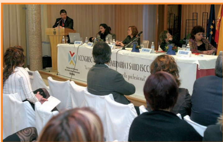
Imagen de la mesa con los ponentes de la misma