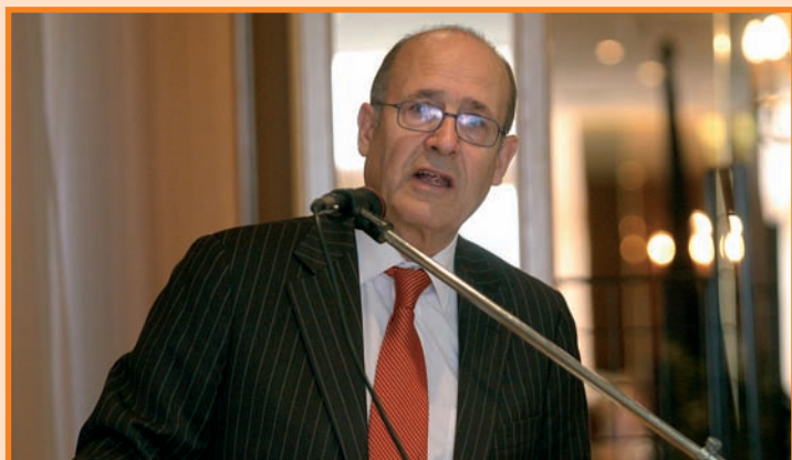
El rector de la Universidad Miguel Hernández alabó la iniciativa de la celebración del congreso