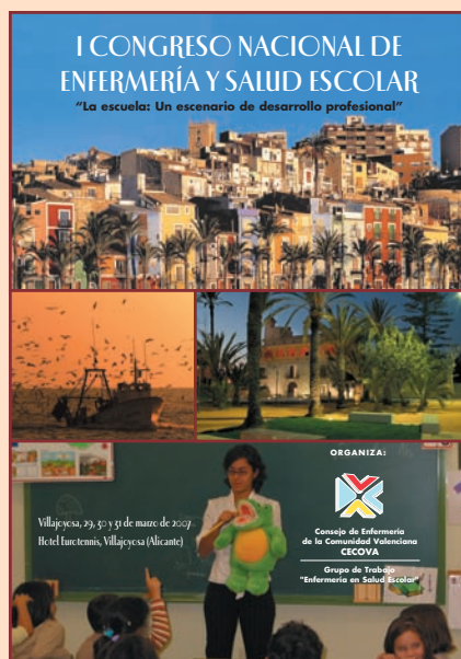
Cartel anunciador del congreso