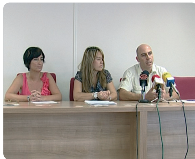
UN MOMENTO DE LA PRESENTACIÓN DE LA PÁGINA WEB.

la que el uso de las nuevas tecnologías está extendido, el grupo de Educación para la Salud consideran Internet como una herramienta idónea para llegar a los más jóvenes, debido al gran uso que los adolescentes hacen de la red. El programa del adolescente se puso en marcha hace 4 años, en el curso 2008-2009, y desde entonces unos 6.000 alumnos de ESO y Bachiller de las comarcas del Alto y Medio Vinalopó han participado en la formación que imparten profesionales de enfermería y técnicos de Salud Pública.