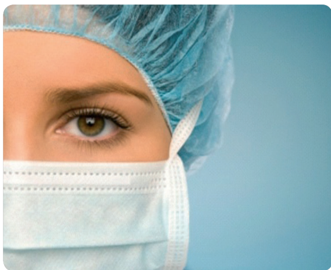
LA CAMPAÑA DE VACUNACIÓN ANTIGRIPIAL COMENZÓ EL 28 DE SEPTIEMBRE.

EL DESCENSO EN LA VACUNACIÓN HA PRODUCIDO UN REBROTE EN EUROPA DE ENFERMEDADES QUE SE CREÍAN ERRADICADAS COMO EL SARAMPIÓN