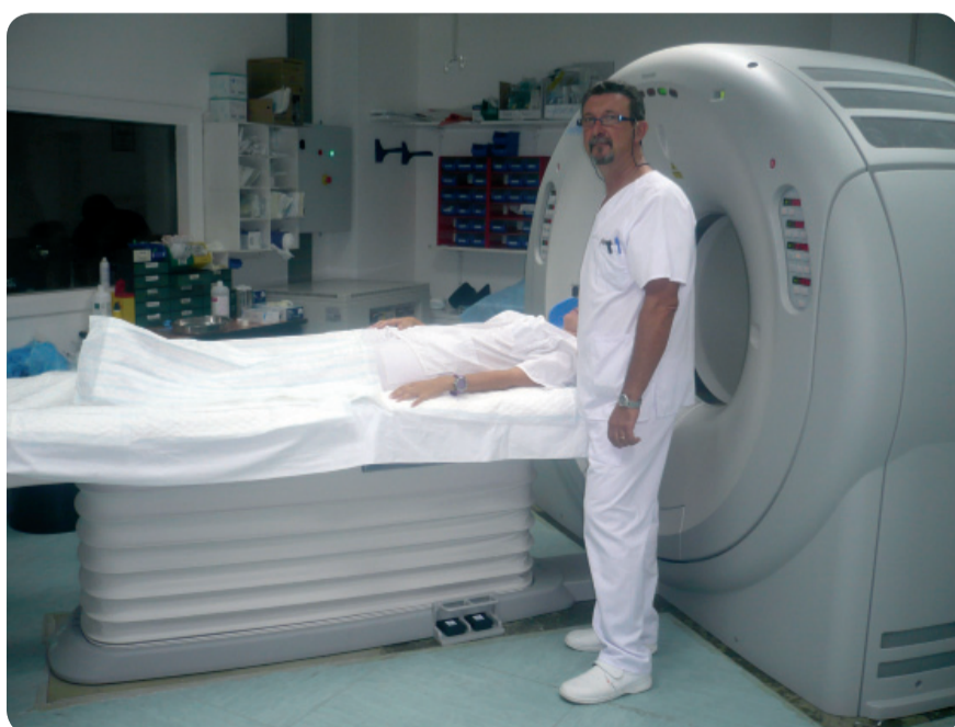
NUEVO TAC ADQUIRIDO POR EL HOSPITAL GENERAL DE ELCHE.

El 1 de enero de empezará a aplicarse la ampliación de la sanidad pública y gratuita a todas las personas paradas que han agotado la prestación por desempleo