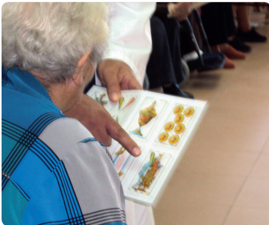
ANCIANOS DE LA RESIDENCIA SOLIMAR PRACTICAN DIVERSAS ACTIVIDADES

LA INVESTIGACIÓN ESTÁ BASADA EN QUE PERSONAS CON LA ENFERMEDAD REALICEN ACTIVIDADES SEMANALES CON PERROS ADIESTRADOS. LA UCV PROLONGARÁ ESTE PROYECTO A LO LARGO DEL PRÓXIMO CURSO