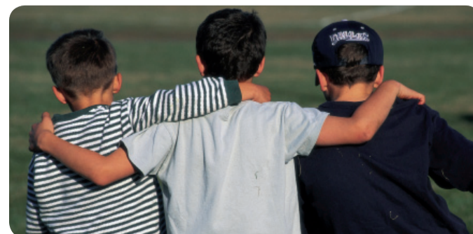
ENFERMERÍA ESCOLAR ADVIERTE DE LAS AFECCIONES GENERADAS POR EL SOBREPESO.

sencia de ejercicio físico". Con motivo del Día Mundial del Corazón, la SCE3 y el Consejo de Enfermería de la Comunitat Valenciana (CECOVA) han pedido a las administraciones públicas que refuercen las políticas de prevención y educación para la salud para frenar el incremento del número de víctimas mortales de las enfermedades cardiovasculares y han recordado la necesidad de evitar conductas sedentarias y la ingesta de grasas y azúcares.