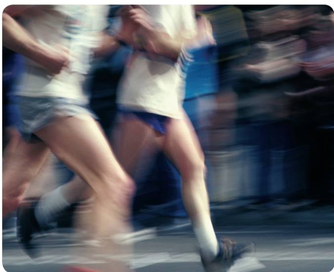
LA OSTEOPOROSIS PROVOCA UN DESCENSO DE MASA ÓSEA.

EL COLECTIVO DE ENFERMERÍA RECUERDA LA NECESIDAD DE LLEVAR UNA DIETA RICA EN ALIMENTOS QUE CONTENGAN CALCIO COMO LÁCTEOS Y DERIVADOS