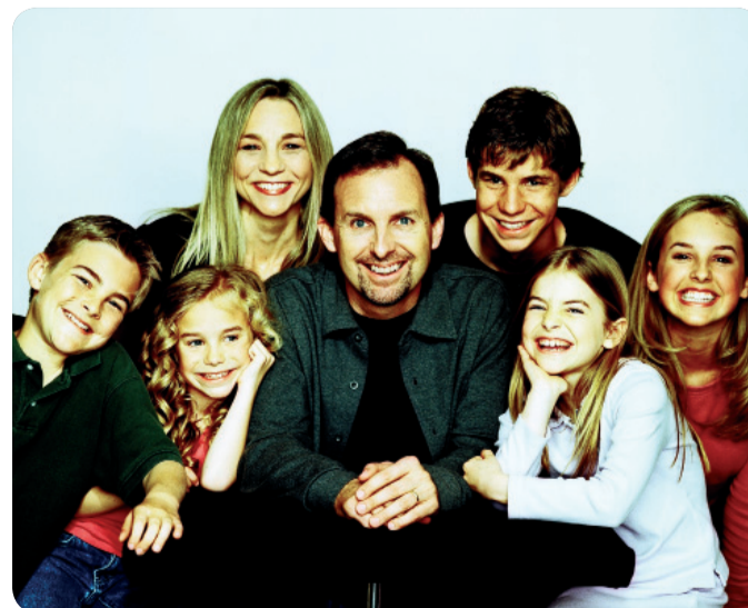
DURANTE EL PERIODO DE RISA SE EJERCITAN 400 MÚSCULOS.

Los investigadores comprobaron durante el estudio que tras ver una película divertida se produjo una vasodilatación beneficiosa y cardiosaludable. Una vez más se demuestra que, como dice el refrán "poner al mal tiempo buena cara", y sobre todo buen humor, ayuda a superar mejor cualquier problema.