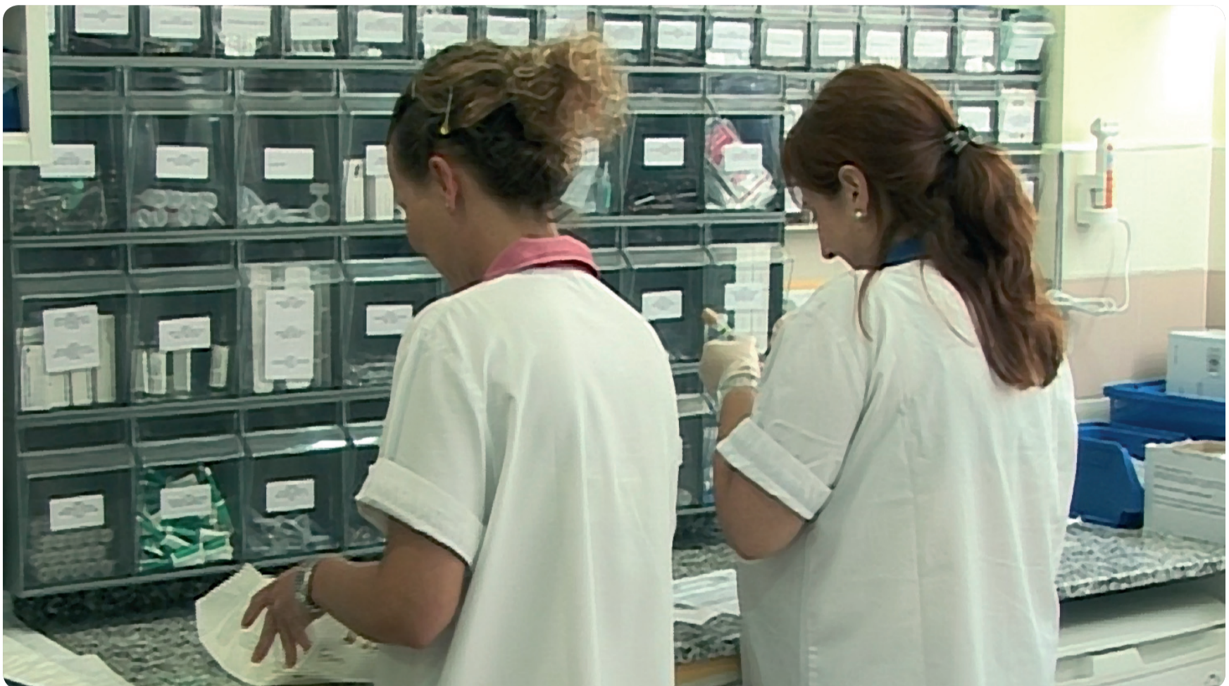
LOS PROFESIONALES SANITARIOS SON LOS PRINCIPALES GRUPOS DE RIESGO ANTE ENFERMEDADES COMO LA HEPATITIS, POR LO QUE ES NECESARIO UTILIZAR MATERIALES ADECUADOS.

Periódico de la Organización Colegial de Enfermería de la Comunidad Valenciana