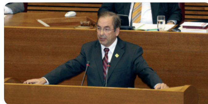
EL CONSELLER DE SANIDAD DURANTE SU INTERVENCIÓN EN LES CORTS.