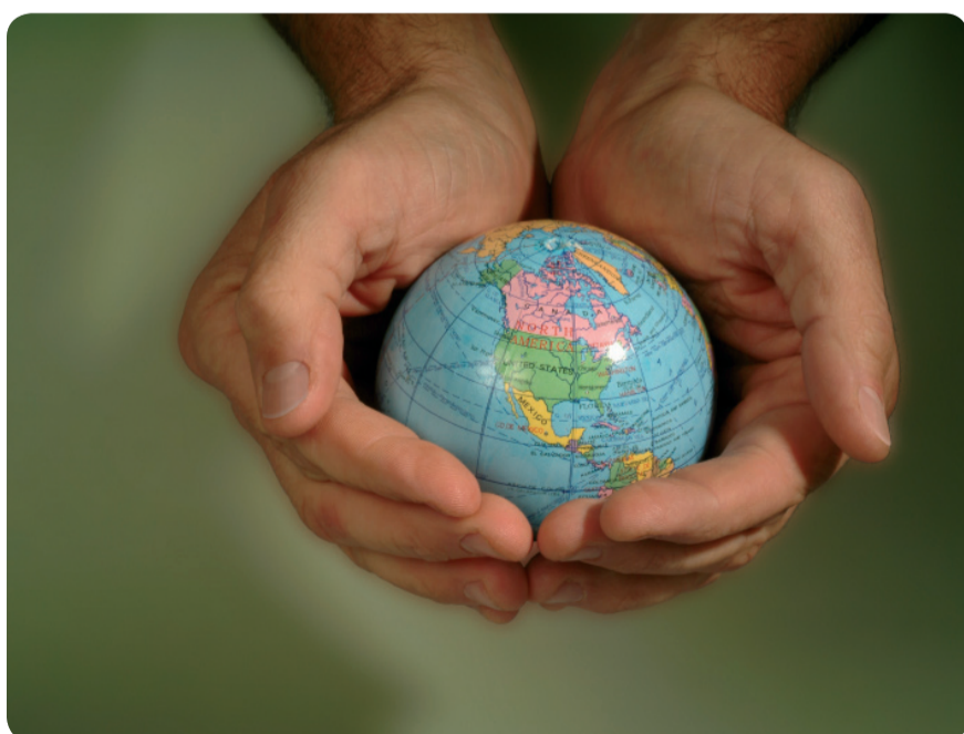
EN BULGARIA, ESTONIA, LETONIA Y LITUANIA SE HAN CONTABILIZADO CASOS DE TUBERCULOSIS.

Se calcula que solo el 34% de las personas afectadas por esta patología están diagnosticadas. En 2009 hubo en la zona europea 81.000 casos de la variante más peligrosa, lo que supone un 20% del total mundial.