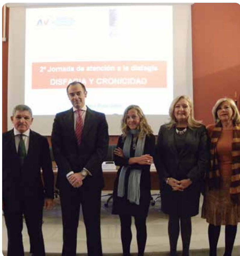
El conseller de Sanitat y los organizadores durante la inauguración de las Jornadas.

También se ha abordado la valoración y tratamiento de la disfagia en los domicilios y en los hospitales de agudos, donde la estancia del paciente es limitada o reducida, y se precisa de una valoración rápida.