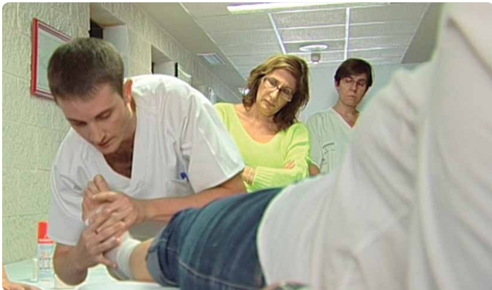
Cerca del 90% de los casos diagnosticados de úlceras por presión son prevenibles.

DIRIGIDO A USUARIOS DE LA SANIDAD DE LA COMUNIDAD VALENCIANA