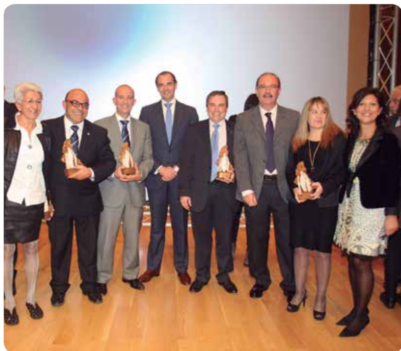
El conseller, en el centro, junto a los premiados, al presidente del CECOVA y a la presidenta del Colegio de Alicante.

LA IV GALA DE LA SALUD DE ALICANTE FUE ORGANIZADA POR LA UNIÓN DE LOS COLEGIOS PROFESIONALES DE LA PROVINCIA (UPSANA)