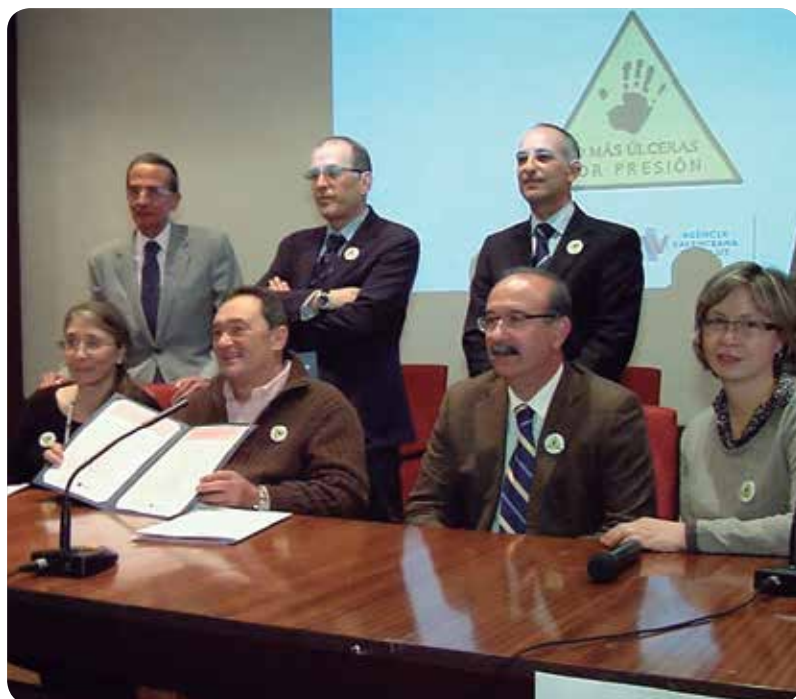
Algunos de los firmantes de la Declaración Valencia sobre Prevención de UPP.

LA APARICIÓN DE LAS ÚLCERAS POR PRESIÓN (UPP) ES PREVENIBLE EN UN 90% DE LOS CASOS, ASÍ SE DESTACÓ EN UNA JORNADA AUTONÓMICA