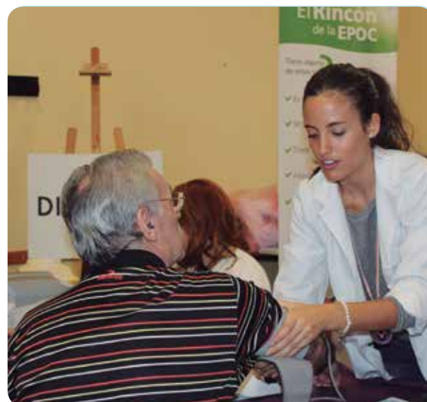
Enfermeras en el Centro Municipal de Personas Mayores "La Amistad".

Además, las enfermeras ofrecieron charlas sobre la vacunación de la gripe, conceptos básicos de la diabetes, Hipertensión, la EPOC y estilos de vida saludable (ejercicio y alimentación).