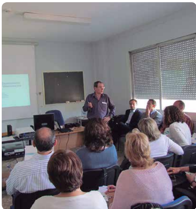
Los referentes enfermeros y médicos durante una de las primeras sesiones teóricas.

Por medio del cuestionario IEMAC DM2, los profesionales podrán conocer y valorar a los puntos fuertes en la gestión de los pacientes diabéticos de su organización, las áreas que se tienen que mejorar, orientar los planes de actuación y obtener una posición relativa ante organizaciones parecidas sobre la calidad de la atención a los pacientes crónicos.