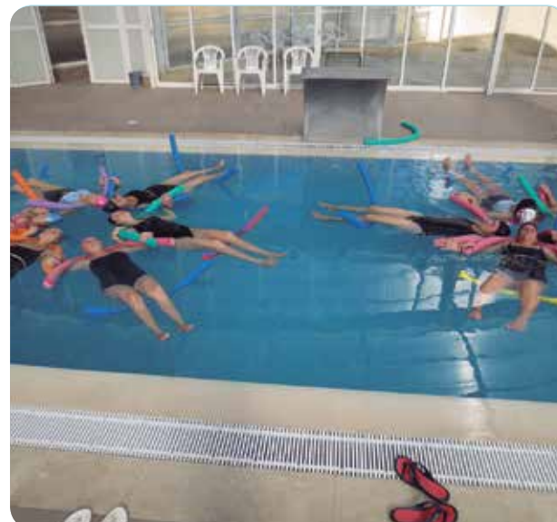
Mujeres gestantes durante una clase de matronatación.

Además de los beneficios de realizar ejercicio de manera habitual, las clases también permiten a las mujeres resolver dudas de su embarazo con la matrona y compartir experiencias y vivencias, con otras madres.