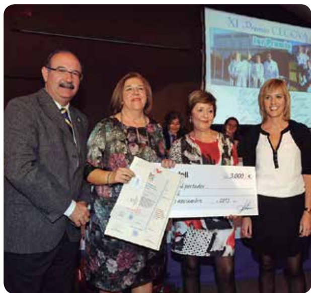
Momento de la entrega del primer premio CECOVA en investigación enfermera.

LA ENTREGA DE RECONOCIMIENTOS TUVO LUGAR DURANTE LA CELEBRACIÓN DEL DÍA DE LA ENFERMERÍA DE LA COMUNITAT VALENCIANA