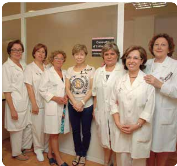
Miembros del equipo de la Consulta de Enfermería Radiológica.

LAS ENFERMERAS DETALLAN AL PACIENTE LAS PRUEBAS QUE SE LE REALIZARÁN APORTÁNDOLES MAYOR SEGURIDAD Y TRANQUILIDAD