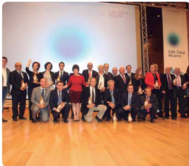
Foto de familia de todos los premiados en la IV Gala de la Salud.

El Auditorio de la Diputación de Alicante (ADDA) acogió la IV Gala de la Salud de la Provincia, un acto en donde los colegios profesionales del ámbito sanitario premiaron la excelencia de algunos compañeros de profesión. Este acto estuvo organizado por la Unión Profesional Sanitaria de Alicante (UPSANA), entidad que agrupa a nueve colegios profesionales relacionados con la sanidad que representan a más de 25.000 profesionales sanitarios que día a día velan por garantizar el bienestar de la población.