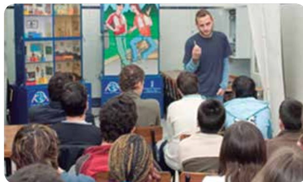
Más de 420.000 escolares visitan el Aula del Tabaco de Sanitat en 20 años.

Un conjunto de actividades cuyo resultado es esperanzador puesto que según la última encuesta de salud de la Comunitat Valenciana, el porcentaje de adultos que fuman diariamente ha descendido desde la primera encuesta realizada en 1991, de un 35,4% a un 24,8% en 2010 y ahora solo un 30% de los mayores de 16 años fuman, frente al más de 53% en 2005.