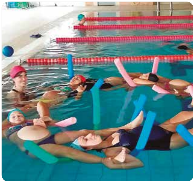
Las sesiones en Benicàssim tendrán lugar los jueves de 12 a 13 horas.

LAS MATRONAS REALIZAN LA PREPARACIÓN AL PARTO EN EL AGUA. SON MUCHOS LOS BENEFICIOS PARA LAS MUJERES EMBARAZADAS