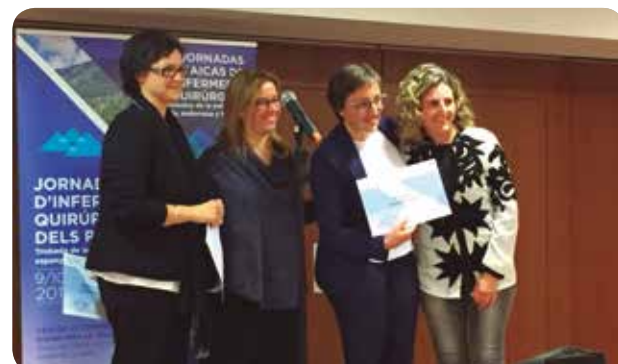
Durante el acto de recogida del premio en Andorra.

Las ponencias abordaron temas como la Seguridad del paciente en el proceso quirúrgico, el proceso perioperatorio, el proceso quirúrgico en accidentes en alta montaña, explantes y trasplantes o el uso de nuevas tecnologías al área quirúrgica. Todo esto desde una perspectiva europea, en la cual los tres países comparten aspectos innovadores y protocolos quirúrgicos, que aplicados en los respectivos hospitales, permiten obtener la excelencia sanitaria.