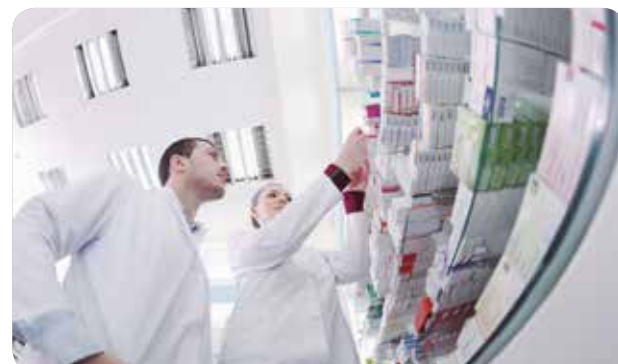
CECOVA considera que ciertos cometidos deberían realizarse desde Atención Primaria.

Los servicios jurídicos del CECOVA están trabajando para presentar alegaciones a este proyecto de decreto al considerar que la norma dará lugar a confusión e invasión de competencias al establecer a los profesionales farmacéuticos una atribuciones contrarias a la Ley de ordenación de las profesiones sanitarias (LOPS).