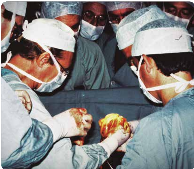
Imagen del primer trasplante de corazón realizado en el Hospital La Fe.

EL CLÍNICO CUMPLE 30 AÑOS DE SU PRIMERA INTERVENCIÓN DE MÉDULA ÓSEA Y ORIHUELA CELEBRA 20 AÑOS DE COORDINACIÓN DE TRASPLANTES