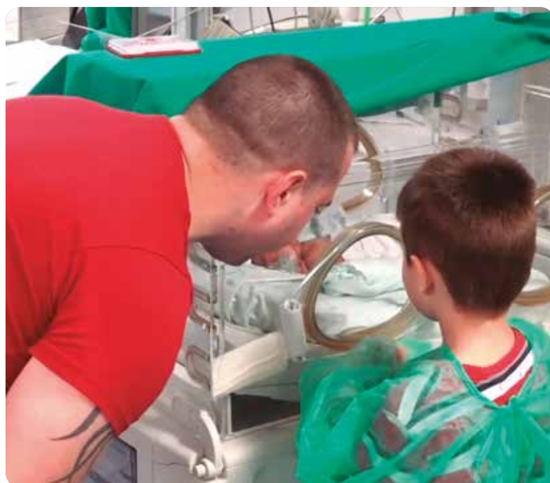
Una familia visita al recién nacido en la unidad de Neonatología.

Enfermeras de Neonatología del Hospital Universitari i Politècnic La Fe de Valencia ofrecen un taller para hermanas y hermanos de pacientes ingresados en Neonatología.