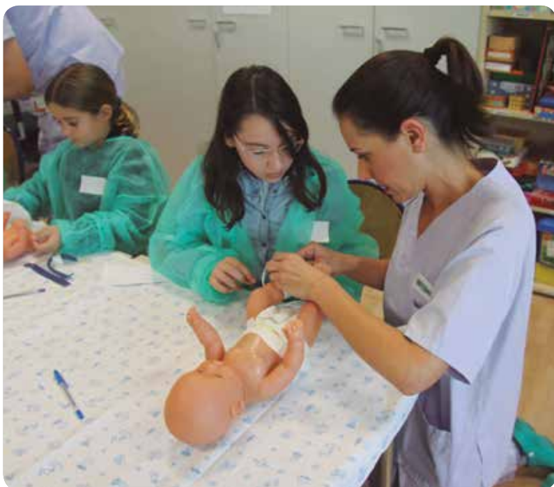
Los talleres, divididos en dos partes, se celebran los sábados.

ENFERMERAS DE NEONATOLOGÍA SON LAS ENCARGADAS DE IMPARTIR LA FORMACIÓN A LOS NIÑOS PARA QUE SEPAN COMO CUIDAR A SUS HERMANOS