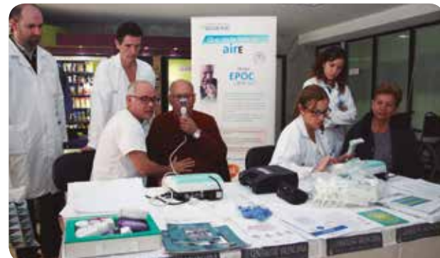
Se estima que el 10,2% de la población entre 40 y 80 años padece EPOC.

Se estima que el 10,2% de la población entre 40 y 80 años padece EPOC, la mayoría fumadores o exfumadores. Sin embargo, solo están diagnosticadas una de cada cuatro personas que sufren esta enfermedad y el infra-diagnóstico es aún mayor en las mujeres. Cabe recordar que la exposición al tabaco es la principal causa.