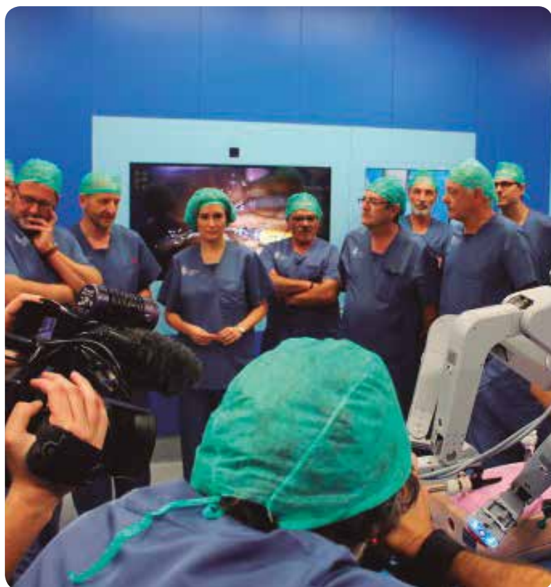
Durante la presentación del equipo de cirugía robótica Da Vinci en el HGUV.

Las ventajas que ofrece ese sistema robótico respecto a la cirugía abierta o la laparoscopia es que las incisiones son más pequeñas, con menor dolor postoperatorio, y se reduce el tiempo de hospitalización, así como las complicaciones o la necesidad de nuevas intervenciones y, para ciertos procedimientos de seguridad funcional de mejor recuperación, sobre todo en pacientes con cirugía oncológica.