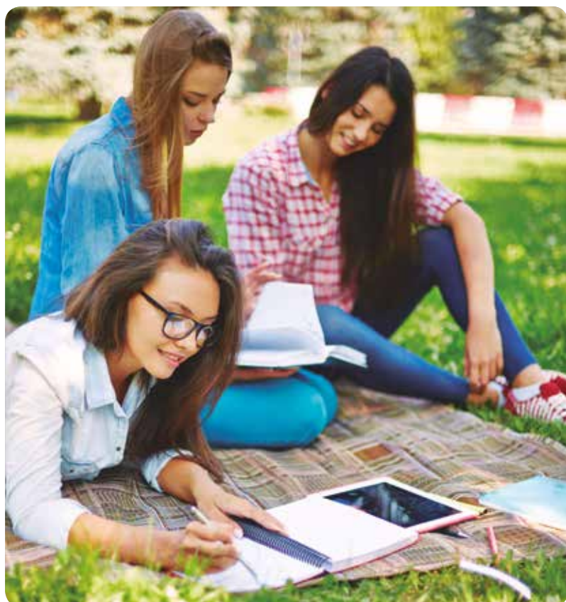
Los adolescentes son un grupo de riesgo en el contagio de esta infección.