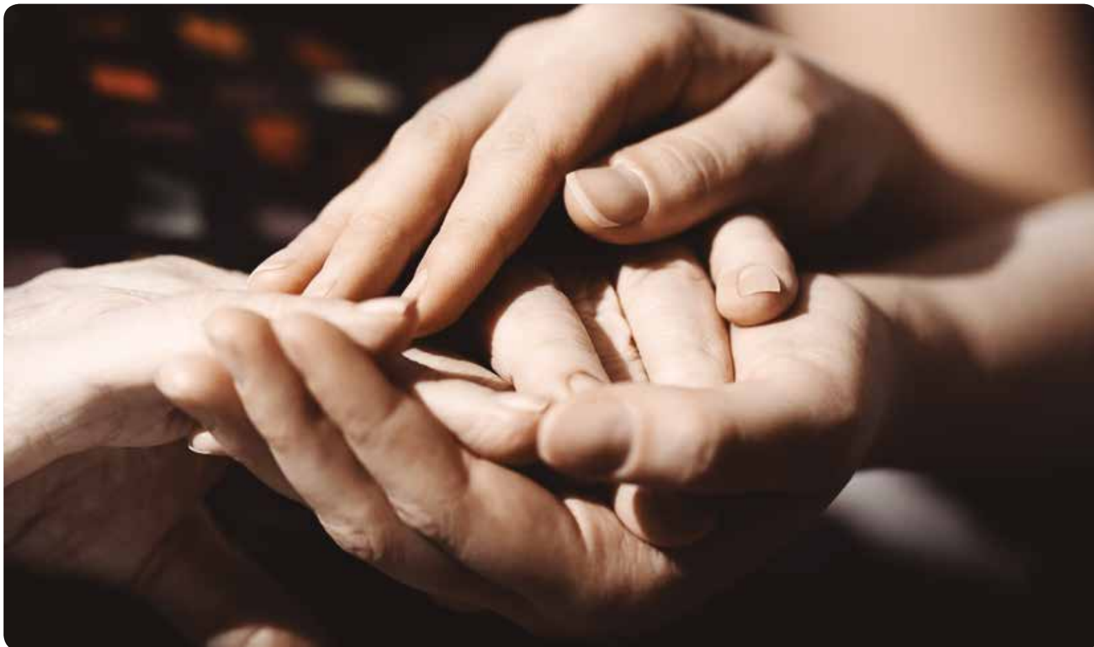
Gracias a la solidaridad de los donantes y sus familias muchas personas han tenido una segunda oportunidad.

DIRIGIDO A USUARIOS DE LA SANIDAD DE LA COMUNIDAD VALENCIANA