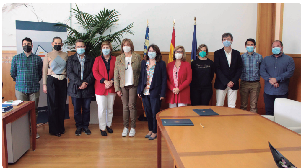
Representantes colegiales y universitarios, tras la firma del convenio