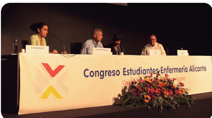
Imagen de la mesa sobre estudiantes y servicios de salud