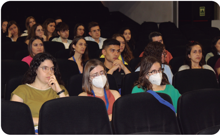
Estudiantes de Enfermería, durante una de las sesiones del Congreso