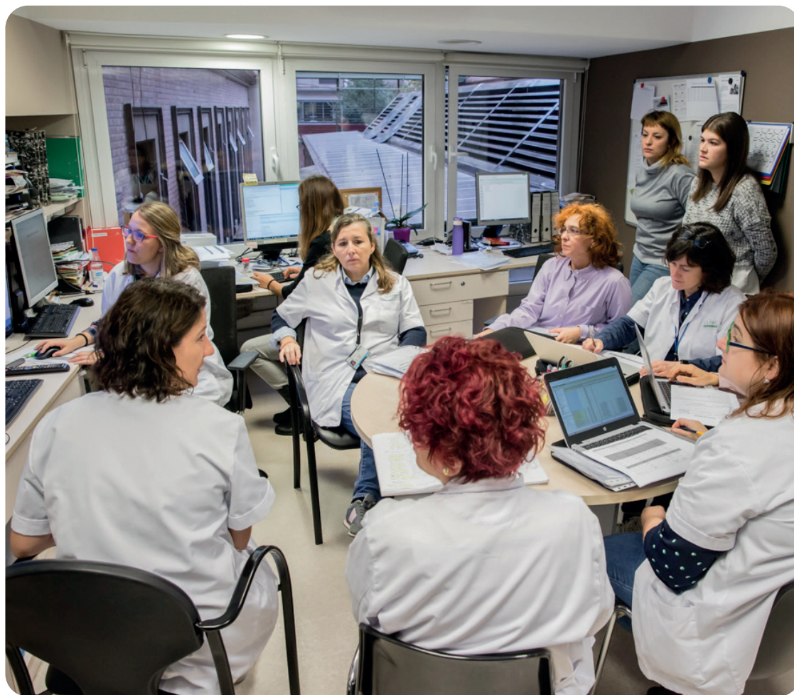
Fotos Banc Imatges Infermeres Autoria: Ariadna Creus y Àngel García

Esta medida se relajó el 15 de marzo de 2021 para permitir las prácticas en los centros hospitalarios de las/os alumnas/os que estuvieran estudiando del tercer curso en adelante de los diferentes grados universitarios de ciencias de la salud. La Conselleria de Sanidad dictó una resolución que incorporaba al alumnado del tercer curso a las excepciones que no se veían afectadas por la suspensión de las prácticas que se realizan en centros sanitarios ubicados en la Comunidad Valenciana.