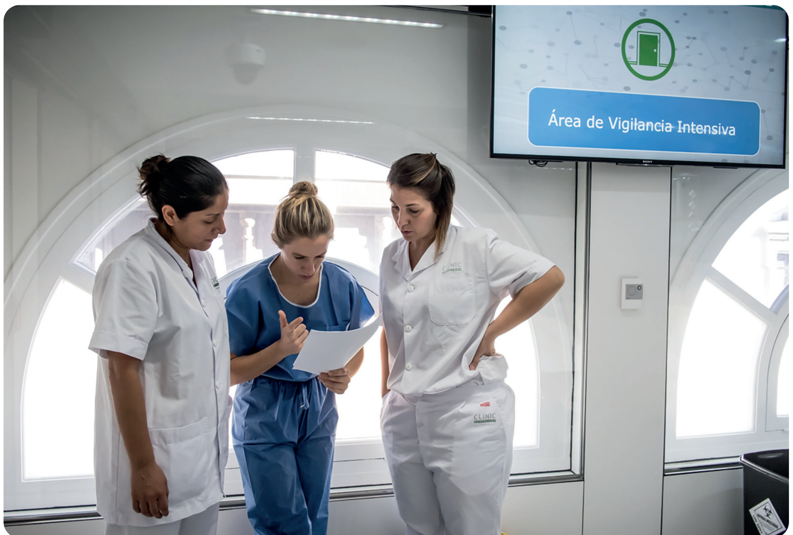
Fotos Banc Imatges Infermeres Autoría: Ariadna Creus y Ángel García

Su presidente, Juan José Tirado, pide la inmunidad del alumnado y que disponga de los equipos de protección adecuados a su nivel de exposición al contagio Covid-19, como el resto de los profesionales que atienden a los pacientes