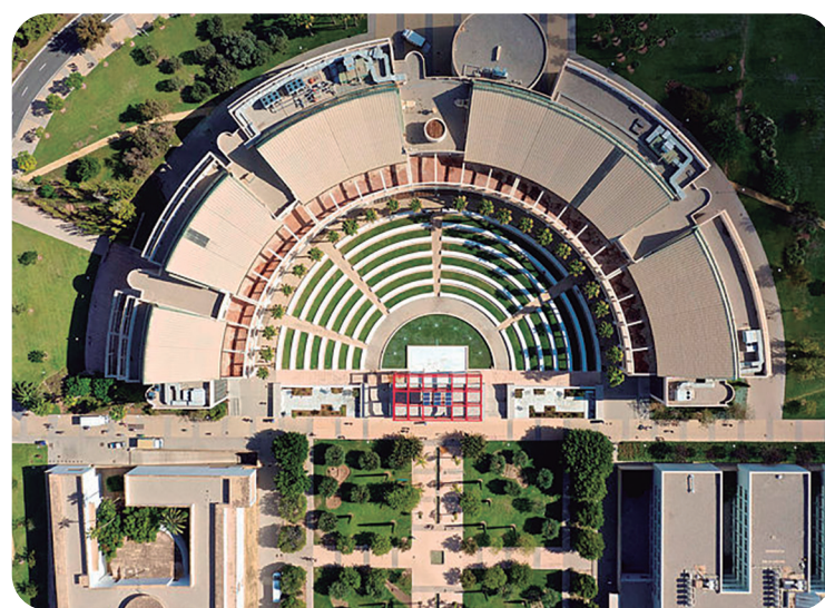
El acto tuvo lugar en la Universidad de Alicante

la vía del bien común para mejorar y garantizar el bienestar de los jóvenes y de toda la comunidad universitaria."