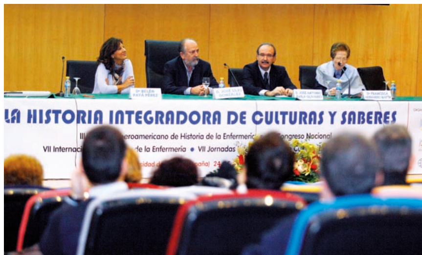
Imagen de la mesa de clausura

La Organización Colegial de Enfermería materializó su presencia también a través de la exposición de una comunicación sobre el Museo Histórico de Enfermería de la Fundación "José Llopis" y de la participación del