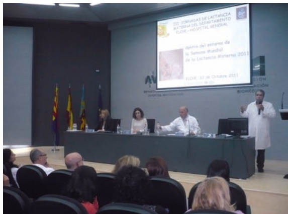
Aspecto de la mesa inaugural de la Jornada

La III Jornada de Lactancia Materna destinada a los profesionales sanitarios tuvo lugar en el Hospital General Universitario de Elche enmarcada dentro de la Iniciativa para la Humanización de la Asistencia al Nacimiento y la Lactancia (IHAN), un proyecto puesto en marcha por la Organización Mundial de la Salud y UNICEF para