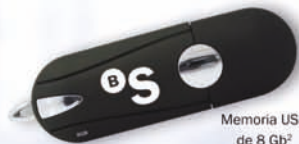
Memoria USB de 8 Gb 2

Ahora, además, solo por hacerse cliente, conseguirá un práctico regalo .