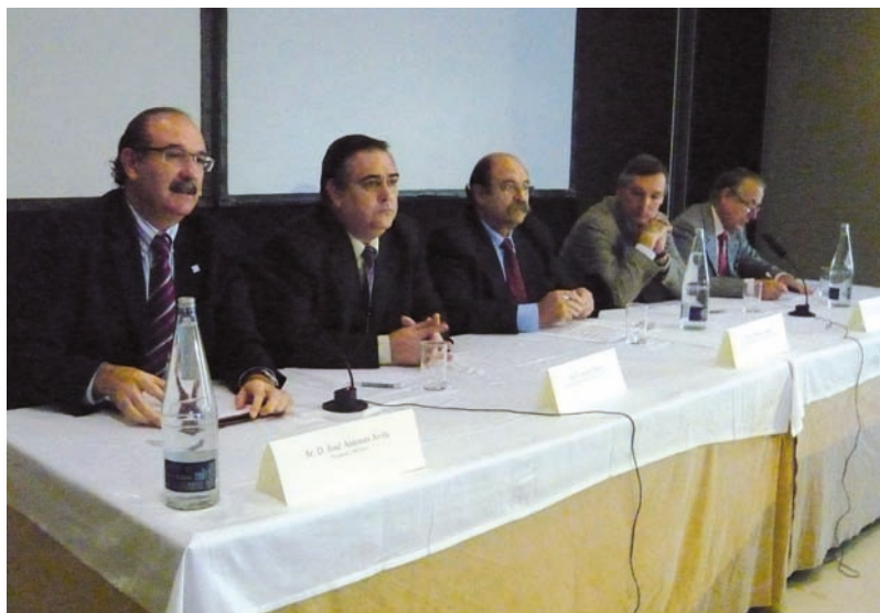
El presidente del CECOVA, izquierda, junto al resto de integrantes de la mesa inaugural

Un total de 15 proyectos, elaborados por los departamentos de Salud de Elche, Elda, General de Alicante, Sant Joan, La Fe, Doctor Peset, Arnau de Vilanova-Llíria, Requena y General de Valencia, que han repercutido en una mejora del control de la enfermedad crónica, fueron presentados durante la II Jornada de Innovación para la Gestión del Paciente con Enfermedades Crónicas en la Comunitat, celebrada en Alicante y coordinada por el Departamento de Salud Alicante - Sant Joan d'Alacant, en colaboración con la Fundación para el Fomento de la Investigación Sanitaria y Biomédica de la Comunitat Valenciana (FISABIO).