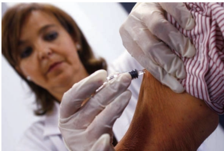
Una enfermera vacuna a un viajero

El curso se imparte durante cinco meses desde el pasado 23 de enero y está dirigido específicamente a profesionales sanitarios que deseen adquirir y actualizar los conocimientos en el campo de la prevención de la salud del viajero. El CECOVA, a través del Grupo de Trabajo en Vacunaciones, ha concedido cinco becas por el importe total del coste del curso a profesionales de Enfermería