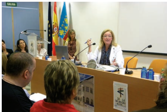
Aspecto de la mesa inaugural de la Jornada

El Área de Salud Mental del Hospital Pare Jofré de Valencia ha celebrado en el Salón de Actos del centro sanitario una jornada, con motivo de la celebración del Día Mundial de la Salud Mental, en la que se analizó la situación pasada y presente, así como las pretensiones de futuro en torno a la Salud Mental.