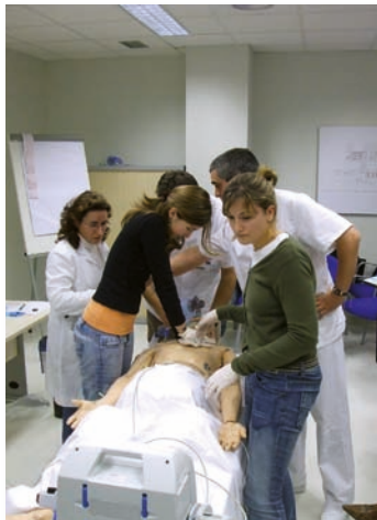
Un grupo de enfermeras aprende nuevas técnicas

Según el resumen de resultados de la consulta correspondiente a los meses de noviembre y diciembre del año pasado, el 69,64 por ciento de las enfermeras que respondieron al estudio realizado a través de PortalCECOVA.es rechazaron