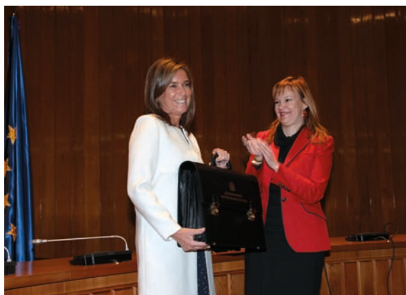
Leire Pajín entrega la cartera ministerial a Ana Mato

El CECOVA felicitó a Ana Mato por su nombramiento al frente del Ministerio de Sanidad, Servicios Sociales e Igualdad y mostró su confianza en que su mandato al frente del mismo “favorezca el entendimiento con las comunidades autónomas en el seno del Sistema Nacional de Salud así como el diálogo con todos los colectivos y las organizaciones profesionales del ámbito sanitario”.