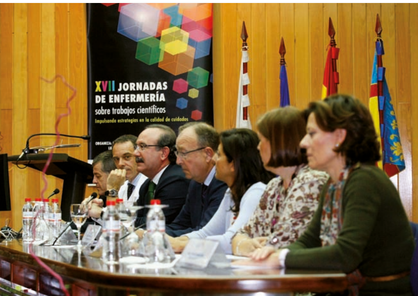
Mesa de clausura de esta actividad en la que se inscribieron más de 900 enfermeras

La División de Enfermería del Departamento de Salud de Alicante-Hospital General, en colaboración con, entre otros, el CECOVA, ha celebrado en el Hospital General Universitario de Alicante las XVII Jornadas de Enfermería sobre trabajos científicos; esta actividad, que se desarrolló en la presente edición bajo el lema de Impulsando estrategias en la calidad de cuidados , se ha consolidado como un referente no sólo en del Departamento y en la provincia de Alicante, sino en el conjunto de la Comunidad Valenciana y así lo demuestra el hecho de que contasen con la inscripción de más de 900 personas.