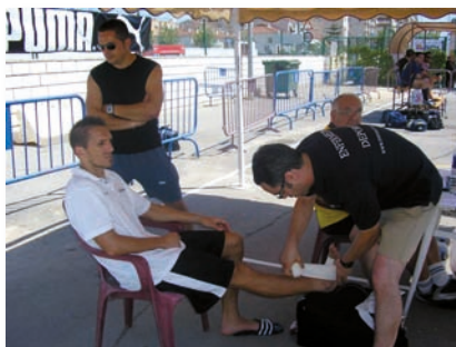
Los interesados en este área tienen una referencia en la nueva asociación

Esta asociación nace con el fin de divulgar la Enfermería Deportiva y de formar e informar a los profesionales de Enfermería de la Comunidad Valenciana en el campo de la actividad física y el deporte relacionados con la salud, además de promocionar su participación en este ámbito laboral, desde el trabajo a pie de pista prestando atención a urgencias deportivas, hasta la prescripción de actividad física saludable en Atención Primaria.