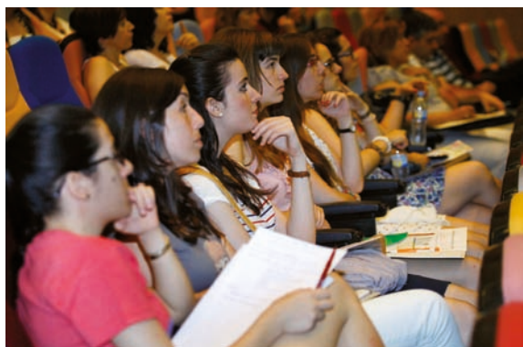
Representantes de diferentes ámbitos acercaron la realidad del ejercicio profesional a estos nuevos profesionales

La Universidad de Alicante (UA) acogió con motivo de la graduación de una nueva promoción de alumnos de los estudios de Enfermería una jornada de orientación dirigida a jóvenes emprendedores y futuros profesionales. En ella participaron representantes de diferentes ámbitos para acercar la realidad del ejercicio profesional a estos nuevos profesionales; entre ellos hubo una nutrida representación de representantes colegiales de los ámbi-