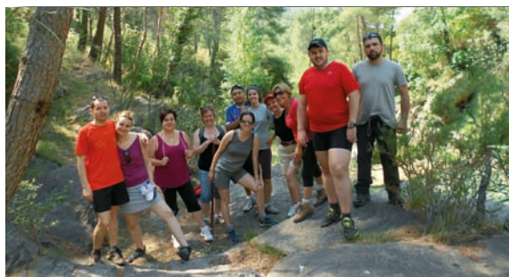
Diversos miembros del Grupo de Senderismo, en la Ruta dels Molins de Lluçena

El Grupo de Senderismo del Colegio Oficial de Enfermería de Castellón (COECS), formado por colegiados de Enfermería de esta provincia y otras personas ajenas al COECS, se ha consolidado en los últimos meses con la programación de numerosas salidas por diversos parajes castellonenses.