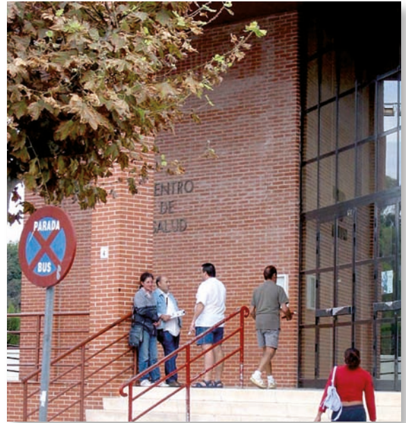
La Organización Colegial de Enfermería reclamó a la Conselleria de Sanidad que reflexionase sobre estas decisiones injustas y generalizadas en toda la Comunidad Valenciana

A modo de ejemplo, desde la Organización Colegial de Enfermería de la Comunidad Valenciana se recordó el caso de la comarca de L'Alacantí donde la Conselleria de Sanidad tenía la intención de dejar solo una enfermera en los Puntos de Atención Continuada durante los turnos de guardia de lunes a viernes, tal y como se denunció desde Satse. En este sentido, se temió que dejar una sola enfermera en los Puntos de Atención Continuada de Mutxamel, Sant Joan d'Alacant, Busot, Aigües de Busot y El Campello suponía "cuestionar la calidad asistencial de los cuidados prestados y también que se viese seriamente afectada la seguridad de los pacientes en un área asistencial con más de 75.000 habitantes, ya que no es una población flotante sino estable durante todo el año".