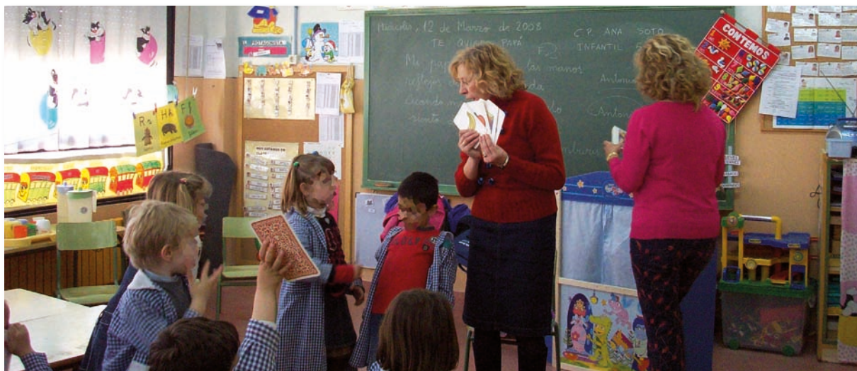
Imagen de una intervención de Enfermería Escolar

El CECOVA, a través de su Grupo de Trabajo Enfermería en Salud Escolar, ha planteado a la Conselleria de Educación la posibilidad de formalizar un convenio de colaboración a través del cual se realice un proyecto de investigación en aquellos centros educativos ordinarios públicos en los que ya existía el servicio de Enfermería Escolar.