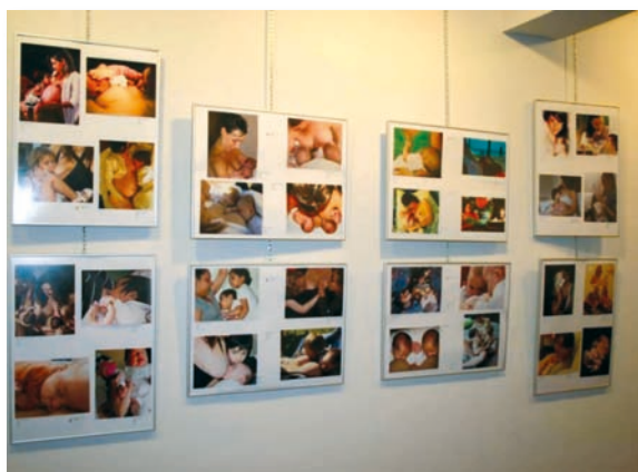
Exposición de los trabajos en la Casa de la Cultura de Dénia

El Grup NodriSSa de Educació i Salut Familiar ha organizado un año más, y ya son 16 ediciones, el Concurso Fotográfico de Lactancia Materna de La Marina Alta enmarcado en sus actividades dirigidas a difundir los beneficios de esta práctica, tanto para los lactantes como para las madres; la promoción y difusión de la salud familiar en las localidades de esta comarca alicantina; y la reivindicación de la figura de la mujer dando el pecho.