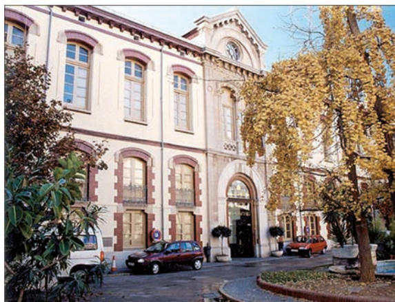
El Hospital Provincial de Castellón es el único que cuenta con plazas específicas de enfermeras especialistas en Salud Mental

La falta de plazas específicas de enfermeras especialistas en Salud Mental en los centros sanitarios de la Agencia Valenciana de Salud contrastó con las declaraciones efectuadas desde la Conselleria de Sanidad en el sentido de que se está dando mayor protagonismo a estas profesionales. Ante ello, desde el CECOVA y los colegios de Enfermería se volvió a denunciar la situación y a pedir que se solucione.