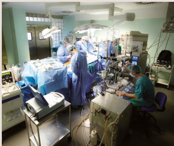
Operación quirúrgica en el Hospital General Universitario de Valencia