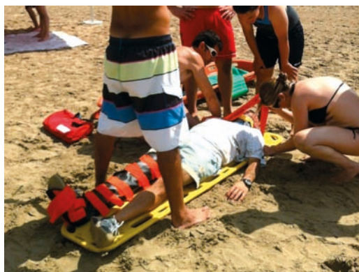
El alumnado del curso durante un simulacro de rescate en la playa

Anteriormente, el alumnado tuvo la oportunidad de conocer los cuidados de Enfermería en la cámara hi-