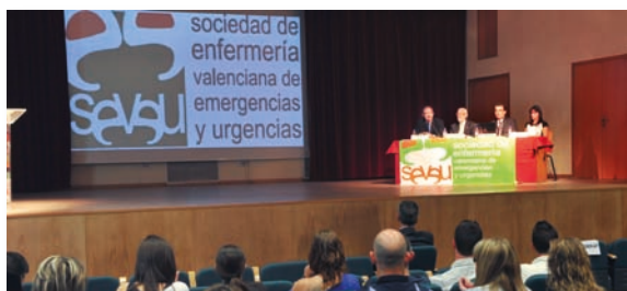
Imagen de la mesa inaugural de las jornadas

El Auditorio de Alboraiá (Valencia) acogió las IV Jornadas de la Sociedad de Enfermería Valenciana de Emergencias y Urgencias (SEVEU) que, bajo el lema Creciendo juntos, analizaron temas de interés para este colectivo con la asistencia de cerca de un centenar de profesionales y estudiantes de Enfermería como las nuevas tendencias en Urgencias, la gestión de las ca-