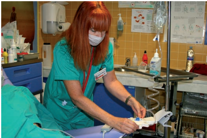
Las enfermeras deben estar al corriente de sus cuotas para poder tener la cobertura del seguro

Delimitación Geográfica de la cobertura: cualquier país, excepto Estados Unidos, Canadá y territorios