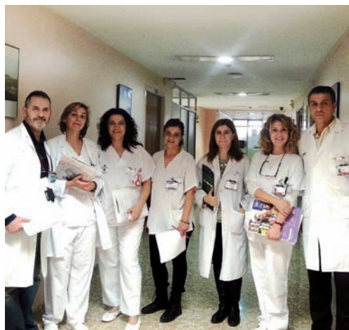
Foto de familia de los investigadores del Hospital Arnau de Vilanova

un grupo de enfermeras voluntarias del Hospital Arnau de Vilanova de Valencia, en dos salas del hospital, una médica y una quirúrgica, recogiendo datos de unos 50 pacientes por sala.