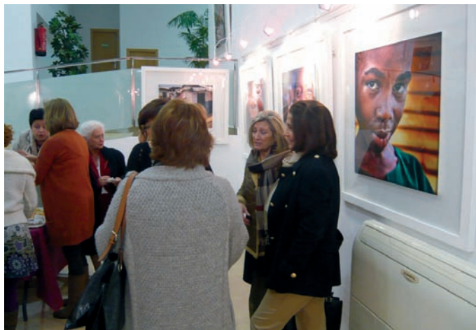
Exposición en Alicante

“ Las asociaciones de jubilados de Enfermería de los colegios de Enfermería de Alicante, Castellón y Valencia tuvieron un papel protagonista en las celebraciones ”