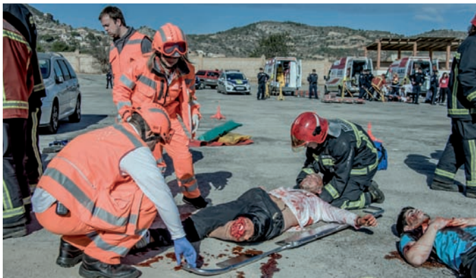
Profesionales sanitarios atienden a un herido durante el simulacro

La acción contó con el apoyo de la Policía Local y los bomberos de Castellón, los integrantes de los servicios del SAMU y de ambulancias de la Conselleria de Sanidad. La in-