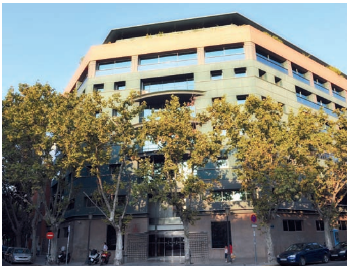
Sede de la Conselleria de Sanidad

Autónomas. Además, sería preceptiva y previa a este objetivo, la recuperación de las pérdidas retributivas sufridas por el colectivo enfermero desde mayo de 2010 hasta la actualidad.