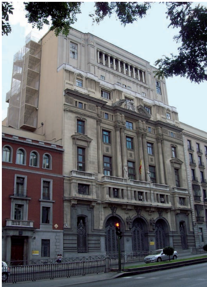
Sede del Ministerio de Educación

El origen del problema está en que en las universidades se cursaban antes diplomaturas, de tres años, y licenciaturas e ingenierías, de cinco. Tras el Plan Bolonia, en la UE se implantaron tres años de grado y dos de máster, mientras que en España se siguieron haciendo cuatro años de grado más uno de máster, lo que ha causado muchos problemas al fijar la equivalencia a los títulos antiguos.