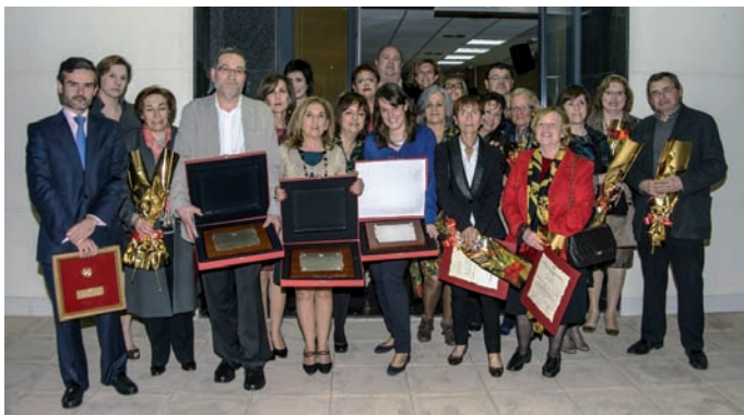
Imagen de uno de los actos en Castellón

Durante el acto institucional, que se celebró en el COECS, se otorgaron menciones especiales consistentes en distinciones para instituciones públicas y privadas