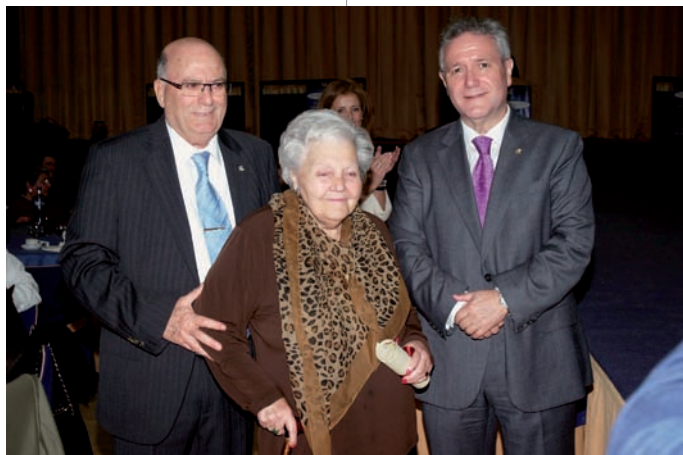
Homenaje en el Colegio de Valencia

Por su parte, el CECOVA emitió una nota de prensa en el que pidió a la Administración sanitaria que "propicie un nuevo contexto clínico donde se puedan aprovechar las oportunidades del liderazgo enfermero", sobre todo, "en aquellos ámbitos sanitarios donde la Enfermería puede y debe desempeñar un papel clave como, por ejemplo, la atención a la cronicidad, los autocuidados y la educación y promoción de la salud".