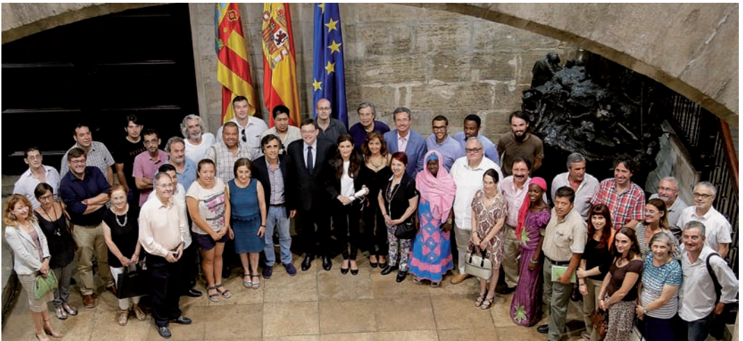
El presidente de la Generalitat, Ximo Puig, y representantes de colectivos sanitarios y de inmigrantes

La Generalitat Valenciana presentó el Decreto-Ley 3/2015 que regula el acceso universal a la atención sanitaria a la sociedad civil durante un acto celebrado en el Palau de la Generalitat, que contó con la presencia del presidente del Consell, Ximo Puig, y la consellera de Sanidad Universal y Salud Pública, Carmen Montón, así como representantes de los colectivos sanitarios y de inmigrantes.