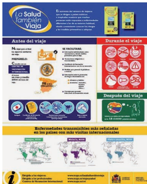
Cartel informativo de la campaña La salud también viaja

Para evitar esperas innecesarias y para hacer posible la mejor atención sanitaria, estos centros tienen habilitado un sistema de cita previa. Además, es aconsejable que los viajeros se informen de las vacunas necesarias con suficiente antelación, ya que hay ciertas profilaxis que necesitan un periodo de tiempo antes del viaje para ser efectivas.