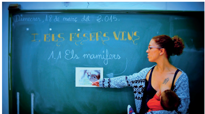
Fotografía ganadora en la categoría de Lactancia Materna en el Trabajo