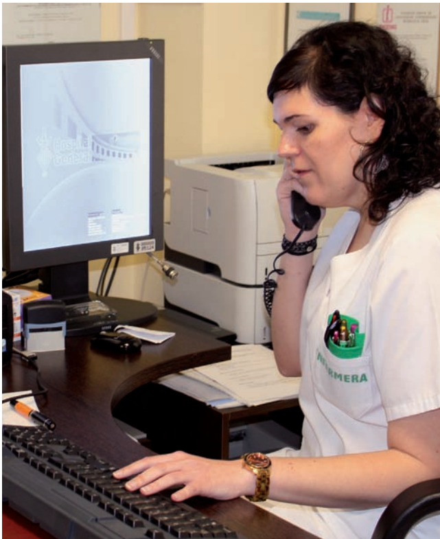
Una enfermera se encarga de la consulta de Enfermería reumatológica