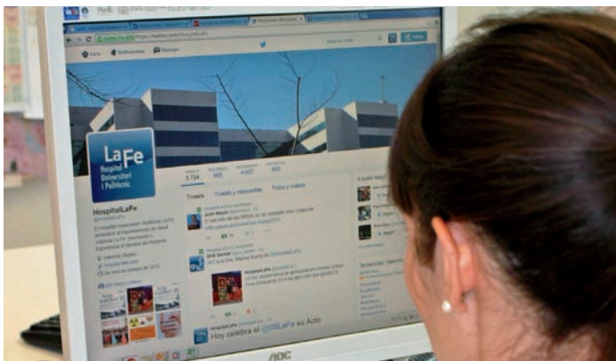
La Conselleria de Sanidad Universal y Salud Pública cambia el uso de la “bolsa interna”

La propuesta presentada por el CECOVA pide “cambios en la regulación de la bolsa interna o “bolsín” regulada en la Disposición Adicional Primera de la Orden vigente de la Bolsa de Trabajo, pues se ha utilizado esta bolsa específica de forma frecuente con criterios de excesiva discrecionalidad, además de recurrirse a ella