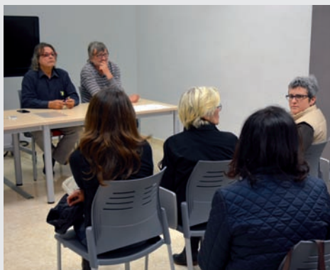
Asamblea en la que se aprobó el cierre de la sede de Benicarló

El COECS lamenta tomar esta decisión puesto que la sede de Benicarló se abrió en 2013 con la firme intención de trasladar allí parte del trabajo administrativo y de formación que se realizaba en Castellón de La Plana.