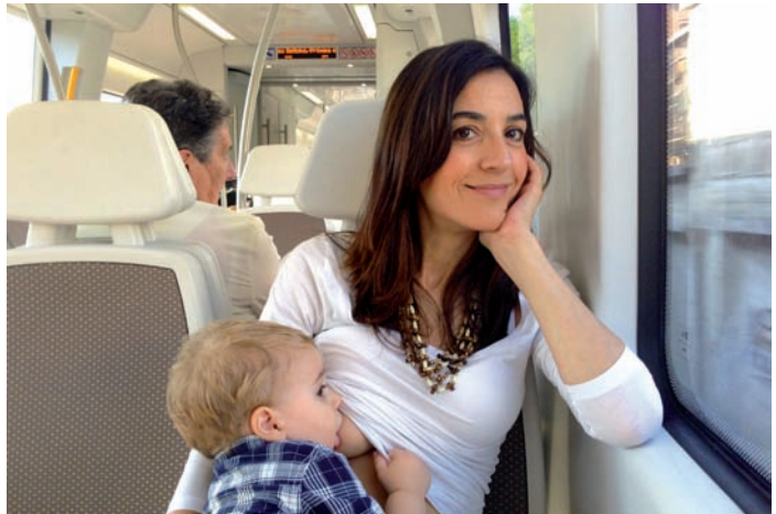
Fotografía ganadora en la categoría de Lactancia Materna Prolongada

Entre las actividades que organiza el Grup Nodrissa destaca el taller de lactancia que celebra cada lunes entre las 16 y las 18:30 horas en l'Espai Llnàtics del Ayuntamiento de Dénia para ayudar a las madres a resolver dudas sobre algún aspecto de la lactancia o sobre la crianza de los hijos, entre otros temas.