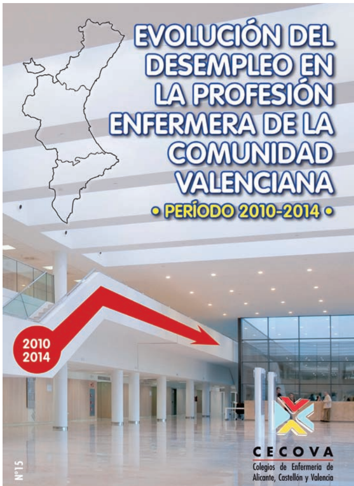
Portada del informe profesional número 15

REFLEJA UN AUMENTO DEL PARO cercano al 19 por ciento durante el período analizado, pero constata un descenso del mismo en 2014