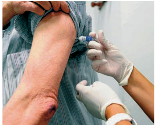
La póliza de RCP cubre a las enfermeras colegiadas

La póliza incluye un subsidio por inhabilitación temporal a consecuencia del ejercicio de la profesión enfermera, con un importe máximo a pagar de 4.000 euros mensuales, con un límite de 24 meses y en ningún caso excederá de los ingresos medios mensuales obtenidos durante los 12 meses anteriores a la condena.