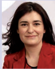
Carmen Montón Consellera de Sanidad Universal y Salud Pública