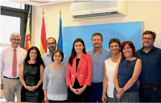
Foto de familia del nuevo equipo directivo de la Conselleria de Sanidad Universal y Salud Pública