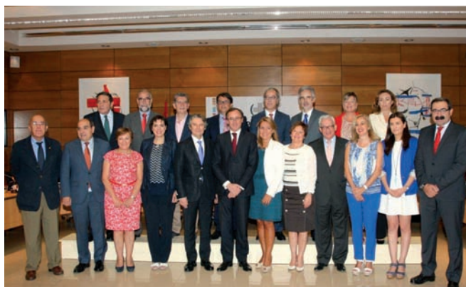
Foto de familia del Consejo Interterritorial del Sistema Nacional de Salud

La vacuna de la varicela volverá al calendario vacunal oficial en edad pediátrica en 2016, es decir, se administrará a todos los niños a partir de un año y estará financiada por el sistema sanitario público. El Consejo Interterritorial (CI) del Sistema Nacional de Salud (SNS) aprobó incluirla de nuevo en el calendario y mantenerla en adolescentes a partir de 12 años que no hayan pasado la enfermedad.