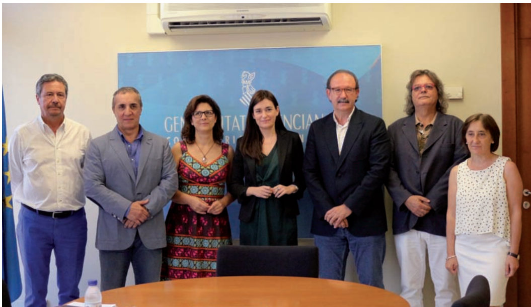
Reunión del presidente del CECOVA y los tres presidentes colegiales con la consellera Carmen Montón

El nombramiento de Carmen Montón al frente de la Conselleria de Sanidad Universal y Salud Pública abrió grandes expectativas para la profesión enfermera de la Comunidad Valenciana y, en ese sentido, el CECOVA estuvo a la vanguardia del colectivo de Enfermería a la hora de trasladar a la nueva consellera las principales reivindicaciones enfermeras, que le fueron dadas a conocer personalmente en un encuentro días después de su llegada al cargo.