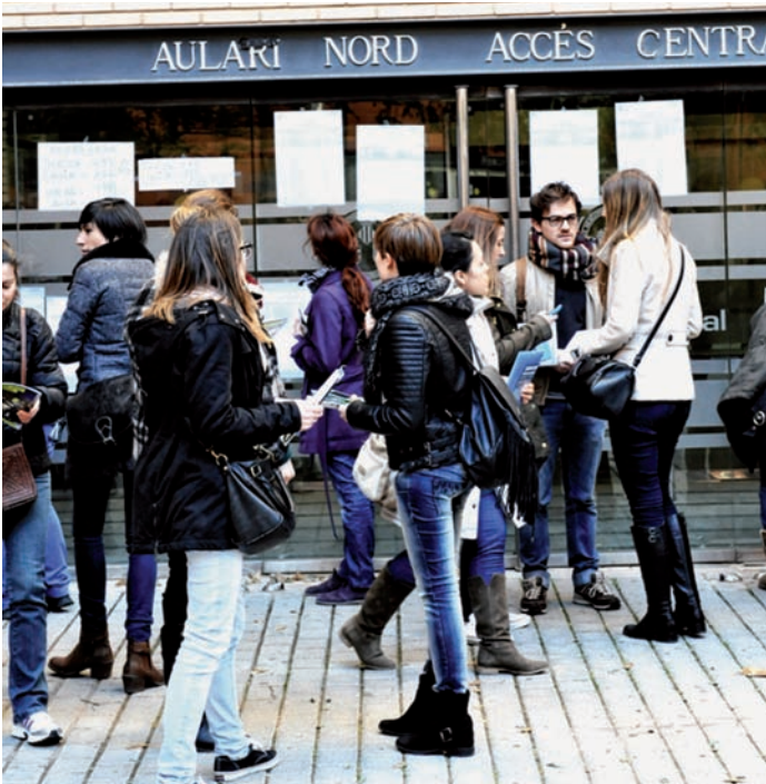
Profesionales de Enfermería durante el examen de la pasada convocatoria de las pruebas de acceso al EIR

EN LA PRÓXIMA CONVOCATORIA se incrementará el número de preguntas del examen de Enfermería, igualándolo con el resto de las titulaciones