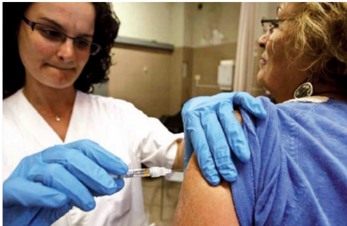
El procedimiento de riesgo con más frecuencia es la inyección intramuscular o subcutánea

El REBA se puso en marcha en 2009 para crear un sistema de vigilancia de las exposiciones accidentales a agentes biológicos, tales como el virus de inmunodeficiencia humana (VIH), virus de la hepatitis B y C, de los trabajadores de los centros sanitarios, públicos y privados, en el ámbito de la Comunidad Valenciana.