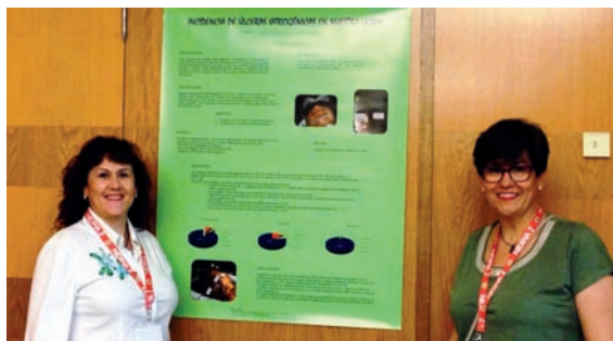
Dos enfermeras de la UCIPN del Hospital General de Castellón posan con la comunicación premiada

Según Aledo, las enfermeras de Salud Mental tienen que adquirir una mayor relevancia en estas situaciones ya que está demostrado que su intervención reduce el estrés de los padres favoreciendo ellos mismos con su cuidado la recuperación del bebé.