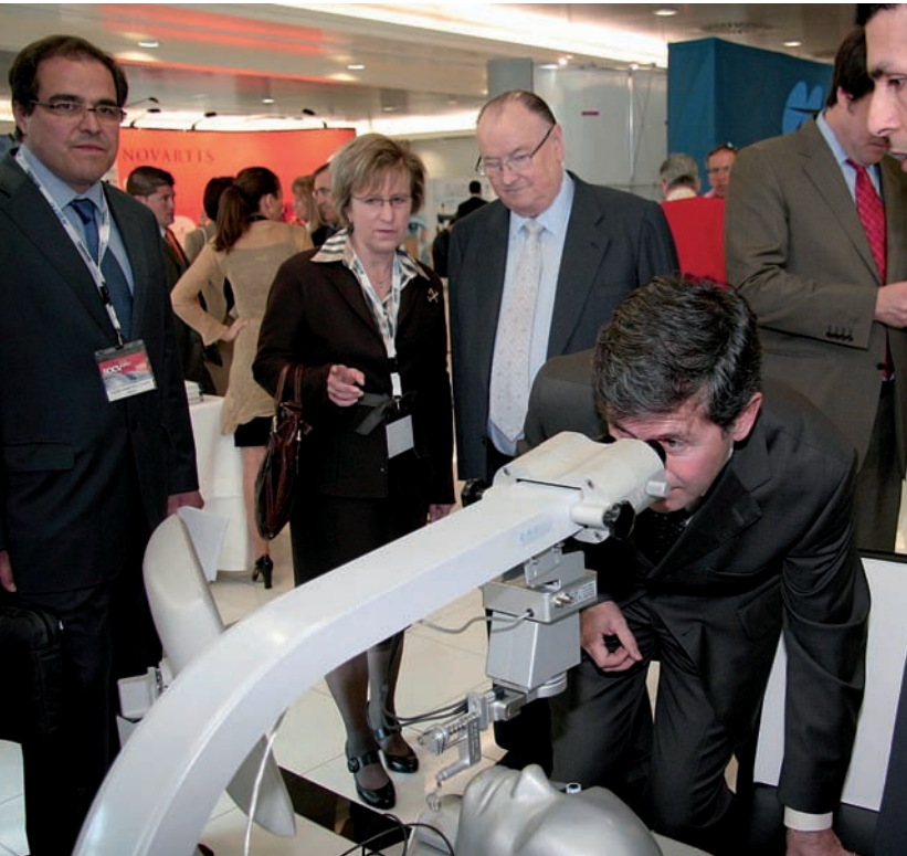
En la imagen una de las actividades incluidas en el programa del Congreso