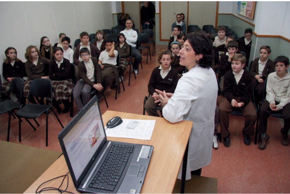
Una enfermera escolar imparte una clase de Educación para la Salud en un centro escolar de Gandía

Gandía (Valencia) se convertirá los días 29, 30 y 31 de octubre en la capital española de la Enfermería Escolar, ya que en estas fechas tendrá lugar el II Congreso Nacional de Enfermería y Salud Escolar con el lema Haciendo realidad un proyecto educativo y asistencial , que organiza el Consejo de Enfermería de la Comunidad Valenciana (CECOVA) en colaboración con los colegios de Alicante, Castellón y Valencia.