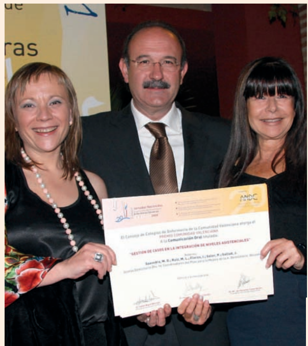
Imagen de los ganadores del Premio Comunidad Valenciana, otorgado por el CECOVA a la Comunicación Oral