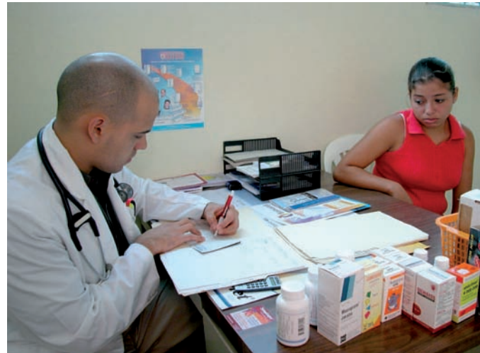
La imagen del médico recetando medicamentos a los pacientes puede cambiar en breve

El cambio legal para regular la "participación" en la prescripción de determinados medicamentos de enfermeras y podólogos podría estar aprobado en verano