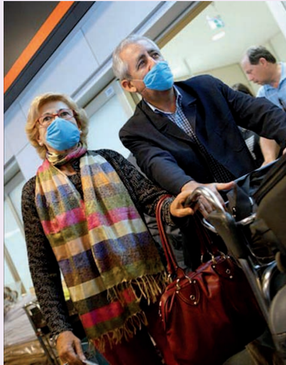
Dos viajeros procedentes de México se protegen con una mascarilla

"Del cumplimiento a rajatabla de estas medidas de prevención y de protección personal en el ámbito laboral depende, en gran medida, que los pacientes,