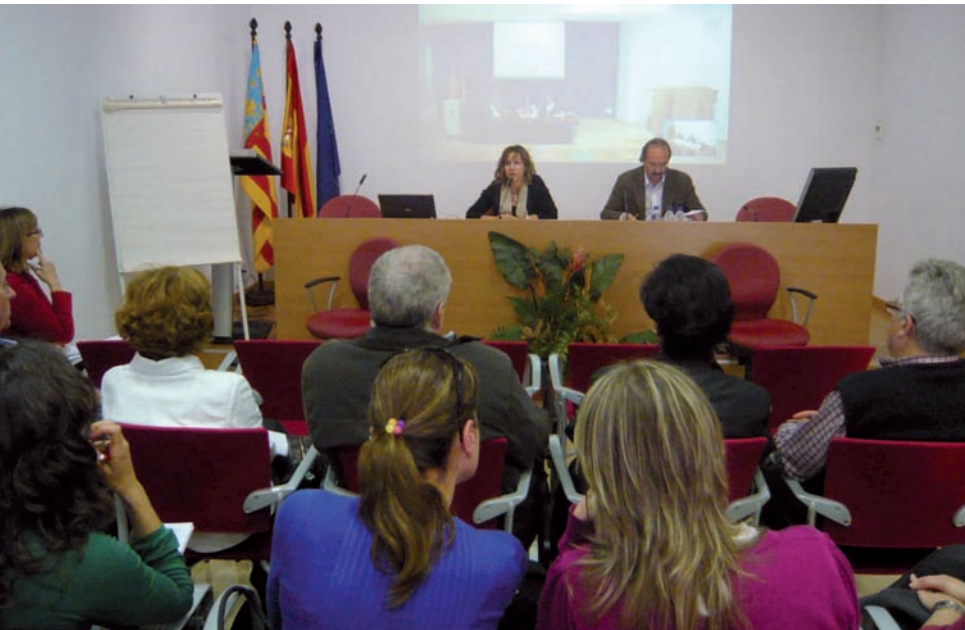
Imagen de la reunión en Alicante

Se solicita que la experiencia profesional se tenga en cuenta