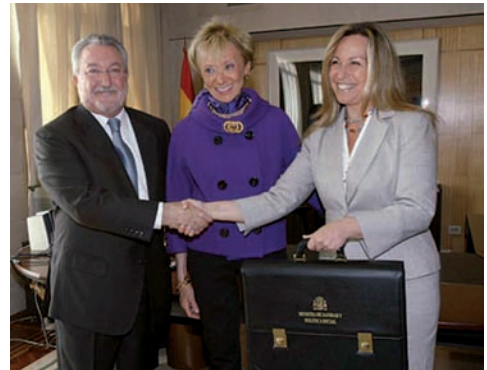
Bernat Soria traspasa la cartera ministerial a Trinidad Jiménez en presencia de la vicepresidenta primera del Gobierno, María Teresa Fernández de la Vega

Por este motivo, el CECOVA recordó a los nuevos ministros de Sanidad y Política Social y de Educación, Trinidad Jiménez y Ángel Gabilondo, respectivamente, que "a pesar de que han transcurrido casi cuatro años de la publicación del mencionado Real Decreto, y haber presentado la documentación acreditativa para optar a la especialidad de Enfermería en Salud Mental por la vía de acceso excepcional, todavía no se ha convocado por parte del Ministerio de Educación la prueba de Evaluación de la Competencia, por lo que el colectivo de Enfermería afectado no puede tener acceso a su titulación Especializada".