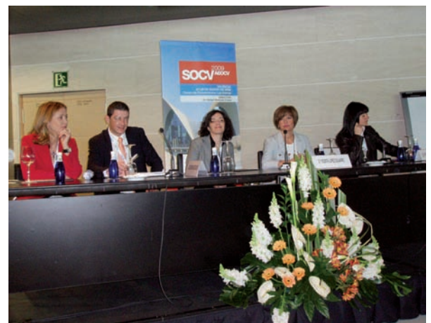
El Congreso puso sobre la mesa temas de gran interés en el ámbito de la Oftalmología