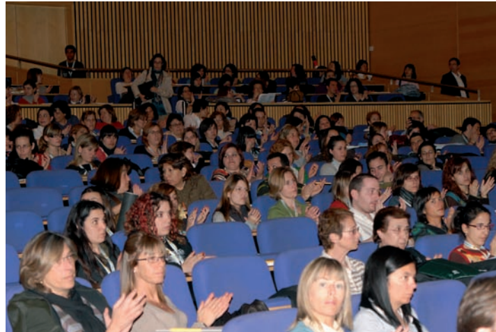
El congreso reunió a más de 800 enfermeros especialistas en Salud Mental de seis comunidades autónomas

Por último, el documento de conclusiones también advierte de que "no podemos olvidar la necesidad de reivindicar el papel de los profesionales de Enfermería en todos los dispositivos de salud mental, no permitiendo las