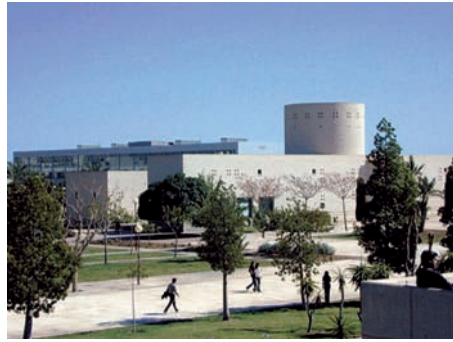
Imagen de la Escuela de Enfermería de la Universidad de Alicante

El acuerdo establece que CECOVA y UA, de común acuerdo, constituirán una comisión mixta en régimen paritario para la programación, seguimiento y valoración de las actividades derivadas de este convenio. Además, los conflictos que pudieran surgir de la interpretación, desarrollo, modificación y resolución del acuerdo deberán ser