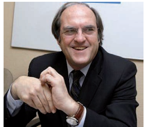
Ángel Gabilondo, nuevo ministro de Educación