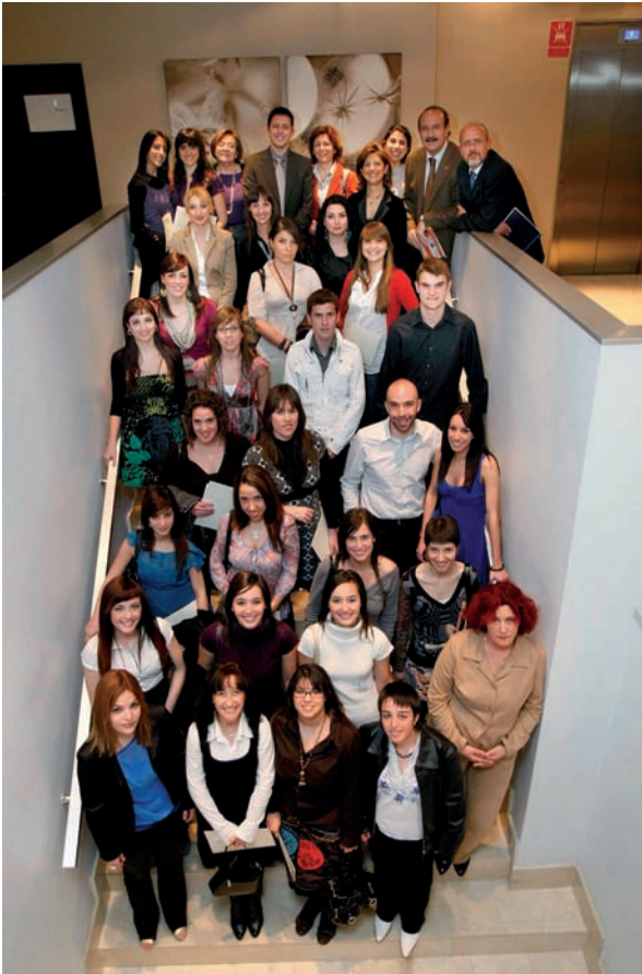
Los nuevos colegiados que realizaron el Juramento Enfermero, junto a miembros de la Junta de Gobierno de Alicante y representantes del CECOVA

la esencia de la profesión enfermera en España.