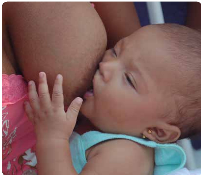
Una mujer amamanta a un recién nacido.

LA ORGANIZACIÓN MUNDIAL DE LA SALUD (OMS) RECOMIENDA QUE LA LACTANCIA MATERNA EXCLUSIVA SE PROLONGUE HASTA LOS SEIS MESES