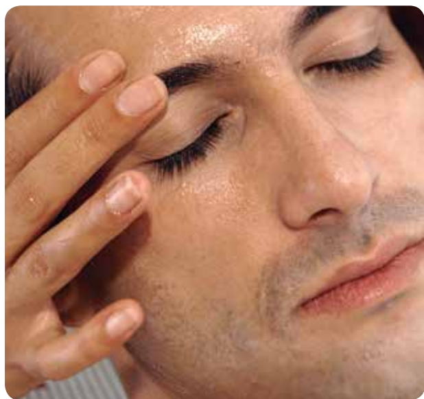
Un 82% de las consultas neurológicas son por cefaleas o migrañas.

ASÍ LO CONCLUYE EL DEPARTAMENTO DE LA MARINA BAIXA, DONDE ESTÁ LA PRIMERA CONSULTA DE ENFERMERÍA NEUROLÓGICA GENERAL