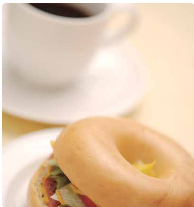
La alimentación influye en los accidentes cardiovasculares.

Beber mucha agua, no abusar del café y hacer ejercicio con regularidad son medidas que ayudan a prevenir este tipo de dolencias.