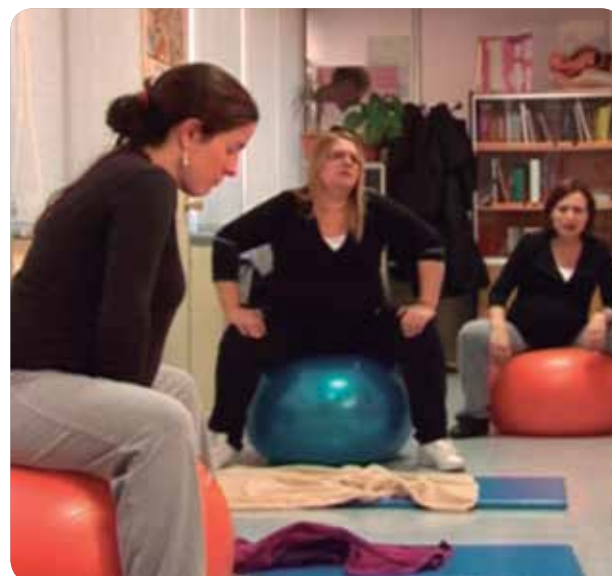
Un grupo de mujeres embarazadas durante una clase con la matrona.

La técnica consiste en insertar finas agujas de acupuntura en puntos concretos que beneficiarán el inicio espontáneo del trabajo de parto. Con esta técnica, la mujer tiene 3,5 veces más probabilidad de iniciar el parto de forma espontánea.