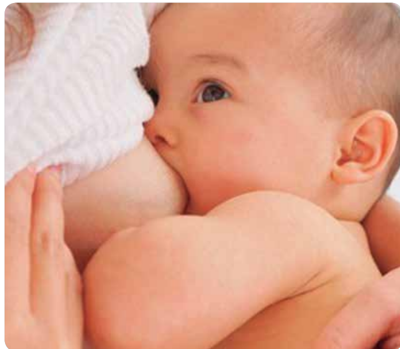
La Iniciativa trata de eliminar las barreras que impiden que las madres den el pecho a sus bebés durante seis meses.

Los resultados del estudio Hábitos de Lactancia Materna , del Grupo español de la Iniciativa Global para la Lactancia Materna, evidencian que la vuelta al trabajo de las madres y la falta de condiciones adecuadas para la extracción de la leche materna son los principales obstáculos para continuar con la lactancia hasta los seis meses recomendados.