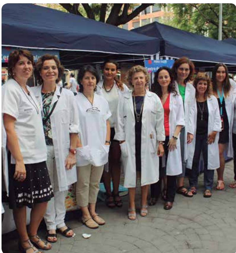
Un grupo de profesionales sanitarios del Centro de Salud de Moncada.

Además, el Centro de Salud de Moncada ha contado con la colaboración de alumnos de Enfermería de la Universidad Cardenal Herrera-CEU. Éstos han tomado constates y han realizado talleres informativos alrededor de temas como la promoción de la salud en la infancia y la adolescencia.