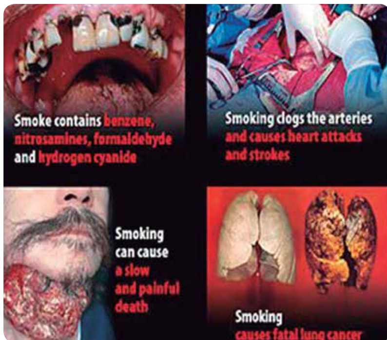
Entre los principales factores de riesgo están el consumo de tabaco y alcohol.

ES EL SEXTO TIPO DE CÁNCER MÁS COMÚN EN TODO EL MUNDO Y SE CALCULA QUE 62.000 PERSONAS MUEREN EN EUROPA CADA AÑO