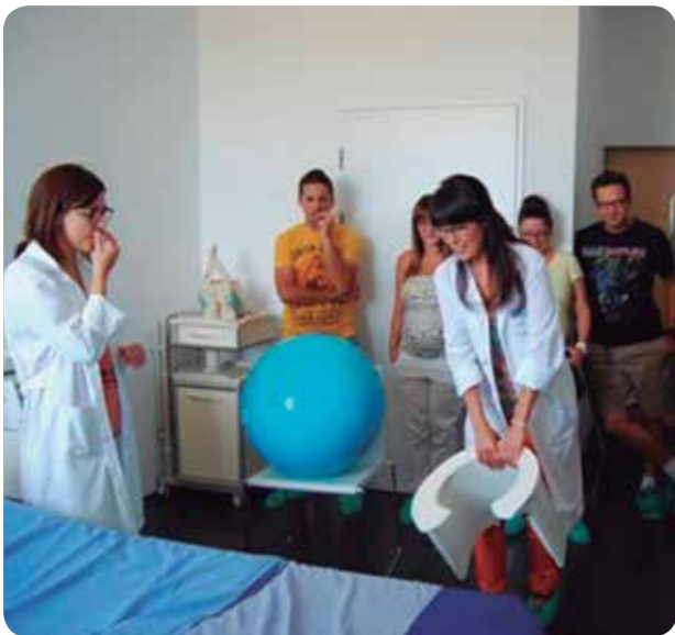
Una matrona explica la silla de partos durante la visita guiada.

EL CENTRO DISPONE DE ELEMENTOS DE AYUDA PARA EL PARTO NATURAL PERO LAS MUJERES PUEDEN LLEVAR SU PROPIA MÚSICA O ALMOHADONES