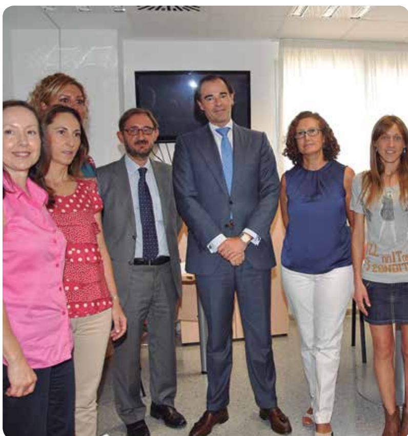
El conseller visitó el CSI Burriana II en su segundo aniversario.

En este departamento castellonense hay seis enfermeras gestoras que cubren los municipios de Burriana, Vila-real, Onda, La Vall d'Uixó, Nules y el propio Hospital Universitario la Plana.