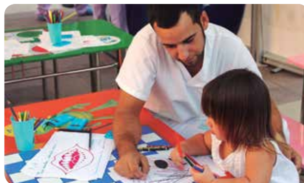
Diferentes talleres han enseñado hábitos saludables a la población.

El objetivo es la concienciación de la población sobre los principales problemas de salud que acompañan la época estival. Así, durante la campaña, los visitantes han dispuesto de talleres saludables donde las enfermeras han compartido acciones informativas y formativas sobre la prevención del melanoma, información útil para pacientes desplazados, alimentación saludable, neonatología, parte natural y oleada de calor, entre otros.