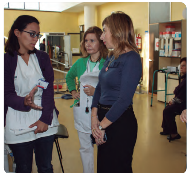
La directora general de Asistencia Sanitaria ha visitado el nuevo servicio.

La Rehabilitación Respiratoria forma parte del tratamiento individualizado del paciente.