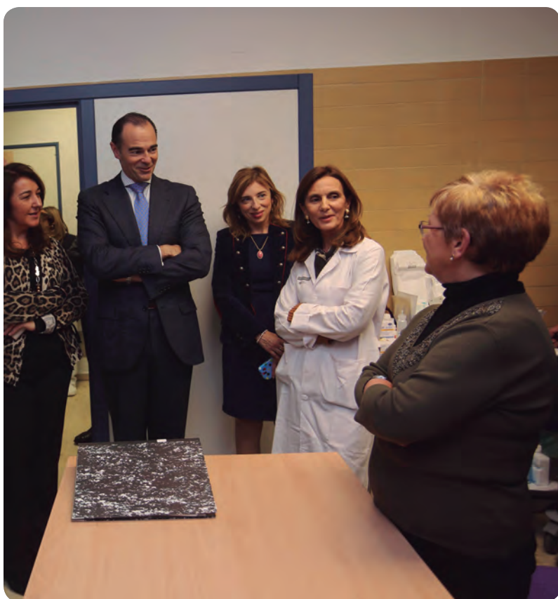
El conseller de Sanitat durante la visita a la nueva unidad.

En el Hospital de Elda de las 190 intervenciones quirúrgicas realizadas en este ámbito en 2012, en 134 se evitó la extirpación total de la glándula mamaria.