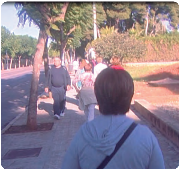
Hacer ejercicio un día a la semana anima a hacer deporte y mejora la salud.

EL PROGRAMA CONSISTE EN HACER EJERCICIO UN DÍA A LA SEMANA PARA QUE COMPRUEBEN LOS BENEFICIOS DEL DEPORTE EN SU SALUD