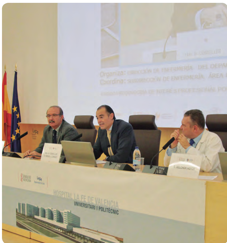
Durante el acto de inauguración de las IX Jornadas Científicas de Enfermería de La Fe.