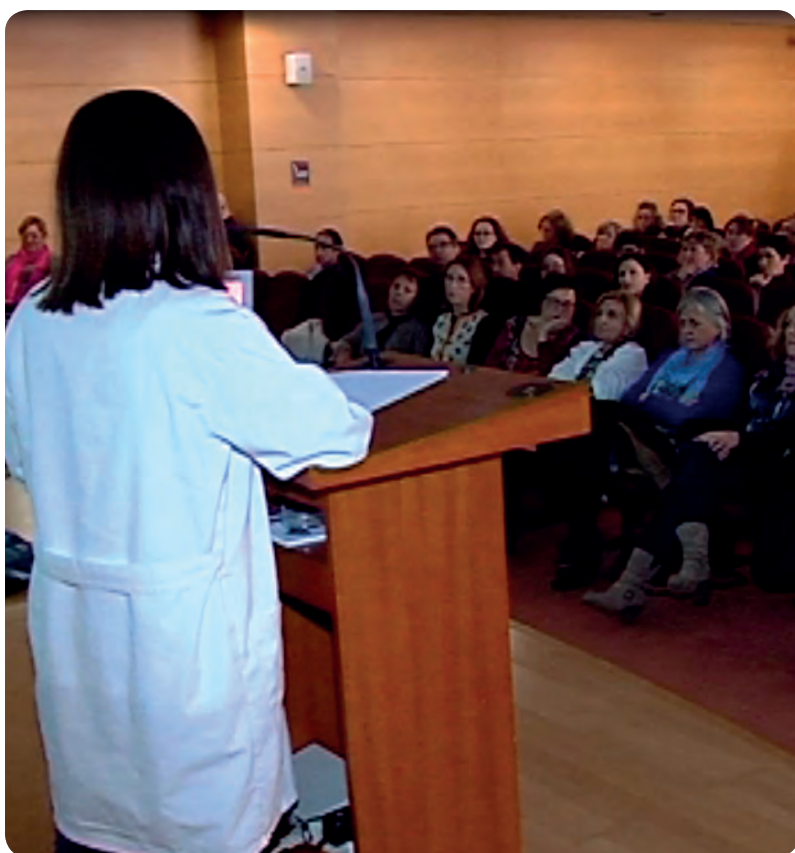
Durante la presentación de la Jornada sobre UPP.

La Conselleria de Sanitat ha elaborado una nueva Guía específica sobre úlceras por presión en que se han incluido tres versiones: una guía más completa, una guía rápida dirigida profesionales sanitarios ya formados, y una tercera guía dedicada las personas que tienen úlceras o riesgo de sufrirlas y a sus cuidadores.