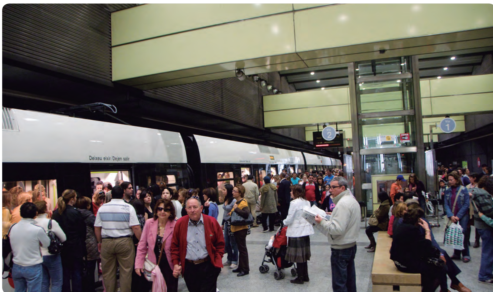
Los defensores piden "vapear" en lugares públicos cerrados, excepto en colegios y centros sanitarios.

DIRIGIDO A USUARIOS DE LA SANIDAD DE LA COMUNIDAD VALENCIANA