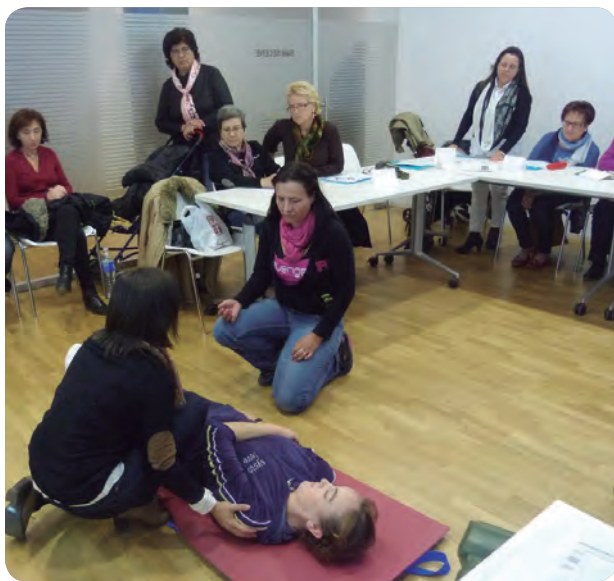
Las profesionales del Mutxamel durante el taller ofrecido a los cuidadores.

ALGUNOS DE LOS TEMAS TRATADOS SON LOS CUIDADOS BÁSICOS DEL DEPENDIENTE Y LA PREVENCIÓN DE ACCIDENTES DOMÉSTICOS