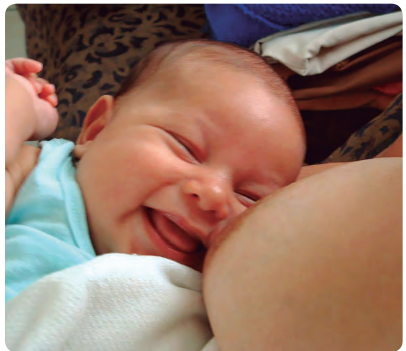
La campaña ofrece recomendaciones para cuidar la alimentación durante la lactancia.

La Asociación Española de Matronas y la de Cerveceros de España han iniciado la campaña Su alimentación depende de ti. Durante la lactancia, bebe SIN , con el objetivo informar de la incompatibilidad del consumo de alcohol y la lactancia, así como guiar sobre pautas de alimentación saludables y equilibradas para las madres que se encuentran en este periodo.