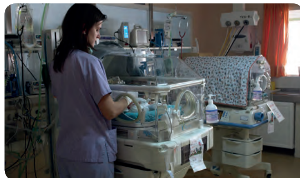
Una profesional sanitaria atiende a un bebé prematuro.

"la leche materna viene congelada, sin que pierda ninguno de sus propiedades". De esta manera, en el momento en que tiene que ser administrada se prepara de forma fácil, señalan profesionales del departamento.