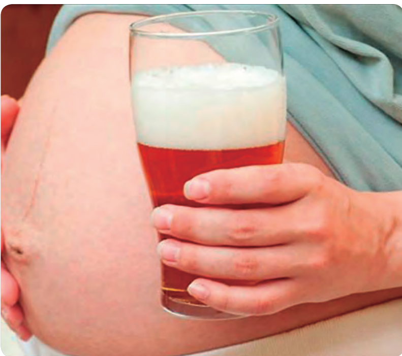
Una embarazada consume cerveza sin alcohol.

ESTA CERVEZA CUENTA CON UNA INTERESANTE COMPOSICIÓN NUTRICIONAL Y COMPUESTOS FENÓLICOS CON PODER ANTIOXIDANTE