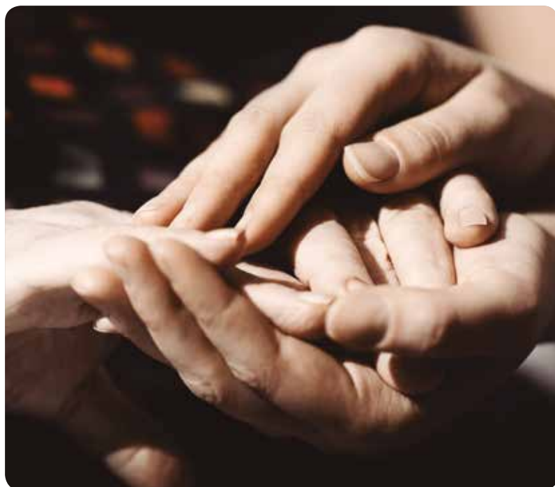
Desaparece la incompatibilidad de trabajar para poder ser cuidador.

EL CONSEJO AUTONÓMICO DE ENFERMERÍA (CECOVA) LAMENTA QUE LAS ENFERMERAS NO ESTÉN EN LOS EQUIPOS DE VALORACIÓN MUNICIPAL