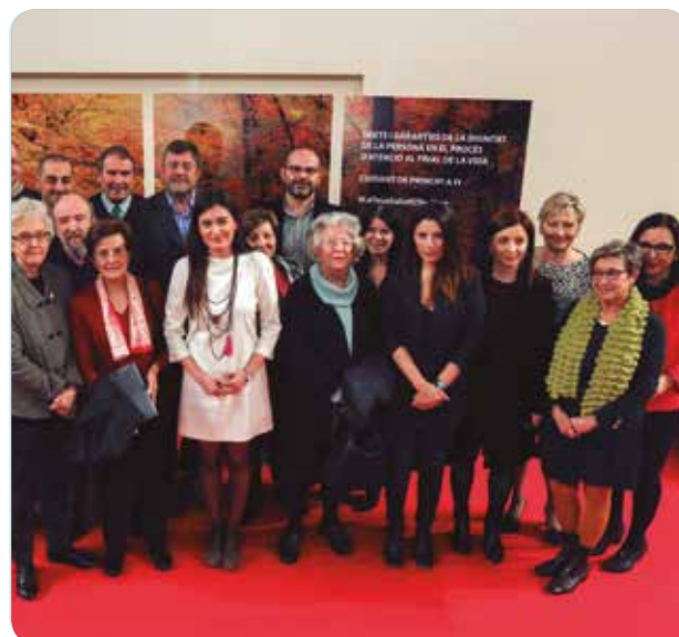
Durante la presentación del anteproyecto de Ley de atención en el proceso final de la vida.

deberes del personal sanitario encargado de este proceso y las obligaciones para las instituciones sanitarias. Entre las novedades incluye que el profesional sanitario deberá dejar constancia del proceso en la historia clínica y respetar las decisiones del paciente, tanto a través del consentimiento informado o en instrucciones previas. Además, el personal sanitario responsable de pacientes en el proceso de final de la vida estará obligado a consultar el Registro de Voluntades Anticipadas, si su contenido no está incorporado en la historia clínica. La Ley contempla la posibilidad de acudir a los Comités de Ética Asistencial para clarificar y resolver conflictos de valores que puedan generarse. También establece que las instituciones sanitarias deben asegurar la oferta de una formación específica.