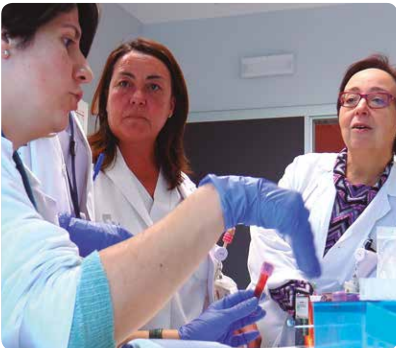
Las investigadoras del proyecto agradecen la ayuda de las asociaciones.

A PARTIR DE UNA MUESTRA DE SANGRE, CON LA FARMACOGENÉTICA, SE AJUSTA AL MÁXIMO EL MEDICAMENTO Y LA DOSIS PARA CADA PACIENTE