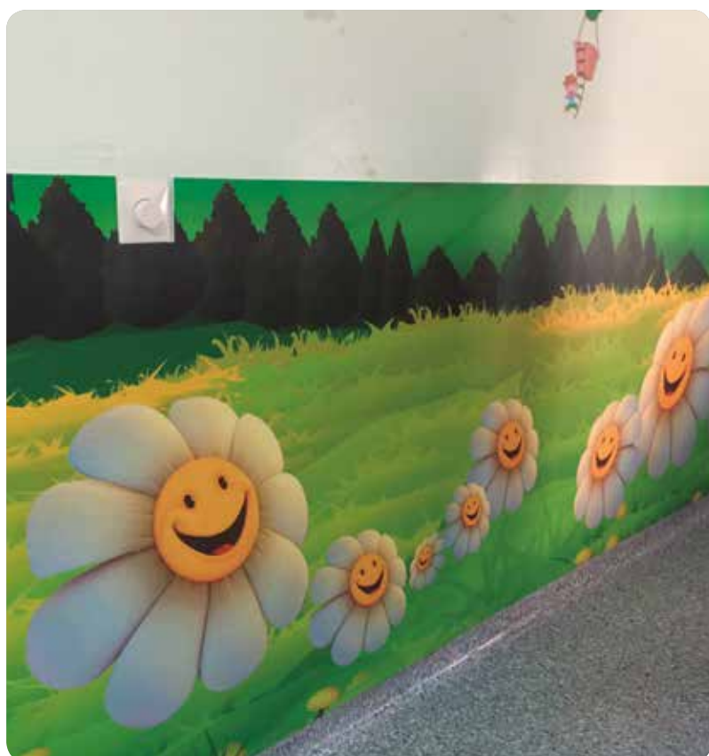
Una de las ilustraciones de la UCI Pediátrica del Hospital General de Alicante.

En 2015 se realizaron 211 ingresos (57 urgentes, 66 programados y 88 ingresos internos) que generaron 1072 estancias con una estancia media de 5,08 días, un índice de ocupación del 58,7% y un índice rotación del 42,2.