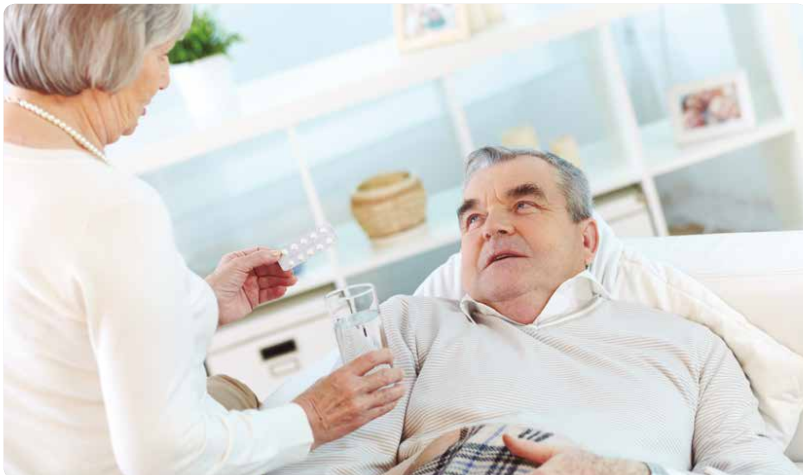
La propuesta del nuevo decreto de reconocimiento de la dependencia regula la figura de persona cuidadora no familiar, que deberá tener un contrato laboral.

DIRIGIDO A USUARIOS DE LA SANIDAD DE LA COMUNIDAD VALENCIANA