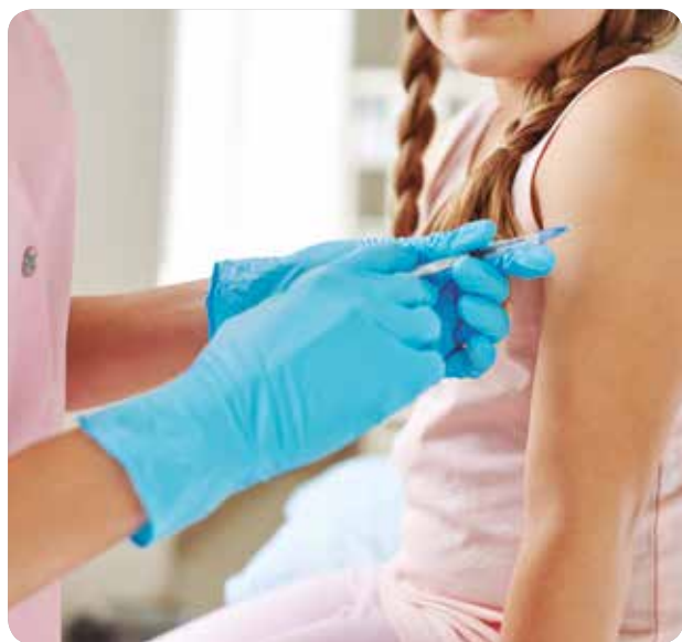
El protocolo especifica las vacunas y pautas a administrar.

LA MODIFICACIÓN DEL CALENDARIO, ESPECIFICADA EN EL PROTOCOLO PARA ENFERMERAS Y MÉDICOS, ENTRA EN VIGOR EL 1 DE ENERO DE 2017