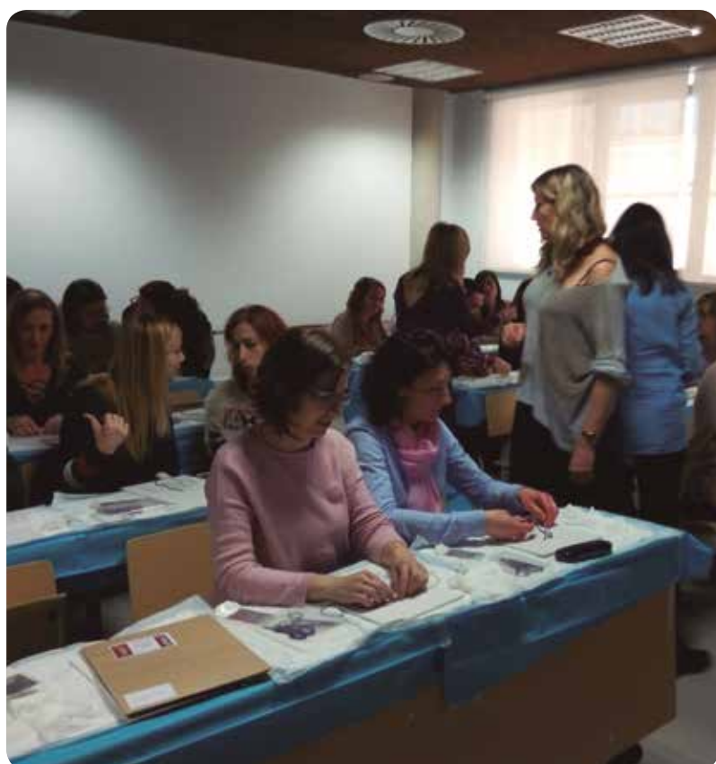
Uno de los talleres prácticos sobre sutura continua perineal.

Una formación que actualiza los conocimientos de las profesionales y que ayudan a mejorar la atención que prestan a las mujeres y el autoconocimiento de las mismas.