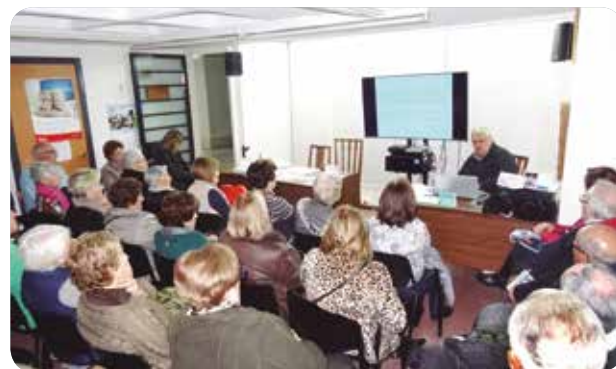
Una de las sesiones formativas ofrecidas por los profesionales del Departamento.

El grupo ya ha comenzado las sesiones formativas. Por ejemplo, el 20 de diciembre, el enfermero gestor de casos comunitarios del Centro de Salud del Raval formó a los asistentes en "Cómo cuidar al cuidador", también se llevó a cabo una charla sobre el "Cáncer de mama" en Santa Pola y otra sobre "Recomendaciones y hábitos saludables" para mayores de 65 años. El próximo 24 de enero el farmacéutico de área formará a los asistentes en "Farmacia y parafarmacia".