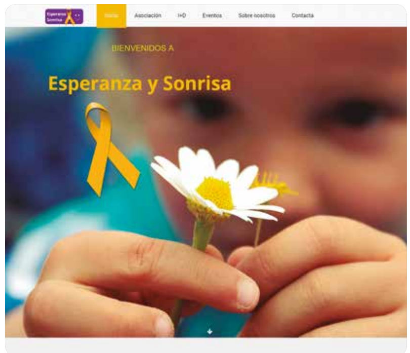
Esperanza y Sonrisa organiza varios eventos a lo largo del año para recaudar fondos para investigación.

Aunque la incidencia del cáncer en los niños es muy baja, cada año se diagnostican cerca de 1.400 nuevos casos en España, lo que representa el 3% de todos los cánceres. Pero, a pesar de ser una enfermedad rara, el cáncer infantil es la primera causa de muerte por enfermedad hasta los 14 años, según datos de la Asociación Española contra el Cáncer. Los bebés son particularmente vulnerables a la aparición de ciertos tipos de cáncer. El neuroblastoma es el más frecuente. Este tumor puede presentarse en diversas partes del cuerpo y con frecuencia se diagnostica ya con metástasis.