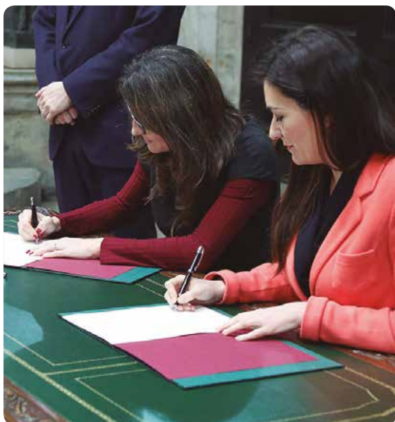
Las conselleras de Igualdad, Mónica Oltra, y Sanidad, Carmen Montón, durante la firma del acuerdo.

Llama la atención, indica CECOVA, la voluntad de transversalidad y mejora de la atención anunciada en la presentación de esta iniciativa cuando la Estrategia de Salud Mental 2016-2020 de la Conselleria de Sanidad Universal y Salud Pública no tenía previsto contratar enfermeras especialistas en este ámbito.