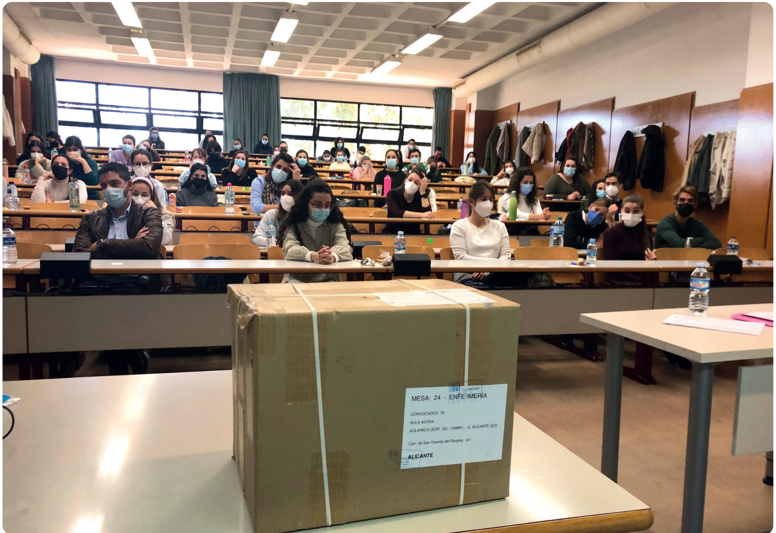
Imagen de la última edición del EIR

Una de cada dos alumnas de la Escuela de Enfermería La Fe, adscrita a la Universitat de València, presentadas a la última convocatoria será especialista