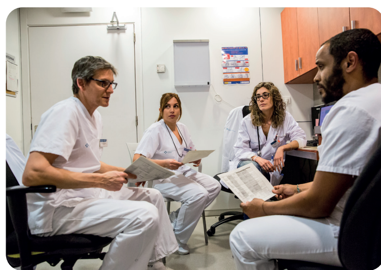
Banc Imatges Infermeres. Autores: Ariadna Creus y Àngel Garcia

Las enfermeras/os hemos trabajado en unas condiciones completamente lamentables por la falta de materiales de protección, tests, vacu-