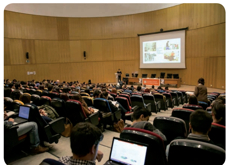
Salón de actos del aulario II en la Universidad de Alicante

Por su parte, la Facultad de Ciencias de la Salud de la Universidad de Alicante (UA) ha otorgado varios premios destinados a galardonar las mejores comunicaciones orales y los mejores pósteres presentados por los alumnos del Grado en Enfermería y para los del Grado en Nutrición Humana y Dietética con el objeto de incentivar la participación activa de los estudiantes en este tipo de evento.