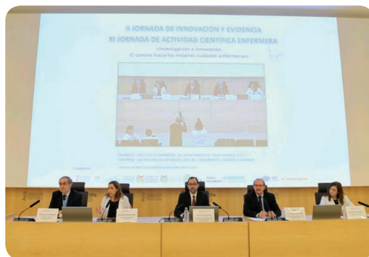
Acto inaugural de la jornada

Además, durante las jornadas el personal de Enfermería, los estudiantes del Grado en Enfermería y Fisioterapia, así como las asociaciones de pacientes, pudieron participar en cuatro mesas redondas en las que se presentaron un total de 20 comunicaciones y 28 pósters.