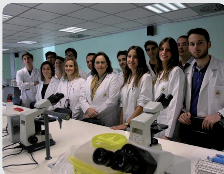
Equipo que desarrolla el estudio sobre el cáncer de mama

Las Unidades de Mama del sistema sanitario en España tienen como objetivo ofrecer una asistencia integral y multidisciplinaria que tenga en cuenta, además del tratamiento, el equilibrio emocional, la imagen corporal y la reincorporación de la mujer a su ambiente familiar y social. Esto implica la participación de diversos especialistas de la salud en los procedimientos diagnósticos y terapéuticos, entre ellos el personal enfermero. Para evaluar su grado de especialización y sus necesidades formativas en la colaboración con médicos y cirujanos, los profesores y estudiantes de la CEU-UCH integrantes de este proyecto de "Investigación+Docencia" estudiarán la participación, las tareas y las características de la formación especializada del personal de Enfermería con dedicación a la patología mamaria en 147 hospitales españoles, en los cuales existe servicio de Unidad de Mama.