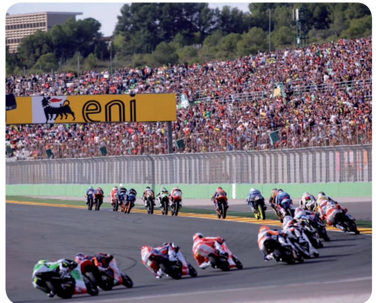
Entrenamientos del Campeonato de España de Velocidad