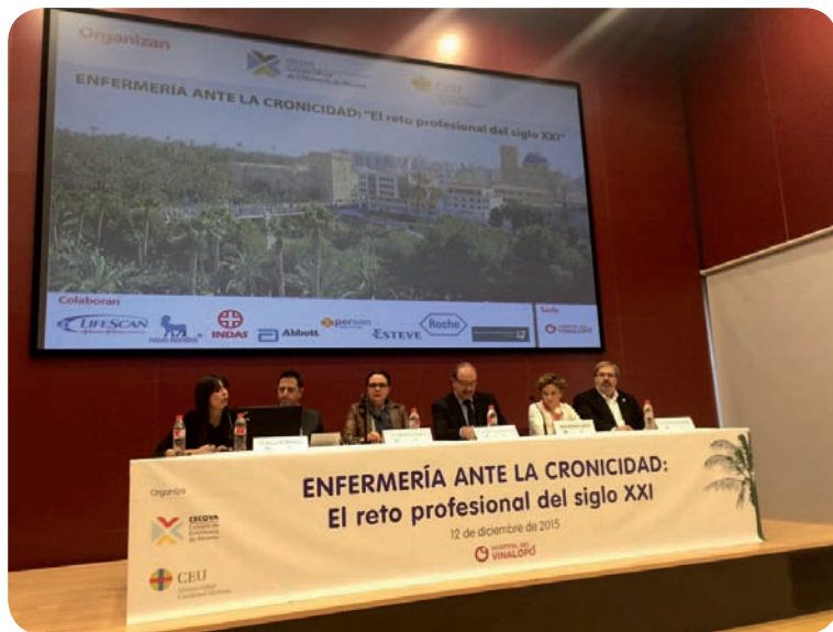
Mesa inaugural de la I Jornada Autonómica Enfermería ante la Cronicidad

El progresivo envejecimiento de la población y el incremento de la esperanza de vida están acercando el patrón epidemiológico hacia las enfermedades consideradas crónicas en los países industrializados. Por ese motivo, la Universidad CEU Cardenal Herrera de Elche y el CECOVA han organizado la "I Jornada Autonómica Enfermería ante la Cronicidad: el reto profesional del siglo XXI", en la que diversos expertos han ilustrado a los presentes sobre los desafíos que esperan a los profesionales de Enfermería.