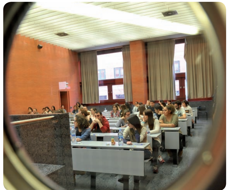
Aspirantes EIR a punto de iniciar la prueba de acceso

El Ministerio de Sanidad ha convocado 968 plazas en toda España de las cuales, 960 corresponden al sector público, mientras que las ocho restantes serán del sector privado y se adjudicarán de la misma manera en ambas categorías. De las plazas propuestas 82 se han asignado en la Comunidad Valenciana.