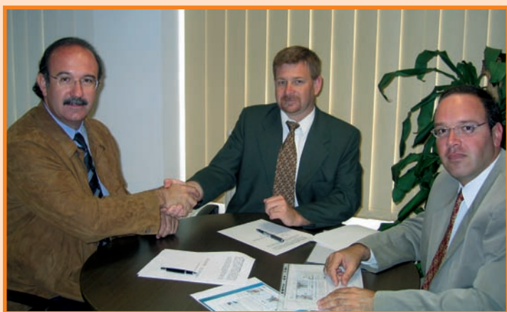
El presidente del CECOVA en el momento de la firma del convenio

El plazo estimado para el desarrollo del proyecto es de tres a cuatro meses, por lo que se espera que al próximo otoño se encuentre operativo