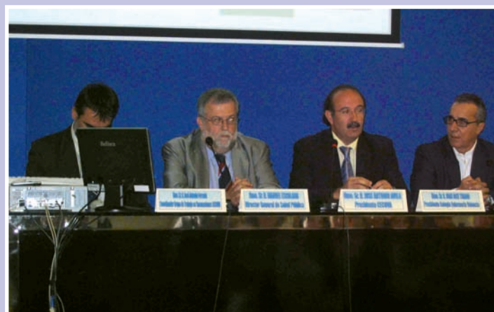
Imagen de la mesa inaugural en Valencia