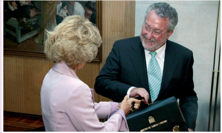
Elena Salgado entrega la cartera del Ministerio a Bernat Soria

"Mis puertas están abiertas a las ideas y a todas aquellas organizaciones que plantean propuestas de mejora de la salud y el bienestar de los ciudadanos", indicó Soria,