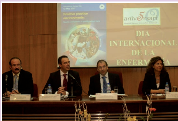
Imagen de la mesa durante el acto de bienvenida

Cada año y en honor de Florence Nightingale, se celebra el Día Internacional de la Enfermería en los más de 120 países cuyas Organizaciones Colegiales de Enfermería conforman el Consejo Internacional de Enfermería (CIE). Todos los años se utiliza esta jornada para divulgar un tema de interés relacionado con la profesión, este año el lema elegido ha sido "Entornos de prácticas favorables: Lugar de trabajo de calidad = Atención de calidad al paciente".