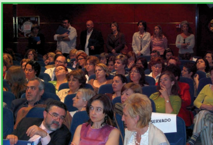
El público abarrotó el salón de actos de Ruralcaja

Blasco declaró en la Jornada que la consulta de Enfermería a demanda permitirá obtener cita en el mismo día con la enfermera, bien por iniciativa del usuario o por derivación de otros profesionales del Equipo de Atención Primaria