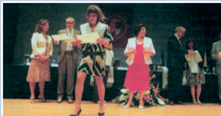
Una alumna en el momento de recoger su diploma