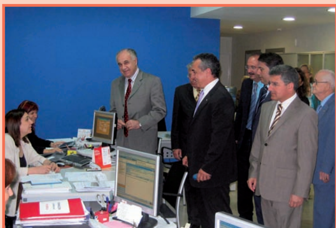
El Conseller en un momento de la visita a las nuevas instalaciones