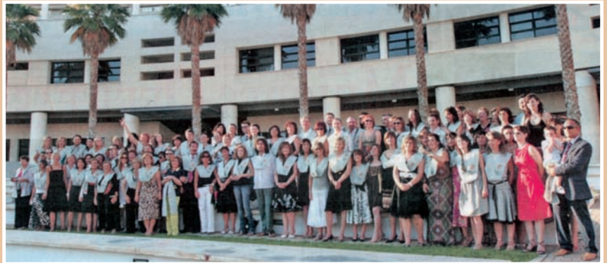
Imagen de los integrantes de la primera promoción

Desde el CECOVA felicitamos a la Escuela de Enfermería de la Universidad de Alicante y a quienes han hecho posible la realidad de esta titulación.