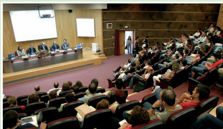
Las Jornadas contaron con una gran asistencia de profesionales de Enfermería

En dicho estudio, las conclusiones y resultados más relevantes fueron que uno de cada cinco efectos adversos se origina en la atención prehospitalaria; que las 3 causas inmediatas de los efectos adversos fueron relacionados con la medicación, infecciones nosocomiales y relacionados con problemas técnicos y que casi la mitad de los efectos adversos podían ser evitables.