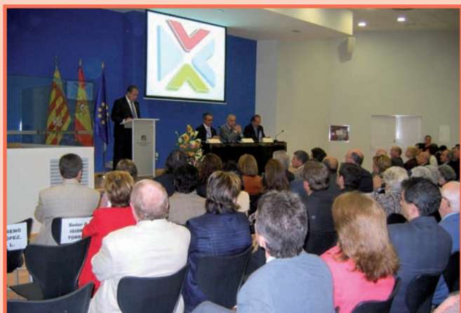
Imagen de un momento del acto inaugural

Las nuevas instalaciones cuentan con 1.300 metros cuadrados distribuidos en área administrativa, aulas para formación, biblioteca, sala de conferencias y salón de actos