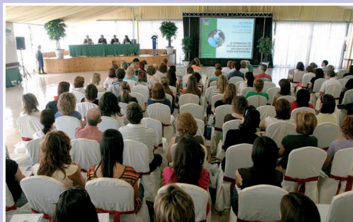
Tanto en Alicante (en la imagen) como en Castellón y Valencia las Jornadas fueron un éxito de público