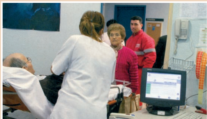
Como novedad cabe señalar la existencia de un permiso, por razón de violencia de género, para la mujer

En los últimos meses el personal estatutario que presta servicios en la sanidad pública y, por tanto el colectivo de Enfermería, se ha visto afectado por novedades legislativas de importante repercusión en el reconocimiento de sus derechos. Una de ellas ha sido la Ley 7/2007 del Estatuto Básico del Empleado Público, cuyo objeto es establecer las bases del régimen estatutario de los funcionarios públicos incluidos en su ámbito de aplicación así como determinar las normas aplicables al personal laboral al servicio de las administraciones públicas.