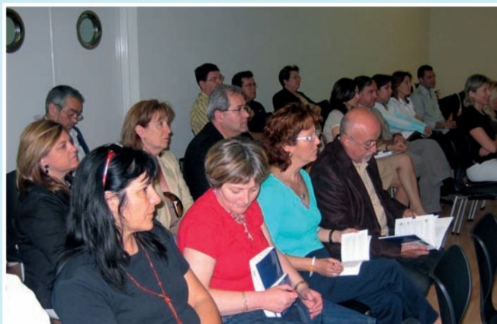
El acto congregó a una gran cantidad de asistentes

Las publicaciones presentadas suponen el fruto del trabajo realizado en el marco del Plan de Mejora de la Atención Domiciliaria 2004-2007 por un equipo de profesionales que han intentado estandarizar los diagnósticos, intervenciones y resultados enfermeros con tal de mejorar este tipo de asistencia. En realidad, el envejecimiento progresivo de la población, el aumento de enfermedades crónicas y del grado de dependencia, unido a un mayor número de enfermos en fase terminal, lleva a plantearse este tipo de modalidad asistencial que permite a estos pacientes recibir atención sanitaria en sus propios domicilios.