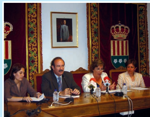
En la imagen, un momento de la presentación de los resultados del estudio

El formulario se repartió a 543 alumnos de los 3 colegios de Mutxamel en edades comprendidas entre 8 y 12 años correspondientes a los cursos de 3º, 4º, 5º y 6º de Educación Primaria.