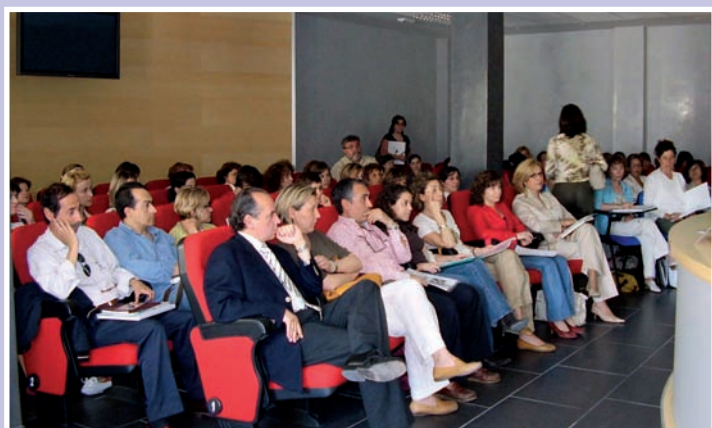
Las Jornadas en Castellón tuvieron también un amplio seguimiento

del herpes zóster, su incidencia en la edad y morbilidad en la edad adulta, las complicaciones y pérdida de calidad de vida que produce y la posible alternativa de utilización de esta vacuna que se espera esté disponible en el período de un año, para prevenir esta grave alteración.