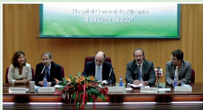
Imagen de la mesa en el acto inaugural de las Jornadas