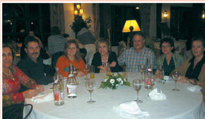
Parte de los compañeros de la Comunidad Valenciana que asistieron a las Jornadas

El CECOVA dio a conocer los resultados del proyecto piloto "Prevención del Riesgo Biológico en Profesionales de Sanitarios de la Comunidad Valenciana"