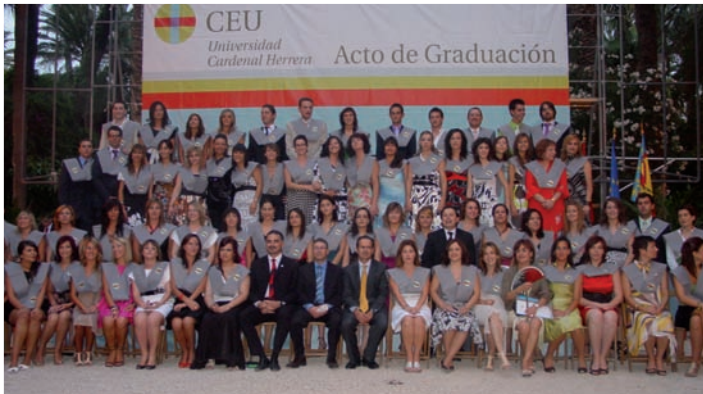
Imagen de los integrantes de la segunda promoción de Enfermería de la Universidad CEU Cardenal Herrera de Elche