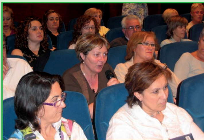
Los asistentes participaron de forma activa durante toda la Jornada