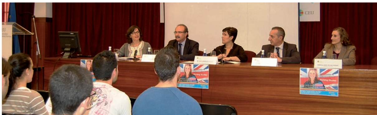
Representantes colegiales y universitarios en la presentación de la jornada

La Facultad de Ciencias de la Salud de la Universidad CEU Cardenal Herrera presentó, en el transcurso de la Jornada Oportunidades de Internacionalización en Enfermería: Nursing Studies, el nuevo Grado de Enfermería en inglés, que se podrá cursar a partir del próximo curso 2013/2014.