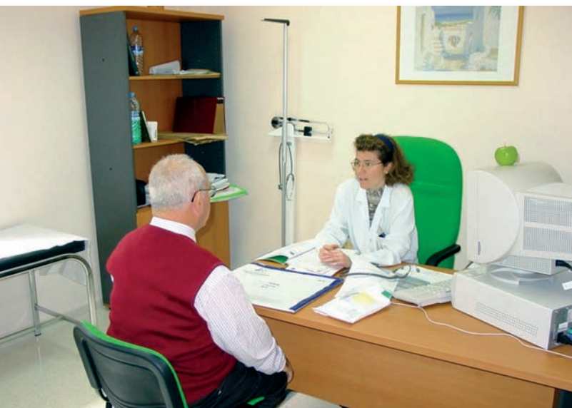
Una enfermera de Atención Primaria atiende a un paciente

El CECOVA expresó su respaldo al posicionamiento de la Asociación de Enfermería Comunitaria (AEC) sobre “la necesidad de invertir para que no se desaprovechen los recursos destinados a la formación de especialidades de Enfermería”. También la Federación de Asociaciones de Enfermería Comunitaria y de Atención Primaria (FAECAP) realizó una petición similar.