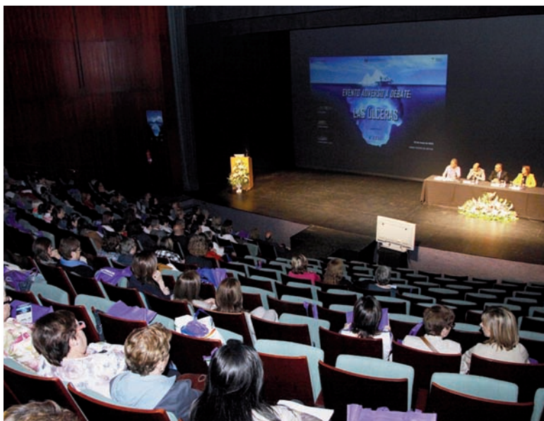
Imagen del Gran Teatre de Xàtiva durante el acto inaugural

Los objetivos del encuentro fueron “conocer la trascendencia y el impacto de las UPP como evento adverso derivado de los profesionales sanitarios, y, al mismo tiempo, buscar la mejora de la calidad registrando aquellos acontecimientos que recojan información sobre prácticas que