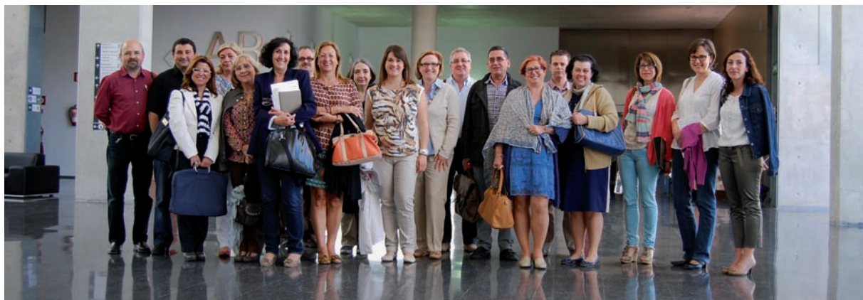
Foto de familia de los asistentes a la reunión celebrada en el Hospital Marina Salud

Supervisores de Enfermería de los servicios de Urgencias de los 24 departamentos de Salud de la Comunidad Valenciana mantendrán reuniones periódicas para poner en común distintos aspectos organizativos e introducir elementos de mejora. La primera reunión tuvo lugar en el Hospital Lluís Alcanyís de Xàtiva (Valencia) y la segunda se celebró en el Hospital Marina Salud de Dénia (Alicante).