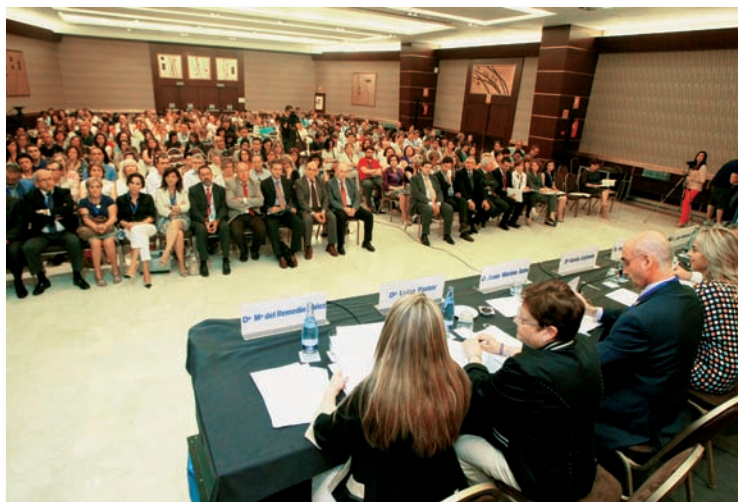
500 enfermeras gestoras procedentes de las 17 comunidades autónomas de España participaron en el evento

Las 140 comunicaciones y 60 posters sirvieron para demostrar que las enfermeras gestoras pueden contribuir a asegurar la sostenibilidad del sistema sanitario