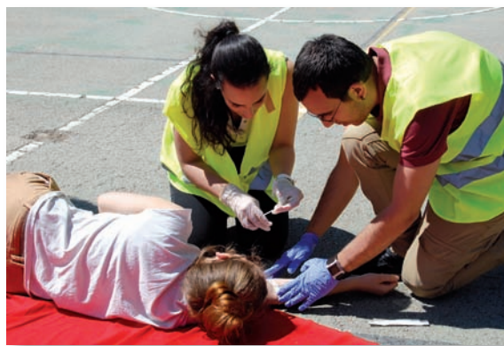
Estudiantes del Grado de Enfermería durante un simulacro de atención a víctimas

Finalmente, concluye que “tanto la Comunidad Valenciana como España tienen una sanidad pública excesivamente medicalizada” y argumenta que “es necesario, a nuestro entender, un cambio de orientación de un Sistema Nacional de Salud (SNS), muy centrado en la enfermedad aguda, para hacer frente, entre otras cuestiones, al reto de la cronicidad”. Para ello, “es urgente incrementar el número de enfermeras, así como un rediseño de las políticas de salud y las estrategias sanitarias, solo así se estarán dando pasos hacia la sostenibilidad de nuestro Sistema de Salud”, asegura.