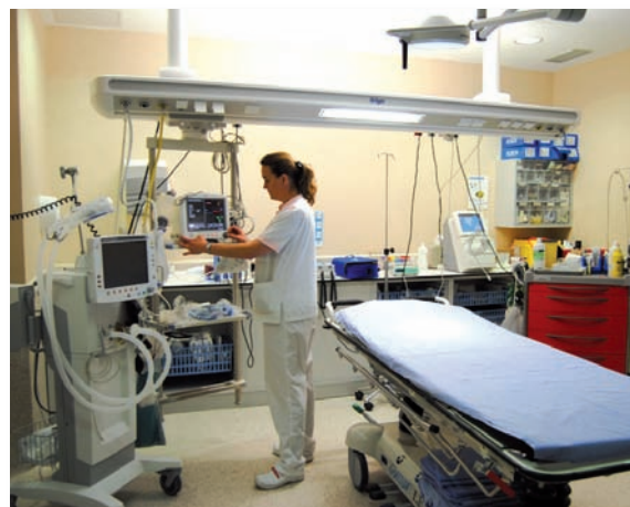
Una enfermera supervisa los equipos de Urgencias

Las funciones de la Comisión serán "la elaboración de la propuesta del mencionado Plan Estratégico, y, posteriormente, desarrollar, coordinar y evaluar las actuaciones necesarias para la ejecución de éste".