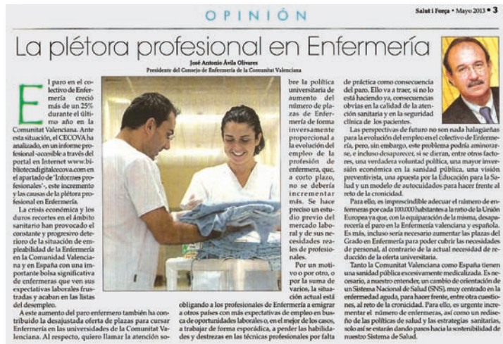
Reproducción del artículo en la publicación Salut i Força