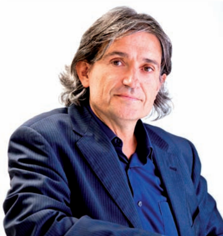
El periodista y escritor Carles Capdevila abrirá el IV Congreso

Además, una quinta mesa redonda infantil, titulada Los niños también opinamos de nuestra enfermera escolar , servirá para exponer diferentes trabajos sobre la visión del alumnado respecto a la labor desarrollada por los profesionales de Enfermería Escolar.