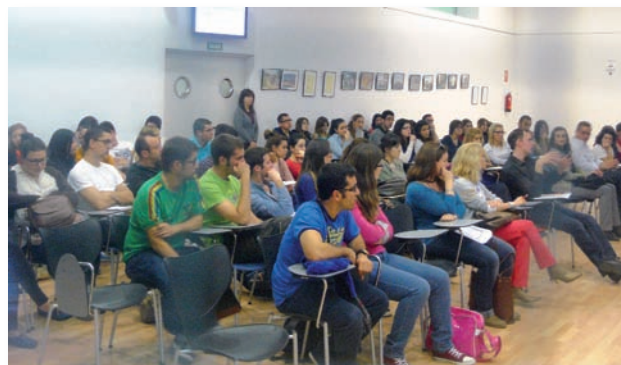
Asistentes a la charla informativa en el Colegio de Valencia

La empresa IGM Personal Recruitment, especializada en la búsqueda y selección de personal sanitario para el extranjero, celebró una charla en el Colegio de Enfermería de Valencia sobre ofertas de trabajo para enfermeras en Noruega, Inglaterra y Alemania.