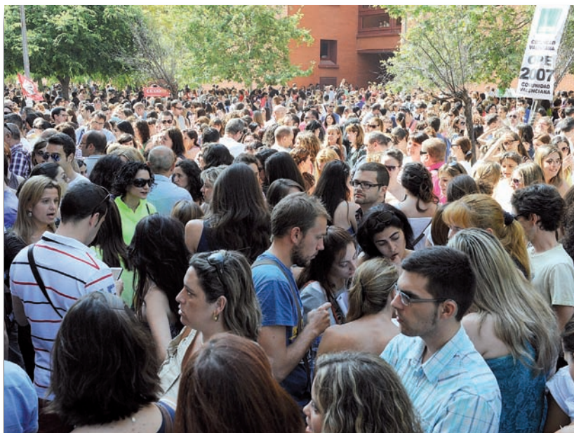
Parte de los miles de participantes en la prueba, antes de su inicio

Ésta fue una medida más que de las que se sumó a las puestas en práctica anteriormente desde la Organización Colegial de Enfermería de la Comunidad Valenciana, que se volcó ofreciendo información sobre la prueba, facilitó el desplazamiento a la misma con 9 autobuses, instó a Sanidad a variar las condiciones de realización y organizando un curso para su preparación. Cabe destacar que la Organización Colegial fue