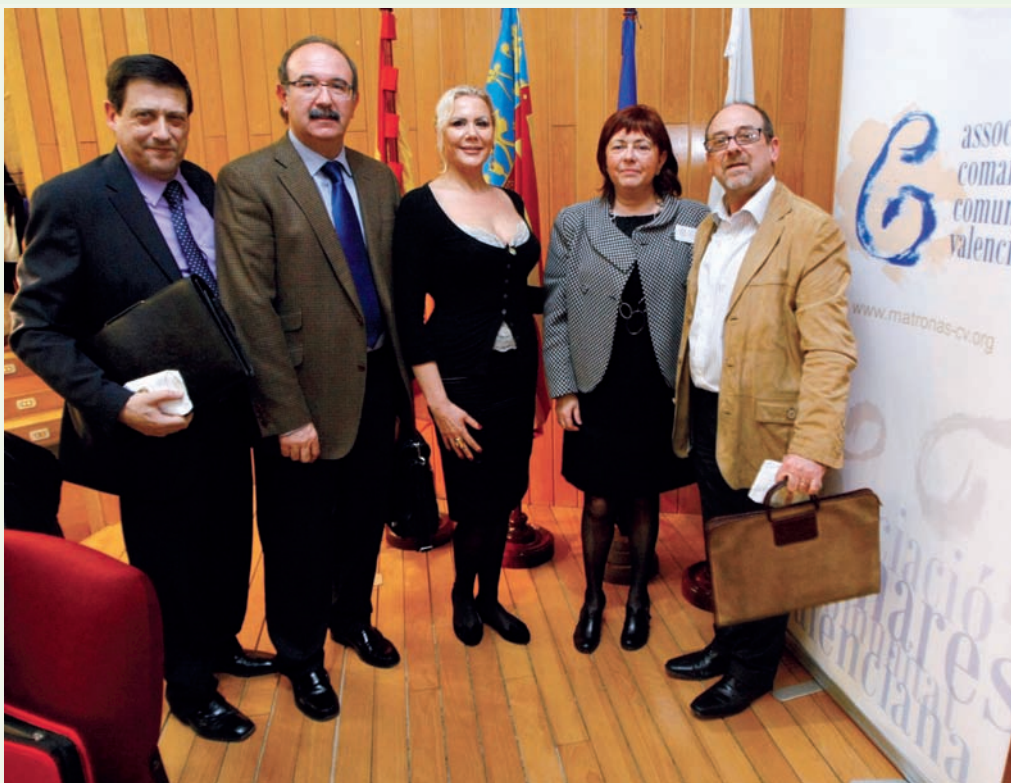
Representantes de las entidades que forman el grupo de trabajo

Tras la celebración de la Jornada este grupo ha mantenido diferentes reuniones de trabajo tras las cuales está