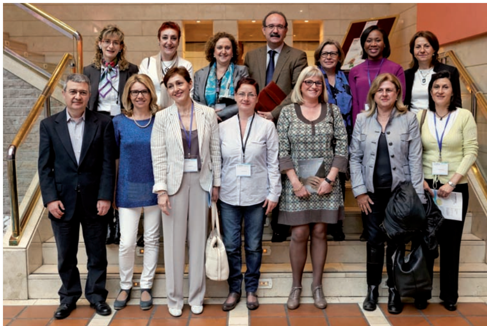
Foto de familia del Grupo de Enfermería de la SVR