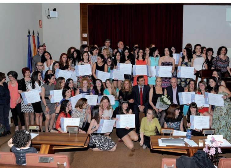
Foto de familia de la XIV promoción

La Unidad Docente de Matronas de la Comunidad Valenciana ha celebrado un año más los tradicionales actos de clausura, en este caso de la XIV promoción de enfermeras especialistas en Enfermería Obstétrico-Ginecológica, y de bienvenida, al alumnado de la XVI promoción, que cursará la especialidad de matrona durante los dos próximos cursos académicos.