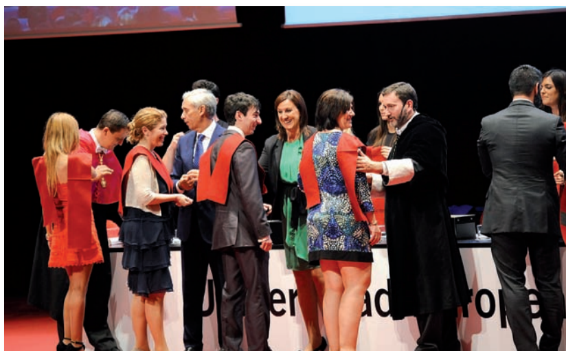
Acto de graduación de la promoción de Enfermería de la Universidad Europea de Valencia

La Universidad Europea de Valencia (UEV) ha graduado la única promoción del Grado de Enfermería de la Comunidad Valenciana durante el curso académico 2012/2013, ya que se adelantó a la implantación del proceso de Bolonia al resto de universidades, que graduarán a los primeros titulados de Enfermería con cuatro años de formación académica durante el próximo curso.