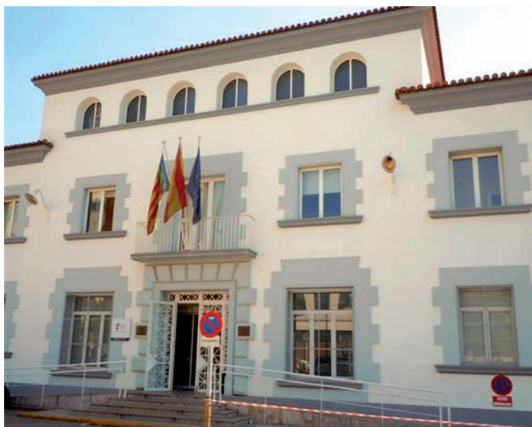
La EVES acoge la UDM de Enfermería Familiar y Comunitaria de la Comunidad Valenciana

El Gobierno ha publicado la Orden PRE/861/2013, de 9 de mayo, que establece los requisitos necesarios para la acreditación de Unidades Docentes Multiprofesionales (UDM) para la formación de esta especialidad de Enfermería Familiar y Comunitaria (EFyC) y en Medicina Familiar y Comunitaria (MFyC)