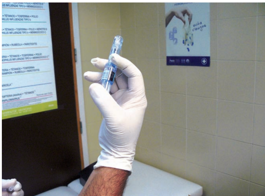
Un enfermero muestra una aguja con dispositivo antipinchazos

El plazo para la transposición a la legislación española de la directiva de la Unión Europea (UE) sobre Bioseguridad 2010/32/UE, que aplica el acuerdo marco para la prevención de las lesiones causadas por instrumentos cortantes y punzantes en el sector hospitalario y sanitario expiró el pasado día 11 de mayo, pero, sin embargo, se sigue demorando la incorporación de esta legislación al ordenamiento jurídico español.