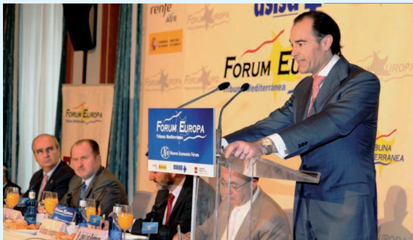
El conseller Manuel Llobart, durante la conferencia

El conseller de Sanidad, Manuel Llobart, aseguró, en una conferencia sobre el sistema sanitario de la Comunidad Valenciana pronunciada en un desayuno informativo del Fórum Europa-Tribuna Mediterránea, que “la gestión del Consell en materia sanitaria permite que podamos mantener una sanidad universal, gratuita, pública y de calidad. No vamos a gastar más de lo que tenemos, pero tampoco menos de lo que se necesita. La economía nunca estará por encima del paciente”.