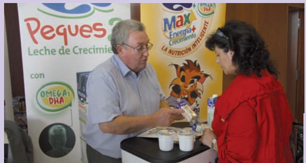
Un responsable del expositor de Puleva Salud, una de las empresas colaboradoras, conversa con una enfermera escolar

Destacó el éxito de participación de los congresistas en los seis talleres prácticos de carácter monográfico y totalmente gratuitos sobre temas relacionadas con Educación para la Salud y demandados por los propios profesionales de Enfermería Escolar