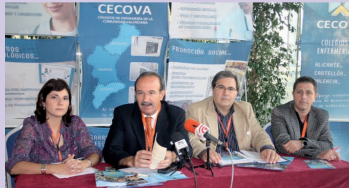
Imagen de la rueda de prensa previa al Congreso

También cabe destacar la cobertura realizada por la prensa de la comarca de La Safor, ya que el Congreso se desarrolló en un hotel de la playa de Gandía. En este sentido, la radio Onda Naranja-Cope Gandía, el portal Saforguia.com , las respectivas ediciones comarcales de los diarios Levante-EMV y de Las Provincias, así como los