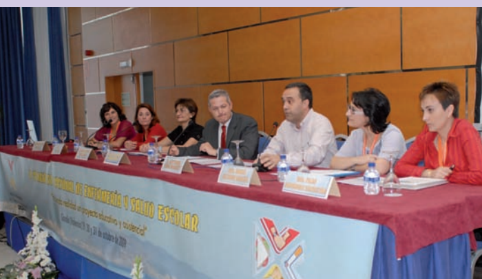
Ponentes de las mesas redondas 2 y 3 exponen las ventajas de la Enfermería Escolar

El II Congreso de Enfermería y Salud Escolar estructuró el programa científico a través de tres mesas redondas con expertos que analizaron el presente y las perspectivas de la Enfermería Escolar a través de la implantación en los centros de Educación Especial o del incremento de la demanda social.