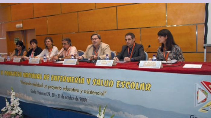
Mesa presidencial del Foro de Debate celebrado en Gandia