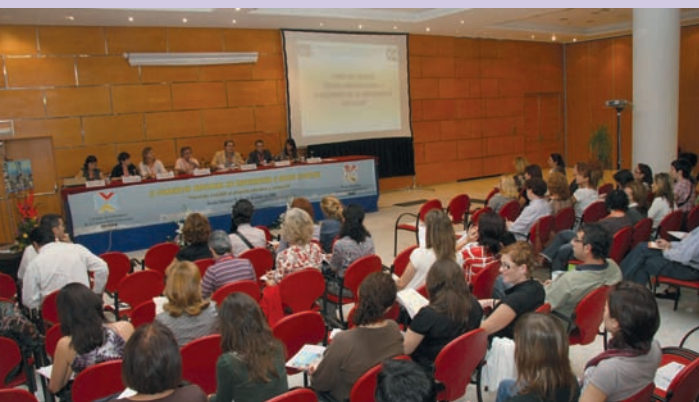
Imagen de los asistentes al Foro de Debate sobre Perfil Profesional y Funciones de la Enfermería Escolar