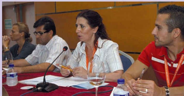
Castelló fue la encargada de moderar la mesa de comunicaciones número 1

Agrupación Mutual Aseguradora (AMA), la División de Nutrición de Puleva Salud y las revistas de divulgación sanitaria Ágora de Enfermería, Metas de Enfermería y Rol de Enfermería colaboraron estrechamente con el CECOVA en la celebración del Congreso.