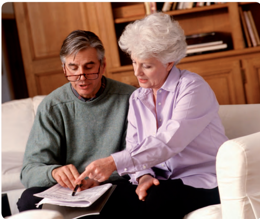
SE BUSCA UNA ATENCIÓN SANITARIA CENTRADA EN LA PREVENCIÓN Y EL PACIENTE CRÓNICO.

LOS EXPERTOS COINCIDEN EN LA NECESIDAD DE UN CAMBIO EN EL SISTEMA SANITARIO, DIRIGIDO AL CUIDADO DE LAS PERSONAS CON ENFERMEDADES CRÓNICAS Y A LA PREVENCIÓN, MATERIAS DE LAS QUE SE ENCARGA ENFERMERÍA