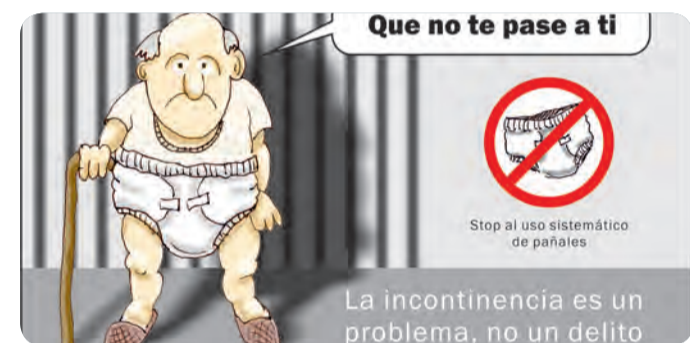
IMAGEN DE LA CAMPAÑA LANZADA POR EL COLEGIO DE ENFERMERÍA Y LA SALETA.

La campaña esta centrada en las personas dependientes y usuarios de centros geriátricos, al público en general, Enfermeros, médicos, fisioterapeutas y personal sanitario en general.