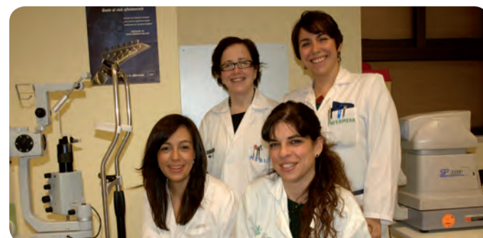
EQUIPO DE LA CONSULTA DE UVEÍTIS DEL HOSPITAL GENERAL DE VALENCIA.

La consulta es mensual y con horario vespertino. El equipo está formado por una profesional de Enfermería en oftalmología, una oftalmóloga y una reumatóloga que valoran tres tipos de pacientes. Los que presentan una uveítis de reciente diagnóstico, uveítis ya conocidas y pacientes con patología reumática y uveítis. Estos tres grupos reciben atención diferenciada.