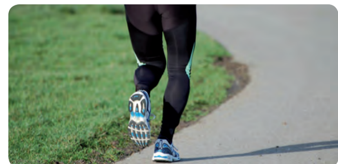
EL EJERCICIO FÍSICO ES UNA BUENA FORMA DE REDUCIR EL PESO.

Cabe recordar que la mejor forma de perder peso es el mantenimiento de hábitos saludables de forma continuada con hacer ejercicio físico moderado al menos media hora al día y la alimentación variada, que incluya realizar diariamente tres comidas principales que incluyan verduras y fibra, y dos tentempiés, recuerdan desde Enfermería.