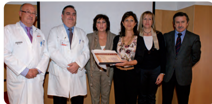
LA PRESIDENTA DEL COLEGIO DE ENFERMERÍA DE ALICANTE JUNTO A DOS MATRONAS.

naje, en el Día Internacional de la Mujer Trabajadora, a todas estas profesionales, cuya actividad es merecedora de ser recordada. Un documento interesante por la preocupación por la salud de las embarazadas y la "evidencia de que en 1923 existiera ya una organización colegial encargada de hacer valer los derechos del colectivo de matronas, en un ámbito sanitario, fuertemente dominado en aquella época por los hombres", recuerdan desde el consistorio.