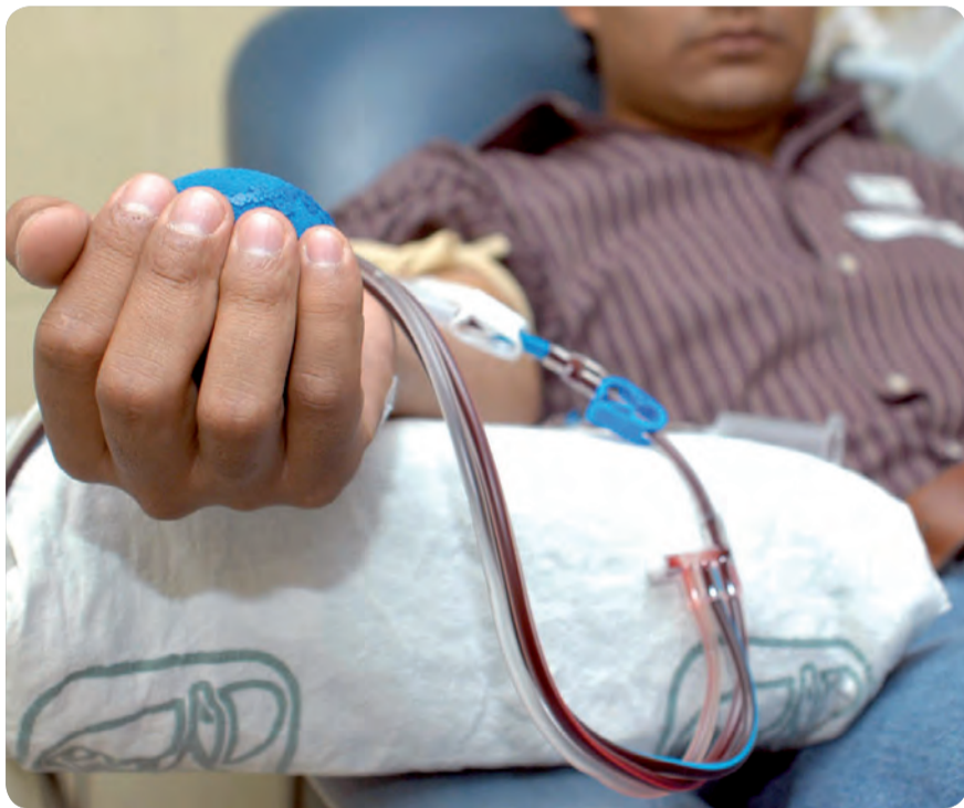
CON LA SANGRE DE UN DONANTE SE PUEDE SALVAR LA VIDA DE TRES PERSONAS..

LA FIDELIZACIÓN DE LOS DONANTES ES TAN IMPORTANTE COMO EL ACTO DE DONACIÓN. ENFERMERÍA SE ENCARGA EN GRAN PARTE DE ESTE COMETIDO