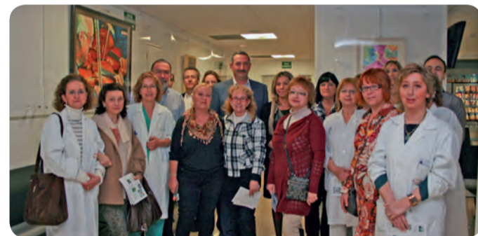
GRUPO DE ARTISTAS QUE EXPONEN EN ESTA NUEVA EDICIÓN DE SALUDARTE.

Monteolivete. Entre los artistas hay tres profesionales de Enfermería. Una forma de dar a conocer las obras de estos artistas y sanitarios así como hacer más llevadera la estancia de pacientes y familiares que pasan por urgencias.