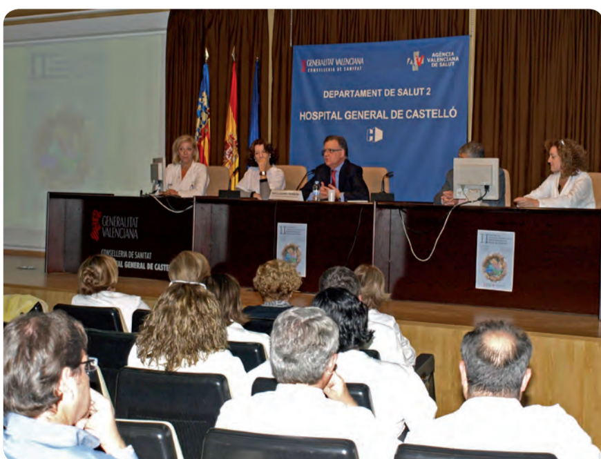
UN MOMENTO DE LA JORNADA QUE HA ACOGIDO EL HOSPITAL GENERAL DE CASTELLÓN.

Se estima que en la Comunitat 16.927 personas al año son susceptibles de necesitar cuidados paliativos. De ellos un 60% serían pacientes oncológicos y el 40% no oncológicos