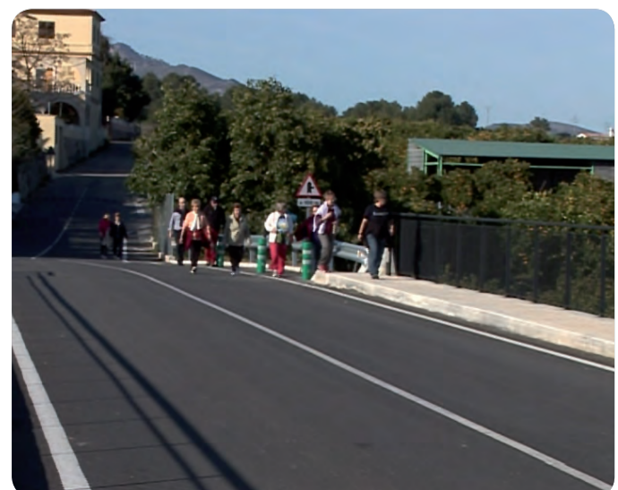
PRACTICAR DEPORTE Y LLEVAR UNA DIETA SALUDABLE SON ALGUNAS RECOMENDACIONES SANITARIAS.

Una forma de acercar la sanidad a la ciudadanía y de mejorar la salud de los mismos. Cabe recordar que el ejercicio es una de las recomendaciones sanitarias para prevenir enfermedades como las cardiovasculares, pero además de practicar deporte hay que llevar una alimentación saludable basada en la dieta mediterránea, evitar situaciones de estrés y abandonar el consumo de tabaco.