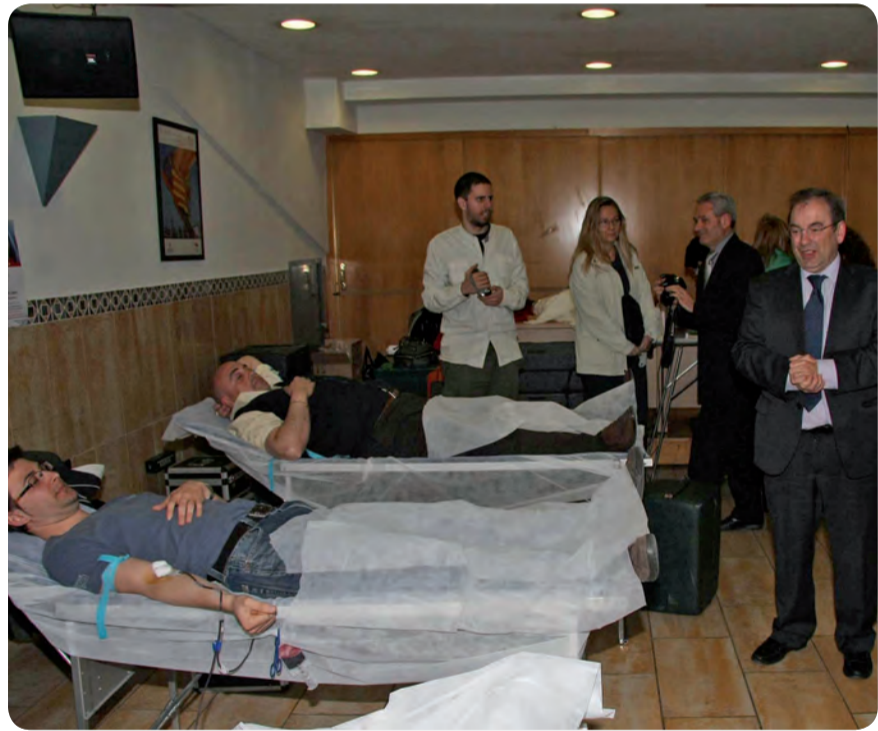
JORNADA DE DONACIÓN DE SANGRE CON EL VALENCIA BASKET CLUB EN LA FONTETA.

La sangre es sinónimo de vida y por eso ser donante es dar vida. Se trata de un acto altruista. Los expertos recuerdan que con la sangre de un donante se pueden salvar tres vidas y, a la vez, ayuda a controlar la salud del propio donante ya que antes de realizar la donación los profesionales sanitarios realizan una toma de muestras y una serie de preguntas que ayudan a conocer el estado de la persona que va a donar y si ésta cumple los requisitos para hacerlo. Los mismos son ser mayor de 18 años, y pesar más de 50 kilos. Las mujeres pueden donar hasta 3 veces al año y hasta 4 veces los hombres.