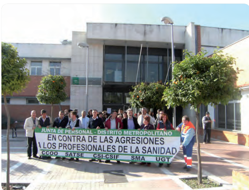
CONCENTRACIÓN FRENTE A UN CENTRO DE SALUD POR UNA AGRESIÓN.

"Los ataques a los profesionales de Enfermería deben ser considerados judicialmente como una agresión a la autoridad, que conlleva una pena de prisión de hasta tres años y no como una simple falta como sucede ahora"