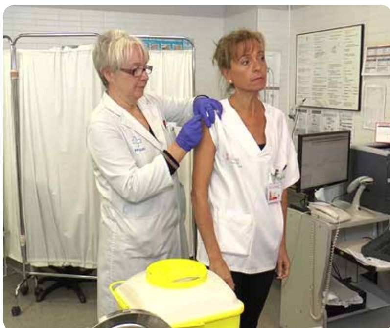
Momento de la vacuna antigripal al personal sanitario

Una campaña que estará hasta el 31 de enero de 2019.