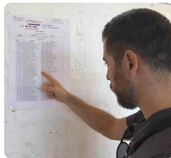
El examen se celebrará el próximo 2 de febrero

Todos los aspirantes interesados pueden obtener más información personalizada sobre su situación actual a través de la página del Ministerio de Sanidad introduciendo su número de identificación con el que presentó su instancia.