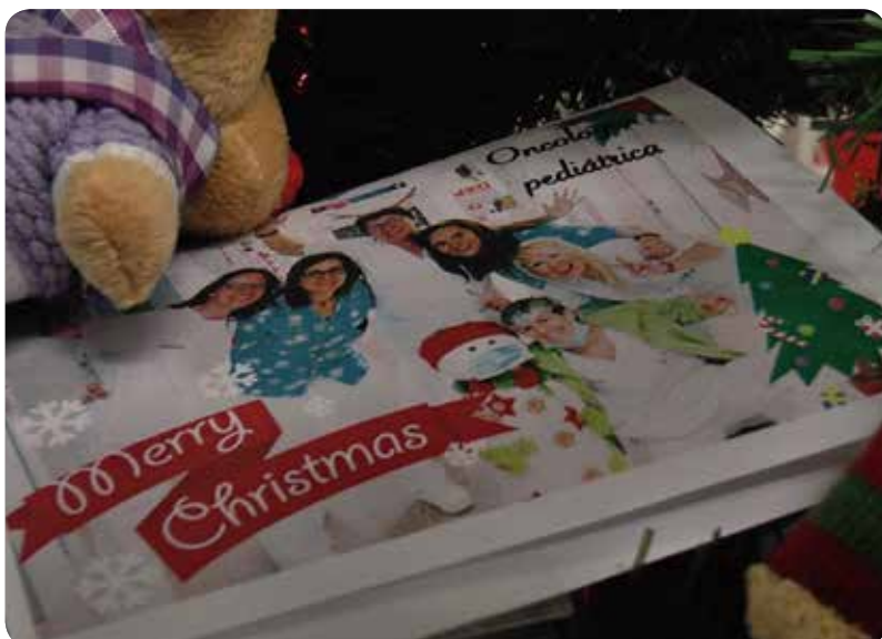
Unidad de Oncología Pediátrica del Hospital La Fe de Valencia

Además, apunta que "la atención sanitaria, cada vez, es mucho más compleja, más demandante y, por ello, en el siglo XXI nos encontramos ante un gran desafío de cómo se programe y se organice la atención sanitaria en este momento, la dotación adecuada de recursos humanos en todos los segmentos de esta atención dependerá el que podamos conseguir mejorar esa tasa de curación o no".