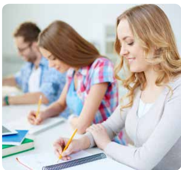
El CECOVA recuerda la carencia de enfermeras en la Comunitat Valenciana

EL CONSEJO DE ENFERMERÍA HAN VALORADO POSITIVAMENTE EL NÚMERO DE PLAZAS INCLUIDAS EN LA OPE DE 2018