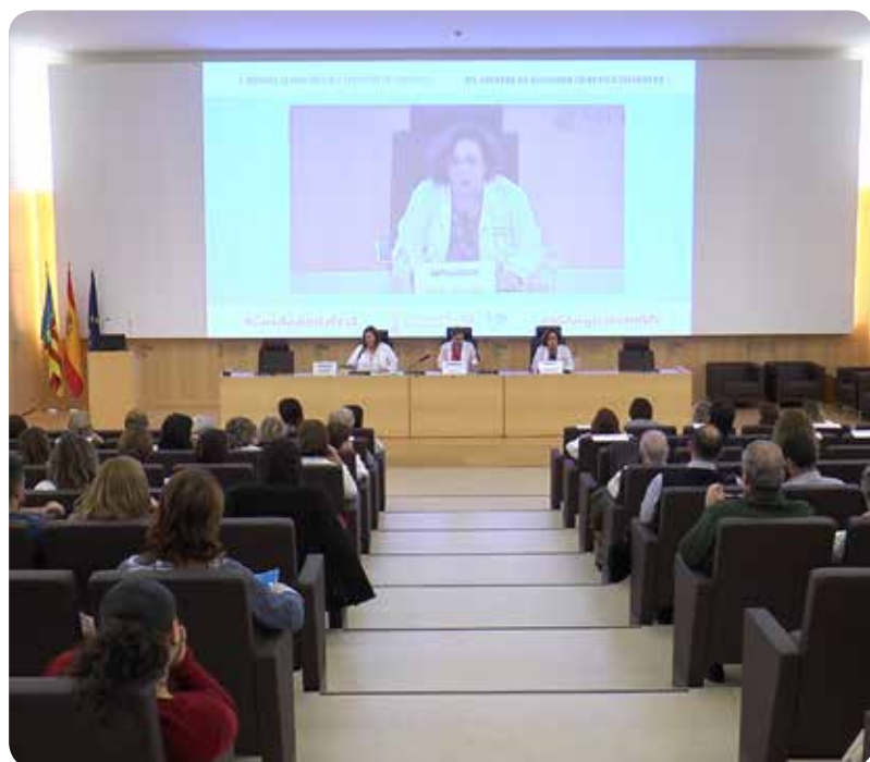
Momento de la jornada en el salón de actos del Hospital La Fe

ESTA CAMPAÑA CUENTA CON LA PARTICIPACIÓN DEL CECOVA JUNTO A LA CONSELLERIA DE SANIDAD UNIVERSAL Y SALUD PÚBLICA