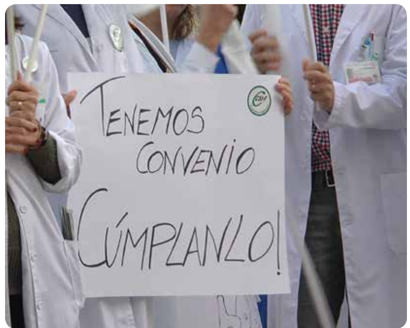
"Tenemos convenio, cúmplanlo", fue uno de los carteles que mostraron los profesionales

Bajo el lema "Tenemos convenio ¡cúmplanlo!" o "Readmisión de los despedidos, ¡ya!", las puertas del Hospital de La Ribera, en Alzira, fue escenario el pasado miércoles 19 de diciembre para la concentración de su personal sanitario.