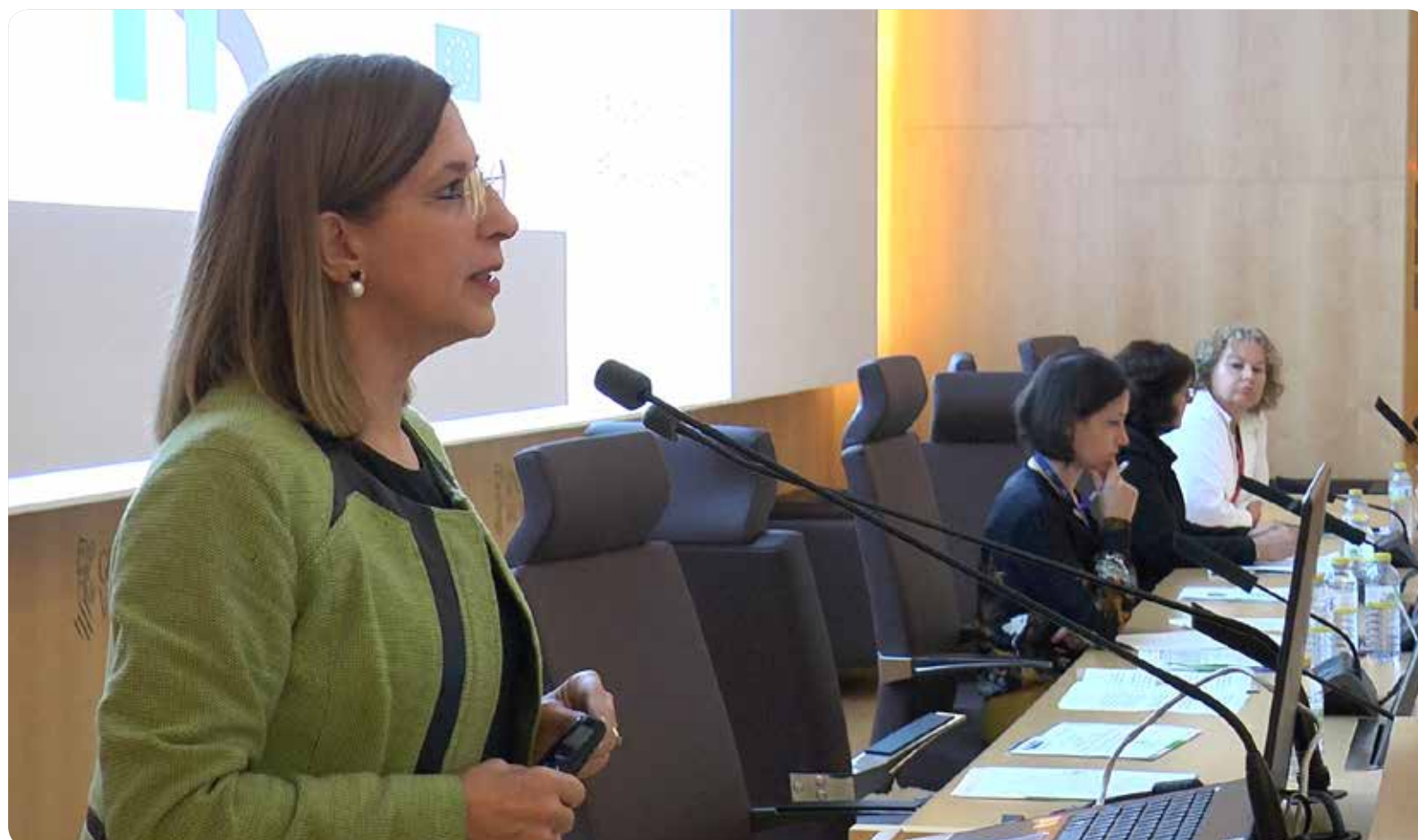
El CEOVA participa en esta campaña junto a la Conselleria de Sanidad Universal y Salud Pública

DIRIGIDO A USUARIOS DE LA SANIDAD DE LA COMUNIDAD VALENCIANA