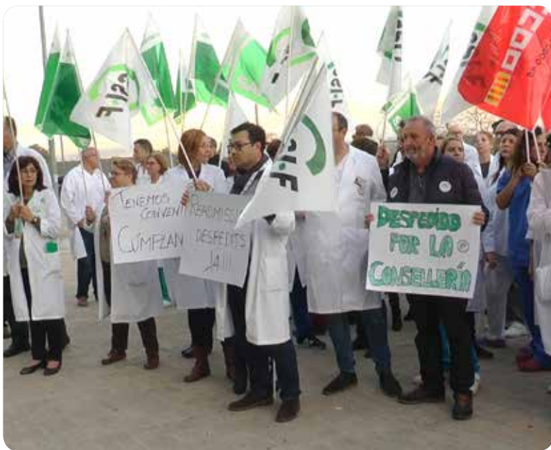
Personal sanitario durante la concentración en las puertas del Hospital La Ribera

"TENEMOS CONVENIO CÚMPLANLO" O "READMISIÓN DE LOS DESPEDIDOS YA" FUERON ALGUNOS DE LOS PUNTOS SOLICITADOS EN LA CONCENTRACIÓN