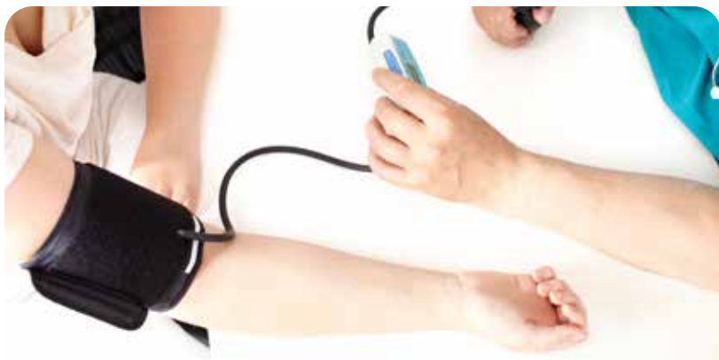
Medición de la presión arterial en la consulta enfermera

Por último, Pimenta hace hincapié en controlarse la presión en el domicilio a la espera de poder volver a realizar las visitas periódicas a la consulta enfermera "prestando especial atención a síntomas de emergencia hipertensiva como dolor de cabeza intenso, visión borrosa, náuseas o vómitos. Si aparecieran estos síntomas sigue las instrucciones del 112 antes de acudir a un centro sanitario"