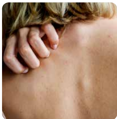
Los nuevos síntomas en la piel

La última incorporación a este compendio sintomatológico es la conjuntivitis o la sensación de tener un cuerpo extraño dentro del ojo y que ha manifestado muchos de los pacientes que han dado positivo en coronavirus.