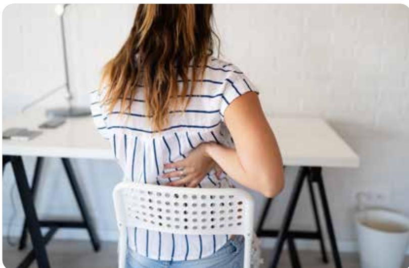
Lo más importante, mantener las medidas de seguridad

ras. Añade que se aumente “la ingesta de fibra, el aporte de frutas y alimentos ricos en Omega 3” según recoge la Arthritis Foundation, 2020. Al mismo tiempo enfatiza en la importancia de moverse, de realizar ejercicio físico, preferentemente por la mañana para permanecer activo durante el resto del día así como evitar el sedentarismo, no permanecer más de dos horas tumbado o sentado y andar por la casa. Una buena manera de llevar a cabo estas pautas es establecer una rutina diaria de actividades cotidianas que implique todo aquello para lo que necesitaras tiempo y nunca podías hacer. Sarria propone curiosear “por internet tutoriales que pueden despertar tu creatividad” y matiza que es “importante diferenciar las actividades de entre semana y las de fin de semana, de esta manera se mantiene la rutina establecida hasta ahora” . Así como se le da importancia a la activación física, Sarria hace referencia también a la necesidad de un correcto descanso por el bien físico y mental por lo que sugiere al paciente que duerma lo que necesite siempre y cuando respete un mismo horario. A pesar de permanecer cerrado en casa y protegido, no deja de ser una situación que genera ansiedad y miedos lo que hace necesario normalizarlo y desconectar de la sobreinformación de estos días. Por último Sarria incide en el cumplimiento de las medidas de seguridad en caso de tener que salir a la calle.