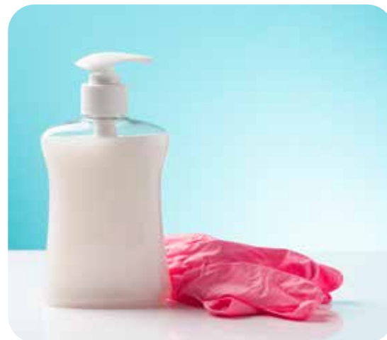
Dos elementos preventivos contra el Covid-19