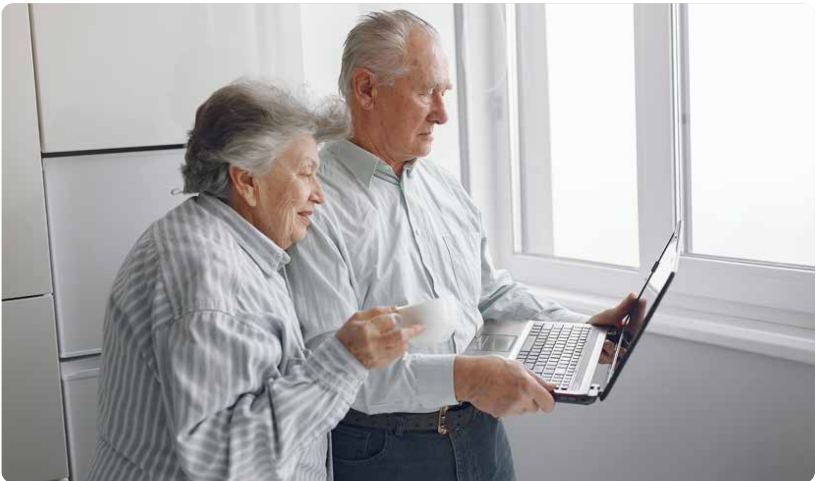
Muchos abuelos aprenden estos días sobre nuevas tecnologías para ver a sus nietos

DIRIGIDO A USUARIOS DE LA SANIDAD DE LA COMUNIDAD VALENCIANA