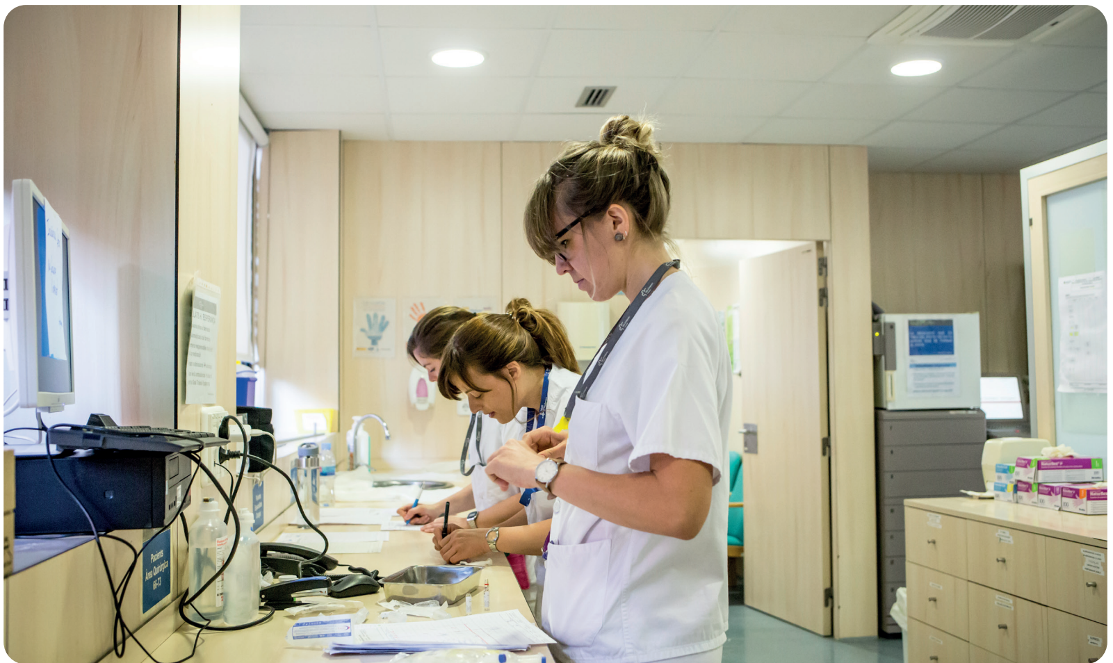
Fotos Banc Imatges Infermeres Autoría: Ariadna Creus y Ángel García

Periódico de la Organización Colegial de Enfermería de la Comunidad Valenciana Dirigido al alumnado del Grado de Enfermería