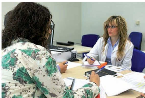
Cada departamento de Salud tendrá una unidad SAIP

La Generalitat garantiza la existencia de una unidad funcional de SAIP en cada departamento de Salud