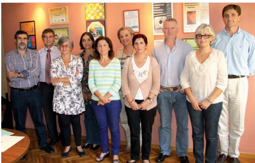
Foto de familia de la Comisión de Ética y Deontología del CECOVA

La Comisión de Ética y Deontología incluye entre sus funciones la recepción de las consultas relativas a la ética profesional, tanto a título individual como institucional, y la promoción de la formación de las enfermeras en el conocimiento y aplicación del Código y de la ética de Enfermería. También dará a conocer los principios éticos de la profesión enfermera a los pacientes, a los usuarios del sistema de salud y a los ciudadanos en general; y emitirá informes con recomendaciones sobre los aspectos éticos de la Enfermería. Del mismo modo, mantendrá y fomentará los contactos con órganos análogos de otras comunidades, países u organizaciones internacionales; y, finalmente, revisará cada cinco años el contenido del Código.