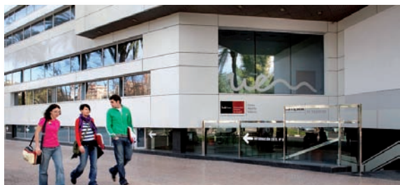
Sede de la UEM en Valencia

El CECOVA ha renovado el convenio de colaboración establecido con la Universidad Europea de Madrid (UEM) para facilitar el acceso a los colegiados de Enfermería de la Comunidad Valenciana y sus familiares directos que estén interesados en la oferta de Forma-