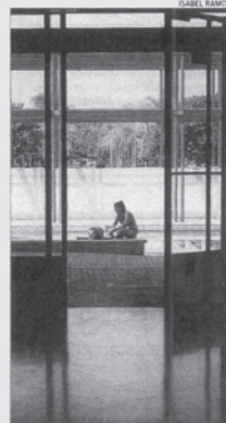
Campus de Alicante.

En los últimos meses dos informes de reconocida solvencia han aportado datos reveladores de la situación de la Universidad - universitarios y universidades - en la España de hoy. Los estudios (Informe de la Fundación Conocimiento y Desarrollo (CYD) y el de la Fundación BBVA), se infiere la necesidad de una planificación de la oferta universitaria acorde con la capacidad de inserción laboral que el mercado de trabajo ofrece a los nuevos graduados para cada una de las titulaciones. Y, en primer lugar, habrá que significar que esta planificación no va a hacer ni las universidades, ni los estudiantes y sus familias. Las veintitrés universidades privadas porque no van a reducir matriculaciones en las carreras que sean más solicitadas, por razones obvias. Y las cincuenta y dos públicas, actuarán cada una de ellas en función de las coordenadas que establezcan sus órganos rectores, en base a la autonomía plena que la ley les concede. Imposible el autocontrol en tan heterogéneo ámbito. Sin embargo es de sentido común que hacer dejación en asunto tan capital, supondría una grave irresponsabilidad, por parte de quien tiene el deber de poner fin los grandes dispendios que el Estado español no puede ni debe permitirse: el Gobierno de la Nación.