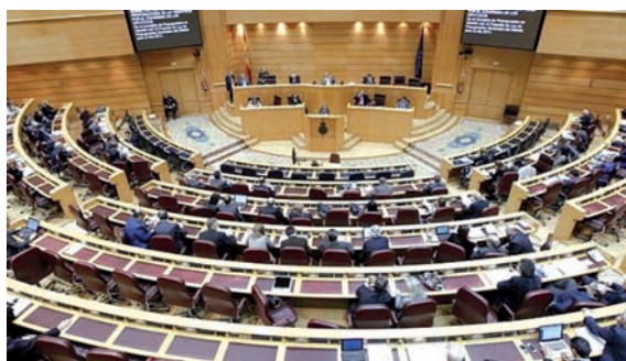
El pleno del Senado durante un debate parlamentario

Asimismo, la sentencia condena también al agresor con la prohibición de acercarse a una distancia inferior a 500 metros a ambas enfermeras, a sus domicilios, lugar de trabajo y a cualquier otro donde se encuentren, así como a establecer comunicación con ellas por cualquier medio durante seis meses.