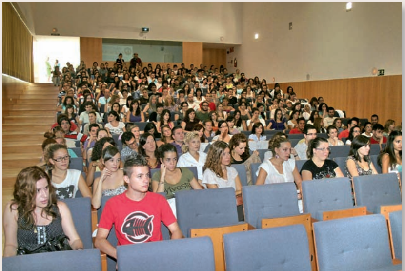
Imagen de una clase de los estudios de Enfermería

En el caso específico de la Comunidad Valenciana, las cifras que maneja Consejo de Enfermería de la Comunidad Valenciana (CECOVA) corroboran el desajuste a que venimos refiriéndonos. Así pues, el paro en el colectivo de enfermeras (25.000 profesionales en la actualidad) está creciendo a ritmo vertiginoso. La Enfermería ya no es la profesión con gran empleabilidad que era