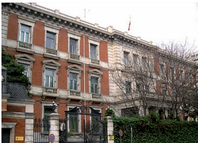
Ministerio de Hacienda y Administraciones Públicas

El vigente Reglamento del Impuesto sobre la Renta de las Personas Físicas, aprobado por el Real Decreto 439/2007, de 30 de marzo, establece que "procederá regularizar el tipo de retención (...) cuando en virtud de normas de carácter general (...) se produzcan durante el año variaciones en la cuantía de las retribuciones o de