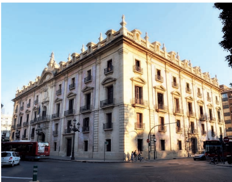
En la imagen, el Tribunal Superior de Justicia de la Comunidad Valenciana

Es importante señalar también que la sentencia enjuicia hechos de 2006, cuando la Ley 28/2009, (Ley del Medicamento) no había entrado en vigor. En 2006 podía mantenerse, aunque fuera formalmente, la vigencia del Estatuto de 1973 en cuanto regula las funciones del personal enfermero. Tras la entrada en vigor de la Ley 28/2009 no puede sancionarse a una enfermera por