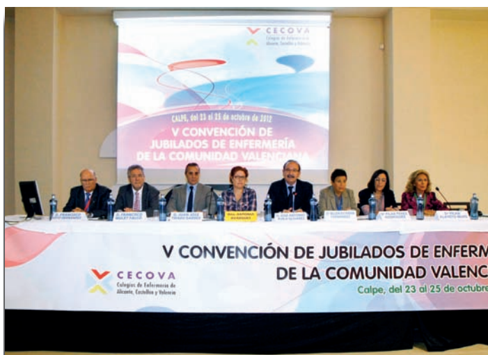
Mesa presidencial del acto de inauguración

Las asociaciones de jubilados de Enfermería de los tres colegios de la Comunidad Valenciana se dieron cita un año más en su convención anual, que en esta quinta edición se celebró en la localidad de Calpe (Alicante) con la asistencia de más de 150 enfermeras jubiladas y sus acompañantes.