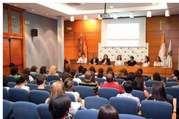
Inauguración del IV Máster Universitario en Especialización de Cuidados de Enfermería

El Máster ofrece la especialización en manejo del dolor, Urgencias, Oncología, Educación para la Salud y Enfermería Quirúrgica. Dirigido exclusivamente a titulados en Enfermería, la especialización en cuidados resulta necesaria para trabajar en unidades oncológicas, tanto de hospitalización como en hospitales de día de adultos y pediátricos; en servicios especiales de Urgencias y unidades SAMU; en áreas quirúrgicas especializadas, quirófanos y reanimación; y asimismo, en entornos de promoción y educación para la salud como colegios, asociaciones de pacientes e instituciones penitenciarias.