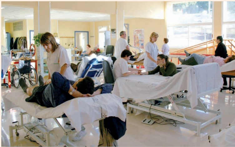
En las situaciones de IT derivada de contingencias profesionales la prestación reconocida por la Seguridad Social será complementada durante todo el período de duración de la misma

Los interesados en obtener más información al respecto pueden hacerlo a través de la sección de Informes Profesionales del nuevo espacio web de recortes www.recortesenfermeria.es