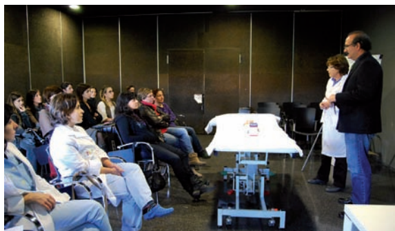
Imagen de uno de los seminarios en Denia

Además, nombra a tres delegados comarcales en estos departamentos de Salud para acercar y coordinar la actividad colegial en los mismos