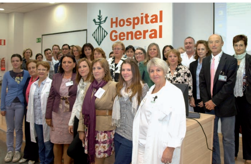
Foto de familia de los organizadores y participantes en la Jornada

La VII Jornada de Cuidados en Enfermería del Departamento Valencia-Hospital General, bajo el lema La investigación en Enfermería en el Departamento Valencia-Hospital General , reunió a cerca de 200 enfermeras. El presidente del CECOVA animó a aprovechar las posibilidades que ofrece la Estrategia I+C de la mano de la Fundación Index.