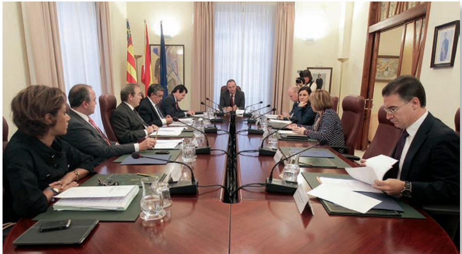
Reunión del pleno del Consell

El modelo que funcionará en 2013 se centra en la unificación de los contratos de servicios y logística y la conversión a tarifa plana de los contratos de servicios públicos de prestación sanitaria de carácter horizontal (transporte sanitario, ventiloterapia y terapia respiratoria, hemodiálisis y resonancias magnéticas). Además, se proporcionarán a los equipos directivos las herramientas necesarias para detectar y solucionar las áreas de ineficiencia en la gestión.