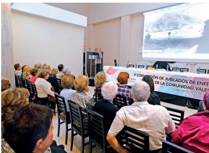
Charlas y actuaciones formaron parte del programa de actividades