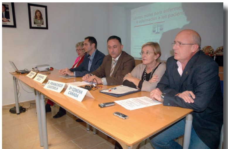
Imagen de los integrantes de la mesa

El Colegio de Enfermería de Alicante acogió la mesa redonda “La información enfermera-paciente: ¿cuestión de límites?”, actividad organizada por el CECOVA a través de su Grupo de Trabajo de Ética y Deontología y cuya organización vino dada por la necesidad para un importante número de profesionales de Enfermería de responder a la cuestión planteada en su título.