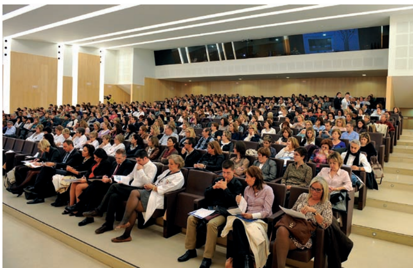
El salón de actos de La Fe, a rebozar de asistentes durante la I Jornada Autonómica

La Conselleria de Sanidad organizó la I Jornada Autonómica de Enfermería de la Comunidad Valenciana bajo el lema “La sostenibilidad del sistema sanitario bajo la mirada de Enfermería” para reconocer la contribución del colectivo de Enfermería en la sostenibilidad del sistema sanitario.