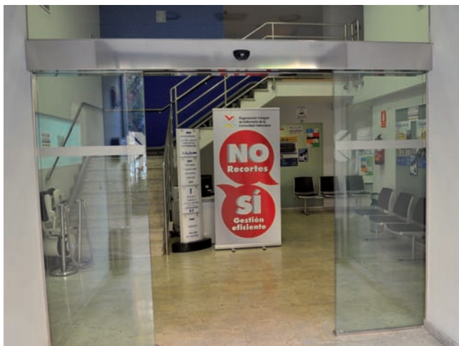
Imagen del roll-up que se ha instalado en el Colegio de Enfermería de Valencia

La campaña de la Organización Colegial de Enfermería de la Comunidad Valenciana pide mejorar la gestión del sistema sanitario público para hacerlo rentable sin necesidad de recurrir a otras medidas de ajuste