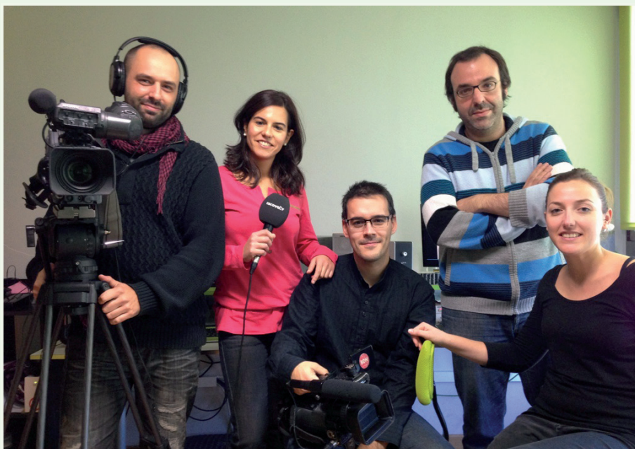
Foto de familia del equipo humano de CECOVA.TV

Entrevistas y ponencias, campañas de publicidad, agenda e Informativos completan los canales que componen la televisión por Internet de la Enfermería de la Comunidad Valenciana. Sin olvidarnos de las medidas de recorte nacionales y autonómicas, las protestas y reivindicaciones de los profesionales. La cobertura de cada una de las acciones llevadas a cabo por la Ad-