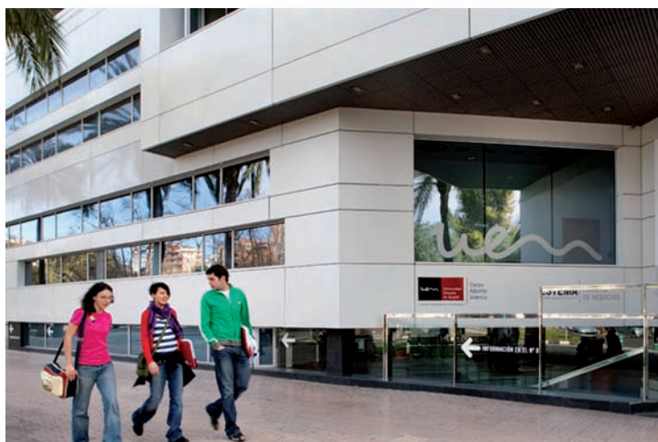
Fachada de la sede de la UEV

El pleno de Les Corts Valencianes ha aprobado, por los votos a favor del PP y en contra de la oposición, la ley de reconocimiento de la Universidad Europea de Valencia (UEV) como universidad privada integrada en el Sistema Universitario Valenciano para impartir enseñanzas de carácter oficial.