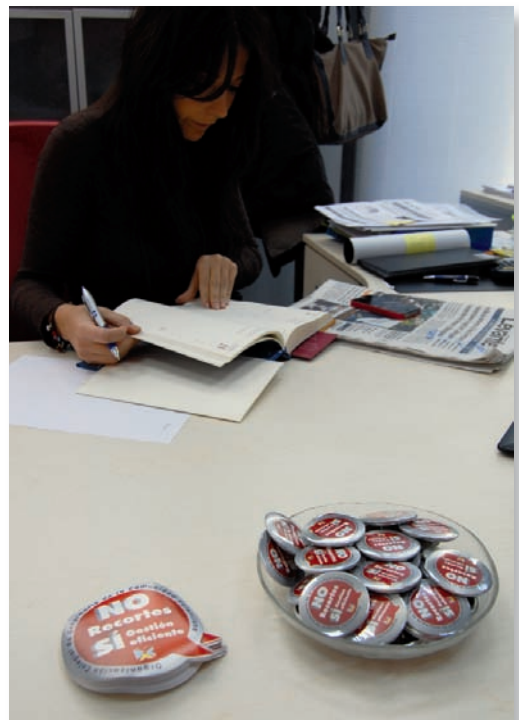
Imagen de las chapas y pegatinas en el Colegio de Enfermería de Castellón

Con ellos se quiere reforzar lo ya expresado en diferentes momentos de las protestas de la Organización Colegial de Enfermería de la Comunidad Valenciana en el sentido de mejorar la gestión del sistema sanitario público para hacerlo rentable sin necesidad de recurrir a otras medidas de ajuste y de arbitrar un sistema de financiación adecuado para dotar de recursos económicos suficientes para garantizar la sostenibilidad del sistema.