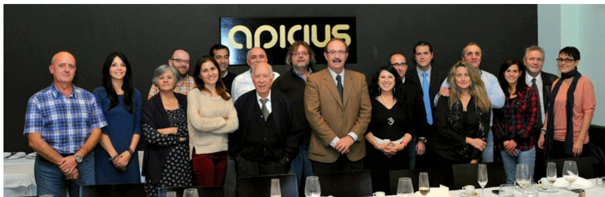
Miembros del CECOVA y de los medios de comunicación compartieron el tradicional encuentro navideño

El Consejo de Enfermería de la Comunidad Valenciana (CECOVA) celebró su tradicional encuentro con los medios de comunicación con un acto en el que los representantes de la entidad colegial trasladaron a éstos su preocupación por el incremento interanual de un 54,42 por ciento en las cifras de desempleo de los profesionales de Enfermería en la Comunidad Valenciana, dos puntos por encima de la media estatal, que se sitúa en un 52,67 por ciento.