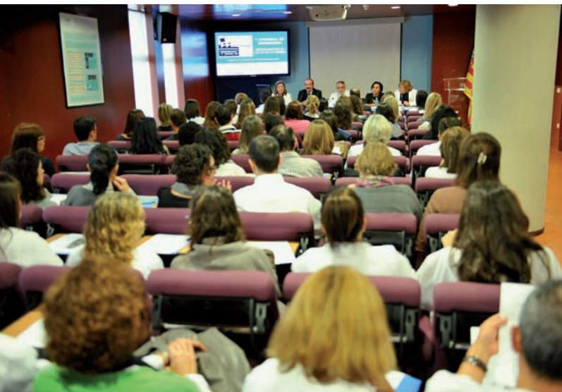
Acto inaugural de la X Jornada de Enfermería de La Ribera

El Departamento de Salud del Hospital Universitario de La Ribera celebró sus X Jornadas de Enfermería, en la que más de 200 profesionales sanitarios del Departamento de Salud de La Ribera debatieron sobre el futuro de los cuidados en Enfermería.