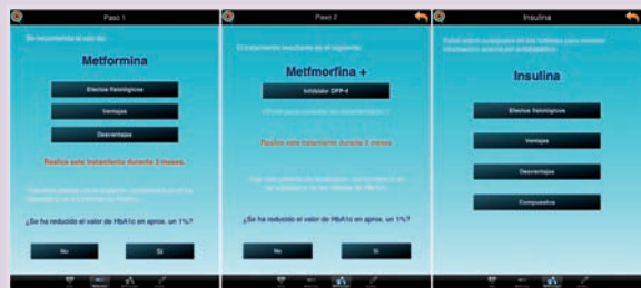
Imagen de la aplicación

La nueva aplicación está disponible en español, inglés, francés, alemán y portugués, tanto para teléfonos Apple como para Android, y puede descargarse tecleando Diabetes Pharma (en el Apple Store) o Diabetes Farma (en Google Play).