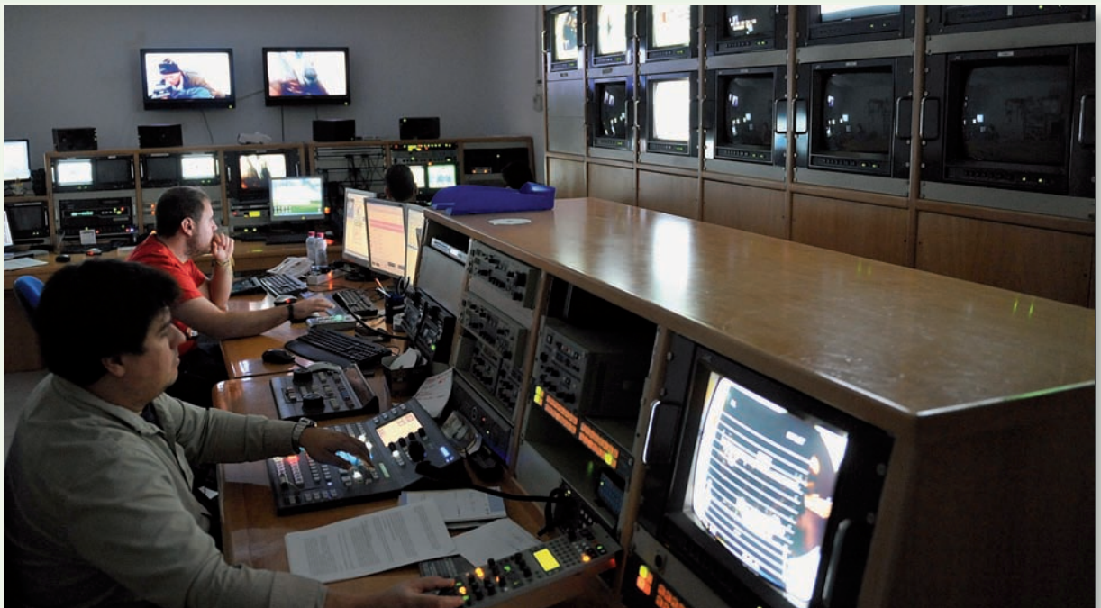
Estudios de CECOVA.TV durante la grabación de un informativo

CECOVA Televisión cumple tres años de emisiones. Durante este tiempo cámaras y periodistas de la primera televisión enfermera de España han cubierto más de un millar de noticias sobre Enfermería. Una información que contribuye a dar visibilidad a la labor diaria de las enfermeras en el sistema sanitario, para conseguir así un mayor reconocimiento y prestigio social.