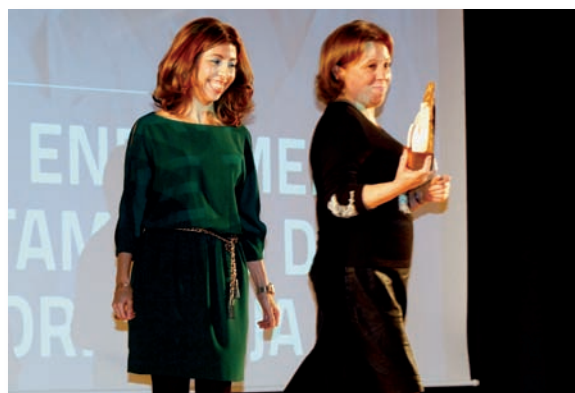
Premio Comunicación y Educación para la Salud, División de Enfermería del Departamento de Salud de Torrevieja

En él se entregaron un total de 19 premios para reconocer la labor y trayectoria de profesionales, departamentos, centros y diferentes iniciativas en lo que fue un merecido y necesario respaldo a su trabajo en unos momentos de crisis en los que este tipo de iniciativas vienen a ser un anímico oasis paliativo en el convulso contexto general.