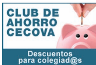
Banner del club de ahorro que puede hallarse en las webs colegiales

Posteriormente, para acceder a los descuentos y recibir periódicamente información de interés sobre promociones es necesario darse de alta en esta plataforma mediante la creación de un usuario facilitando el correo electrónico y el nombre, lo cual permitirá disfrutar de los descuentos, promociones y ofertas, así como también ofrecer una serie de invitaciones gratuitas a familiares o amigos.