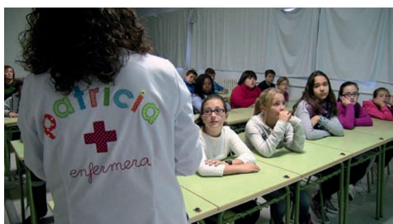
Un grupo de niños atiende a la enfermera escolar de Benicàssim

Los problemas de la vista se corrigen mejor cuando se detectan en la infancia. Los especialistas del Consorcio Hospitalario Provincial de Castellón y las enfermeras escolares de Benicàssim (Castellón) lo saben bien y, por ello, han organizado la sexta campaña de detección de ambliopía en los colegios de la localidad.