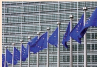
Sede de la Comisión Europea en Bruselas

El Programa Salud para el Crecimiento tiene por finalidad ayudar a los países de la UE a reaccionar con eficacia ante los retos económicos y demográficos que afrontan sus sistemas de salud.