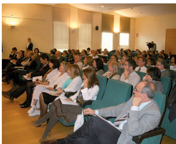
El salón de actos del Hospital de Elda, durante la Jornada

El Hospital General Universitario de Elda (Alicante) ha acogido una Jornada de Gestión Sanitaria en la que se han analizado los modelos de abordaje de la cronicidad que permiten asegurar la sostenibilidad del sistema sanitario de la Comunidad Valenciana.