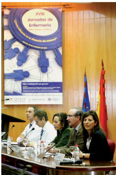
Mesa presidencial de apertura de las Jornadas