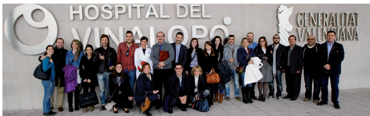
Foto de familia de los participantes en el I Encuentro de Enfermería Tecnológica y Redes Sociales

El Grupo de Enfermeros Expertos en Tecnologías de la Información y la Comunicación (NursTIC) del Colegio de Enfermería de Alicante y el CECOVA han celebrado en Hospital del Vinalopó de Elche el I Encuentro de Enfermería Tecnológica y Redes Sociales de la Comunidad Valenciana, que se centró en la utilidad de los avances tecnológicos en el trabajo de Enfermería.