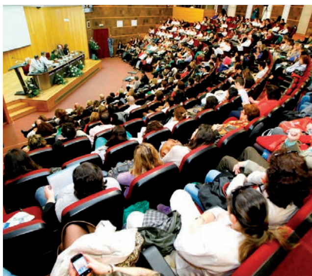
La asistencia fue un éxito, un año más

El apoyo a eventos profesionales que sirvan para desarrollar y promocionar la imagen de la Enfermería es objetivo prioritario de la Organización Colegial Autónoma de Enfermería, más aún en estos momentos de crisis económica en los que son más importantes que nunca.