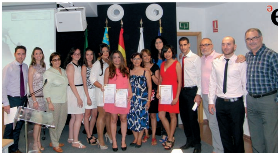
Foto de familia del profesorado y alumnado del III Máster en Enfermería en Emergencias Extrahospitalarias

El programa formativo va dirigido a profesionales titulados en Enfermería y Medicina interesados en el conocimiento en profundidad de las actuaciones en la atención sanitaria emergente tanto en el ámbito hospitalario como en el prehospitalario. Las enseñanzas teórico-prácticas se imparten de forma semipresencial, ya