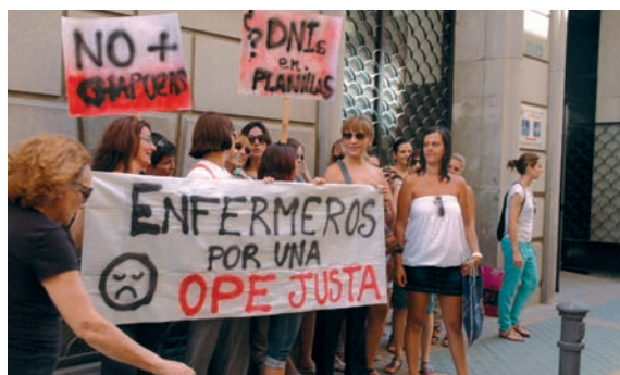
Manifestantes ante la dirección territorial de Sanidad en Alicante