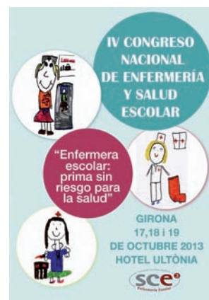
Cartel del IV Congreso

Representantes del mundo de la Enfermería Escolar de toda España se darán cita en el Hotel Ultònia de Girona en esta cuarta edición de la cita congresual que, por primera vez se celebra fuera de la Comunidad Valenciana, tras las ediciones celebradas en Villajoyosa, Gandia y Benicàssim en 2007, 2009 y 2011, respectivamente.