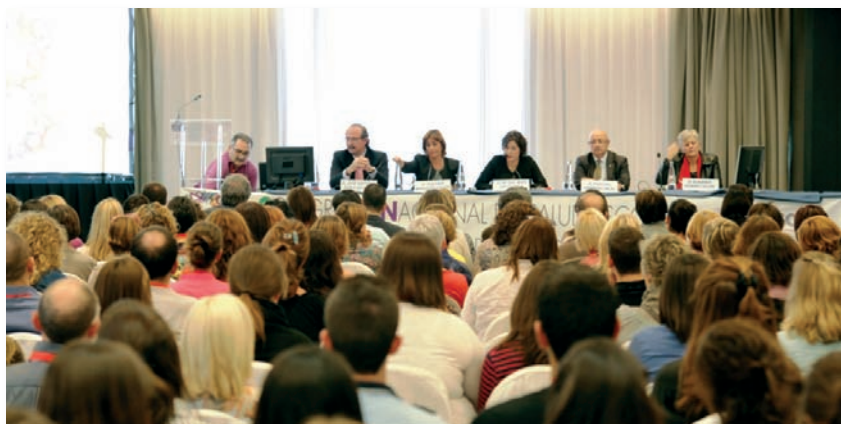
Mesa inaugural del III Congreso celebrado en Benicàssim

El IV Congreso Nacional de Enfermería y Salud Escolar, organizado por la Sociedad Científica Española de Enfermería Escolar (SCE3), tendrá lugar los próximos días 17, 18 y 19 de octubre en la ciudad de Girona bajo el lema Enfermera escolar: Sin prima de riesgo para la salud .