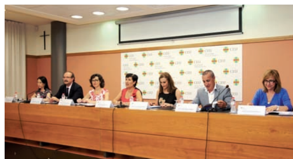
Mesa presidencial del acto de Aniversario 10+1 de Enfermería en la UCH-CEU

La Facultad de Ciencias de la Salud de la CEU-UCH ha incorporado en los últimos años a su oferta formativa para esta titulación el Doble Grado Fisioterapia + Enfermería. Además, junto al Máster de Especialización en Cuidados de Enfermería, que este año ha cumplido su IV edición, se han sumado los nuevos másteres de Enfermería Neonatal y Cuidados Intensivos Neonatales, el Título de Experto en Enfermería Escolar y el Curso de Especialización en Abordaje Terapéutico Multidisciplinar en Fibromialgia.