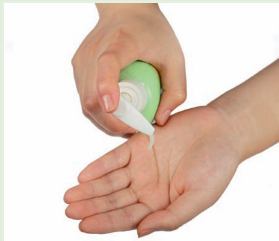
Lavado de manos

Financiada por el Instituto de Salud Carlos III, esta investigación contó con la participación de 214 profesionales sanitarios, que evaluaron el nivel de cumplimiento de la práctica de higiene de manos en consulta mediante observación directa por un profesional externo, al inicio del estudio y seis meses después de la intervención. Los resultados demostraron que los profesionales que habían recibido la intervención modal, aumentaron su nivel de cumplimiento de la higiene de manos respecto al grupo control. Según sus autores, este estudio ha demostrado la utilidad de una intervención multimodal para mejorar el cumplimiento de una correcta higiene de manos en el personal sanitario de AP.