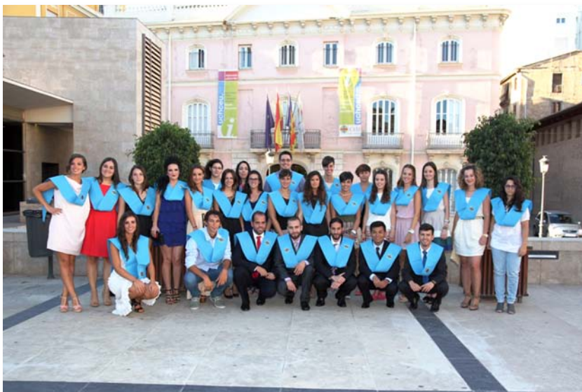
Foto de familia del alumnado de la cuarta edición del Máster de la CEU-UCH

El objetivo de este Seminario es sensibilizar a los profesionales de Enfermería de la importancia de la adopción