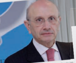
Varios Colegios Oficiales de Enfermería han criticado hoy a los de Valencia, Castellón, Baleares y Murcia, rechaza el borrador sobre medicamentos