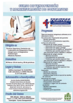
Cartel anunciador del curso de FESITESS

El Colegio de Enfermería de Alicante pidió que no se realizase e informó del mismo al Ministerio, a la Conselleria de Sanidad y al Ayuntamiento de Alicante, en uno de cuyos locales estaba prevista la celebración