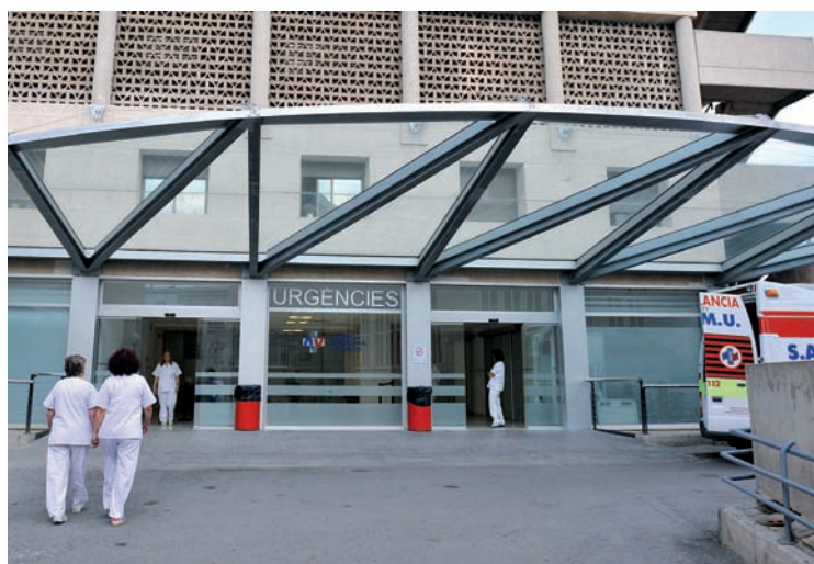
Servicio de Urgencias de un hospital de la Comunidad Valenciana

La atención en los servicios de Urgencias es otro de los aspectos reseñables ya que el uso no responsable