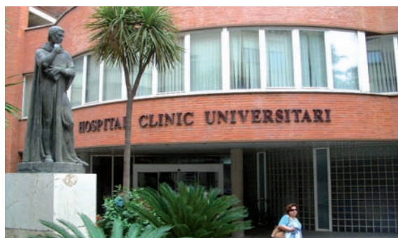
Entrada principal del Hospital Clínico Universitario de Valencia, donde se produjeron los hechos en el año 2005

Asimismo, el CECOVA salió en defensa de la "profesionalidad" del colectivo de Enfermería de la Comunidad Valenciana en general, a la vez que recordó el "enorme grado de responsabilidad" que conlleva el ejercicio de esta profesión; "responsabilidad que lamentablemente ha