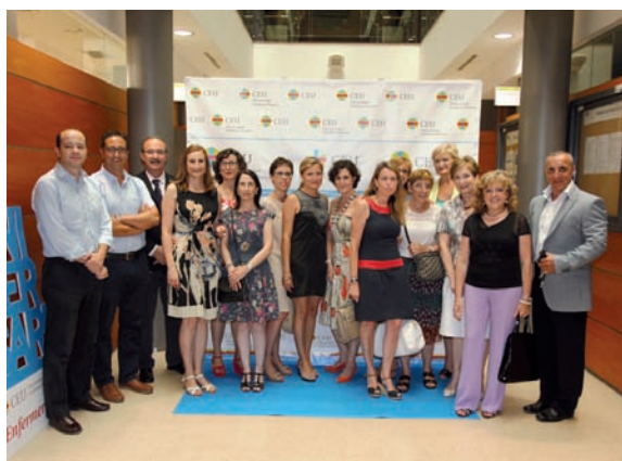
Foto de familia de algunos de los participantes en el acto del Aniversario 10+1 de Enfermería en la UCH-CEU