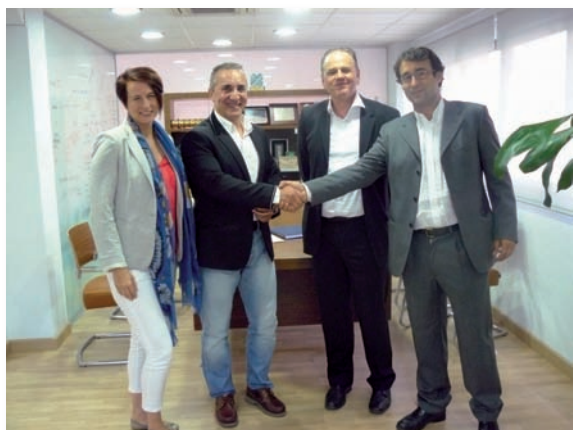
El presidente del Colegio de Valencia y representantes de la agencia Janaworks, durante la firma del convenio

El Colegio de Enfermería de Valencia y la agencia Janaworks, que agrupa a 16 empresas del sector de la tercera edad de Alemania, han firmado un convenio de colaboración con el fin de iniciar la selección de enfermeras valencianas para trabajar en Renania del Norte-Westfalia. El contrato será indefinido con las mismas condiciones laborales que tienen las sanitarias alemanas.