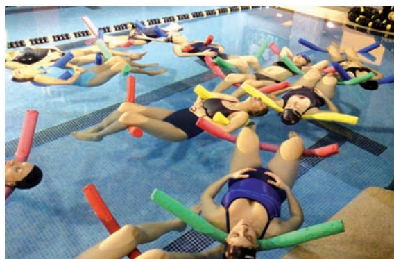
Un grupo de embarazadas practican el método AIPAP

El pasado mes de noviembre se presentó en el congreso de la Federación de Asociaciones de Matronas de España celebrado en Murcia y obtuvo el premio a la mejor comunicación oral. Y además ya ha sido presen-