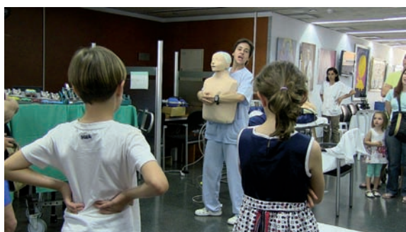
Una enfermera, durante la VII Jornada de Puertas Abiertas

El Hospital Provincial de Castellón reunió a alrededor de 3.000 personas en la séptima edición de la Jornada de Puertas abiertas del centro hospitalario en la que participaron decenas de asociaciones sociales, las unidades sanitarias del propio hospital y otras instituciones como el Colegio Oficial de Enfermería de Castellón (COECS), que mostró a los asistentes las características del trabajo enfermero.