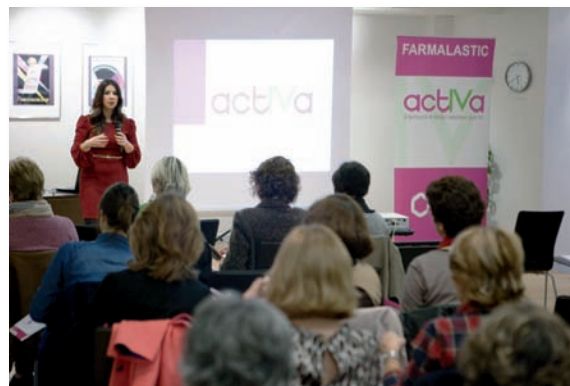
Una experta imparte el seminario sobre IVC

El curso se celebrará en el salón de actos del Colegio de Valencia el próximo 24 de octubre de 17 a 19 horas y las inscripciones se realizarán a través de www.enfervalencia.org en el lugar habilitado para matricula online desde el día 16 de septiembre.