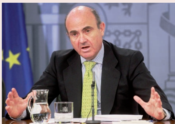
El ministro de Economía y Competitividad, Luis de Guindos, durante la rueda de prensa posterior al Consejo de Ministros que aprobó el anteproyecto de Ley

El Consejo de Ministros del pasado día 2 de agosto aprobó el anteproyecto de Ley de Servicios y Colegios Profesionales, elaborado por el Ministerio de Economía y Competitividad, que deroga la Ley 2/1974, de 13 de febrero, de Colegios Profesionales para “establecer paradójicamente un régimen muy similar a ése, de corte preconstitucional, en el que los Consejos Generales eran los superiores jerárquicos de los Colegios, con funciones de control y tutela; es decir, una estructura colegial totalmente arcaica y centralizada, alejada de toda practicidad”.