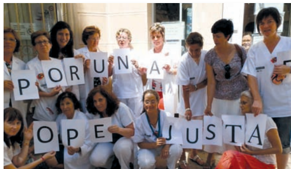
Protesta de enfermeras del Centro de Salud El Pla de Alicante