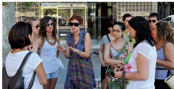
Imagen de la protesta ante la sede de la Conselleria de Sanidad en Valencia