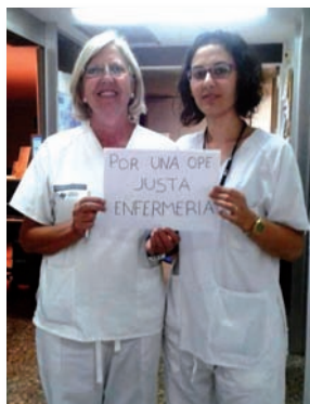
Apoyo desde el Hospital Clínico Universitario de Valencia

El primer examen de la OPE 2007 se llevó a cabo sin atender a las peticiones tanto de la Organización Colegial Autónoma de Enfermería como de los propios participantes en ella, lo que provocó un gran malestar que fue recogido a través de cientos de quejas por parte del CECOVA y los colegios de Alicante, Castellón y Valencia. Los servicios jurídicos colegiales facilitaron los modelos de impugnación de preguntas y de la propia prueba. En la actualidad, los participantes están a la espera de que se resuelvan tales alegaciones.