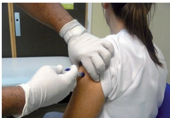
Un enfermero vacuna con una jeringuilla antipinchazos

El CECOVA solicitó a la Administración sanitaria que avance rápidamente en el desarrollo y concreción de las medidas que contempla la Orden ESS/1451/2013, de 29 de julio, por la que se establecen disposiciones para la prevención de lesiones causadas por instrumentos cortantes y punzantes en el sector sanitario y hospitalario, que transpone a la legislación española la Directiva Europea 2010/32/EU.