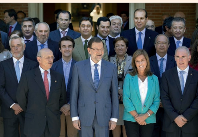
El presidente del Gobierno, Mariano Rajoy, junto a los principales protagonistas del Pacto en las escaleras del Palacio de la Moncloa

Los colegios de Enfermería de Alicante, Castellón, Islas Baleares, Murcia y Valencia emitieron un comunicado de prensa conjunto con respecto al Pacto por la Sostenibilidad y la Calidad del Sistema Nacional de Salud, un acuerdo que consideran “de excepcional importancia para el colectivo profesional de Enfermería”, que sin embargo, no ha satisfecho a todas las organizaciones colegiales de Enfermería.