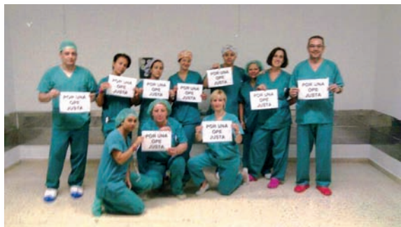
Enfermeras del servicio de Quirófano del Hospital de Elda respaldaron la protesta